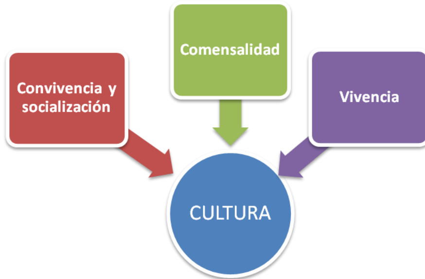
Figura 2. Categorización Cultura

Esta categoría está compuesta por los siguientes conceptos: