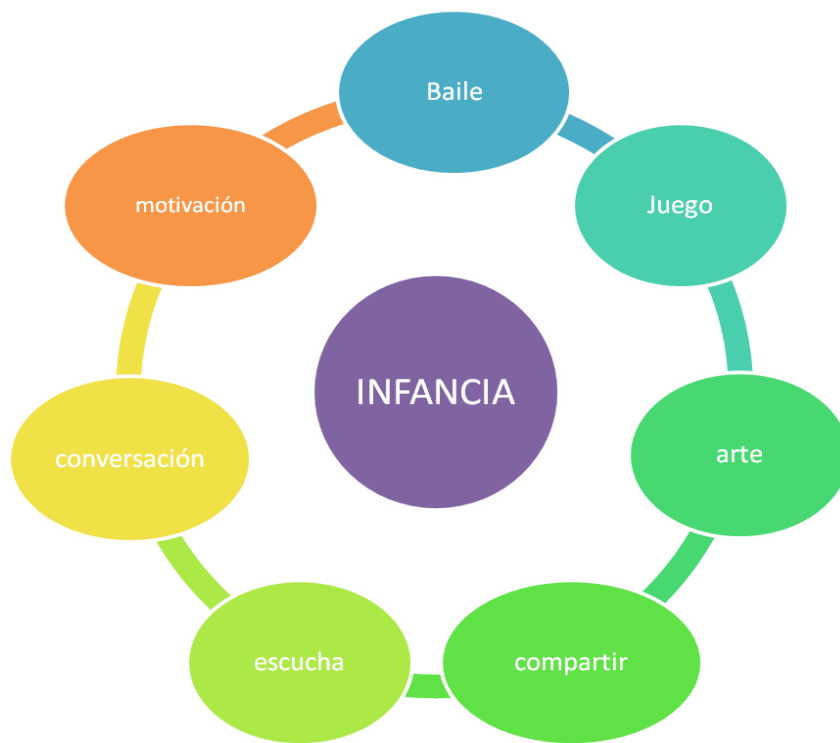
Figura 4. Educación de los sentidos y para el aprendizaje.

Para implementar los rincones pedagógicos se debe pensar en las necesidades básicas de los estudiantes, también se debe permitir que el niño participe y experimente libremente de los espacios brindados, esto con el fin de que cada uno construya su propio conocimiento y así mismo fortalecer los conceptos ya adquiridos.