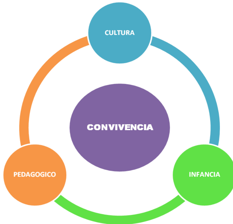
Figura 1. Categorías

De acuerdo con lo anterior, se propone una serie de categorías desde la cuales se apoya y dan sentido a la presente investigación: