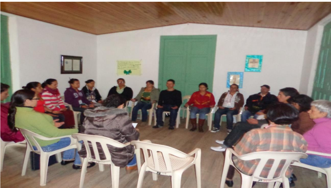
PROCESO DE FORMACIÓN DE ANIMADORES/AS , PASO 6 MANEJO DE RABIAS Y EMOCIONES