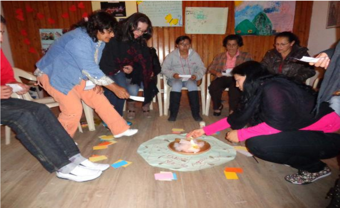
PROCESO FORMACIÓN ANIMADORES, PASO 3 CONTEXTO SOCIO POLITICO Y EFECTOS DE LA GUERRA