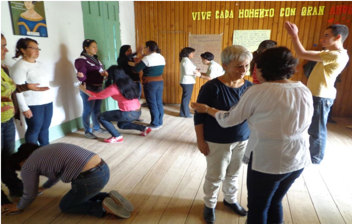
PROCESO FORMACIÓN ANIMADORES/AS PASO 7 MEMORIA