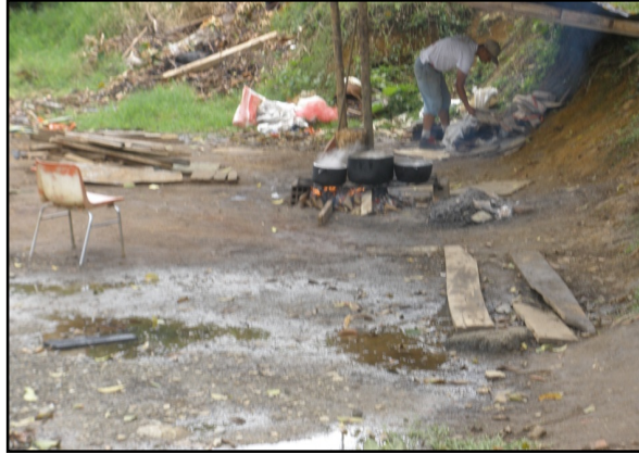
Imagen 3. Foto de residente cocinando con leña

La primera por razones económicas: No cuentan con red de gas, pero si con una pipeta de gas propano. La segunda: Debido al espacio abierto y lleno de árboles y vegetación, conseguir madera se les hace fácil. Como tarea de grupo se encargan unos de recoger la madera, otros de atizar el fuego y otro tanto de la preparación de los alimentos.