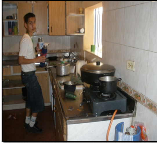
Imagen 1. Foto Cocina Fundación Hogar Nuevo Ser

Cabe destacar también como se efectúa el proceso de manipulación de los alimentos en la Fundación Hogar Nuevo Ser, cuando llegan los productos alimenticios a ella hasta que son consumidos por los residentes.