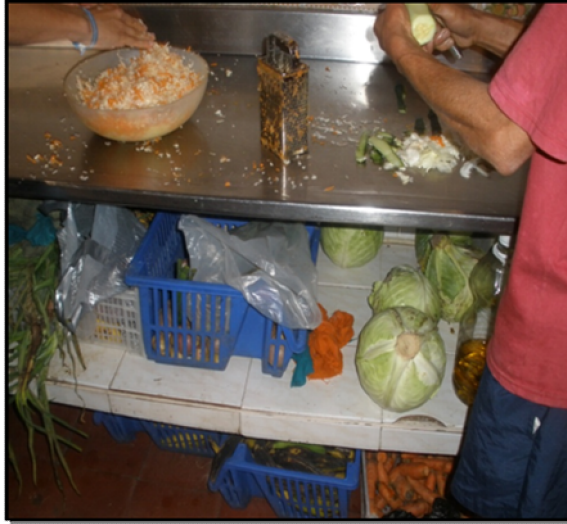
Imagen 2. Foto, clasificación de alimentos

Los alimentos pueden consumirse crudos y otros procesados. Este tipo de métodos pueden ser desde lo más elemental como es el lavado u otros más especializados como el cortado, adorno, mezcla y preparación de alimentos. Cuando se juntan estos procedimientos se dice que la comida se prepara. De este último procedimiento se encarga y direcciona la encargada de la cocina.