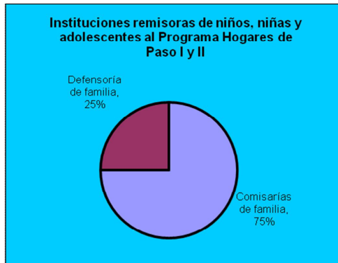
Grafico N° 3. Porcentaje de población infantil y juvenil que ingresa a través de Comisarías y Defensorías de familia a los Hogares de Paso.

En el grafico N° 3, se evidencia que a partir del 2007, los ingresos por Comisarías de Familia sobrepasan los ingresos por Defensorías de Familia, lo cual se debe a que las Comisarías de Familia han sido, durante estos dos años, el principal ente receptor de casos en los cuales se ven vulnerados o amenazados los derechos de los niños, niñas y adolescentes. Igualmente: