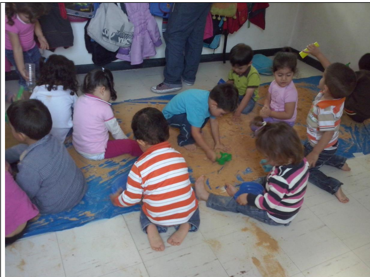
Exploración con arena. Preescolar