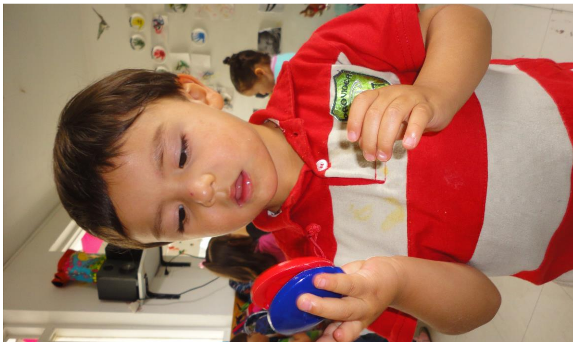
Reconocimiento del Grupo