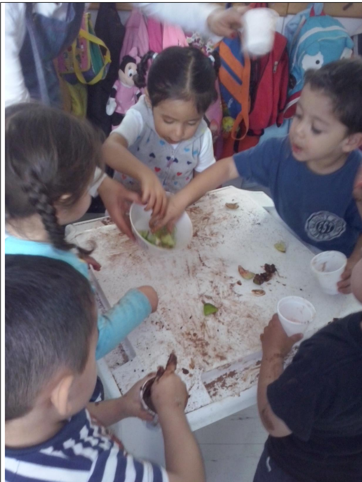
Exploración con masas. Preescolar 1