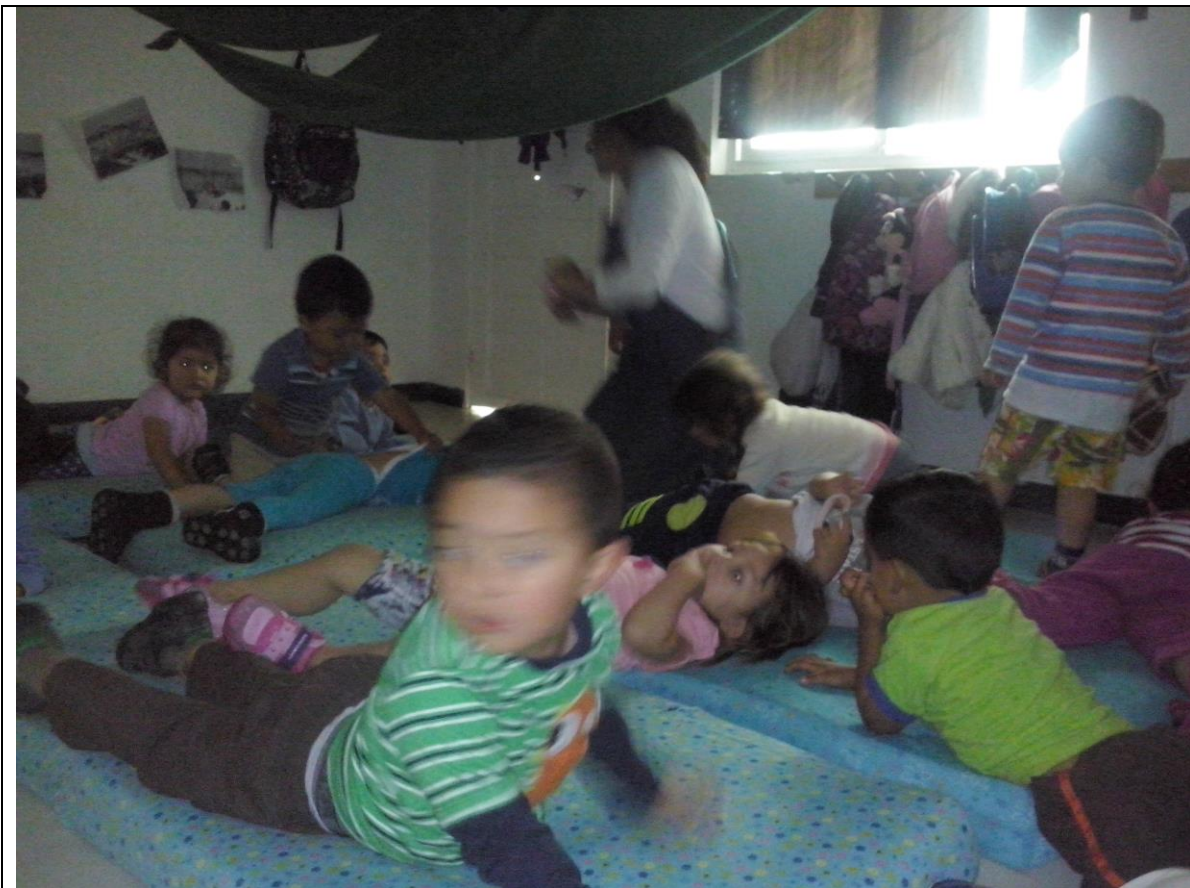
Masajes de relajación, Preescolar 1

3. ELEMENTOS COMPLEMENTARIOS (entrevistas, fotos, mapas, dibujos, gráficos, escritos, etc.). Este espacio corresponde al anexo de elementos importantes que al presentarlos de manera organizada se convierten en soporte esencial de la narrativa y el análisis presentados.