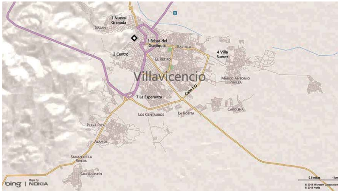
Plano de Villavicencio 2013