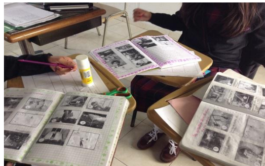
Ilustración 9 Reconstruyo la historia

El docente presentó una secuencia de imágenes en desorden que resumían el cortometraje. Los estudiantes las observaron y reorganizaron, escribiendo una oración corta que sintetizara cada imagen. Para lograr la máxima puntuación, según la escala, debían organizarlas correctamente.