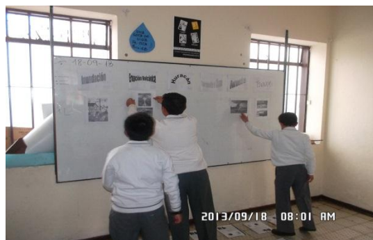
Ilustración 7 Jugando con imágenes

A partir de la realización de una tarea por parte de los estudiantes, se hizo una corta presentación al grupo, con el fin de diligenciar una tabla que corresponde a la temática planteada. Para alcanzar el máximo nivel de desempeño era necesario escribir tres características.