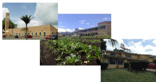
Ilustración 1 Colegio Seminario, Policarpa, Liceo Femenino.

Las aulas de las instituciones educativas en las cuales se llevó a cabo esta investigación, son testigo de las necesidades en cuanto a los procesos lecto-escriturales de niños y niñas que cursan grado sexto. Es entonces cuando surge la pregunta: ¿Cuáles son los factores que influyen para que los cuentos orales y escritos producidos por los estudiantes de los colegios Liceo Femenino Nuestra Señora del Pilar, Colegio Seminario San Juan Apóstol e I.E.M. Técnica Agropecuaria Policarpa Salavarrieta carezcan de hilo conductor?