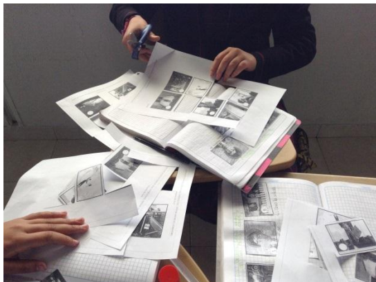
Ilustración 4 Proyecto de Aula: Reconstruyo la historia

En esta fase, los estudiantes realizaron las correcciones pertinentes al primer escrito y lo reescribieron teniendo en cuenta la rúbrica de evaluación y las sugerencias hechas por el docente.