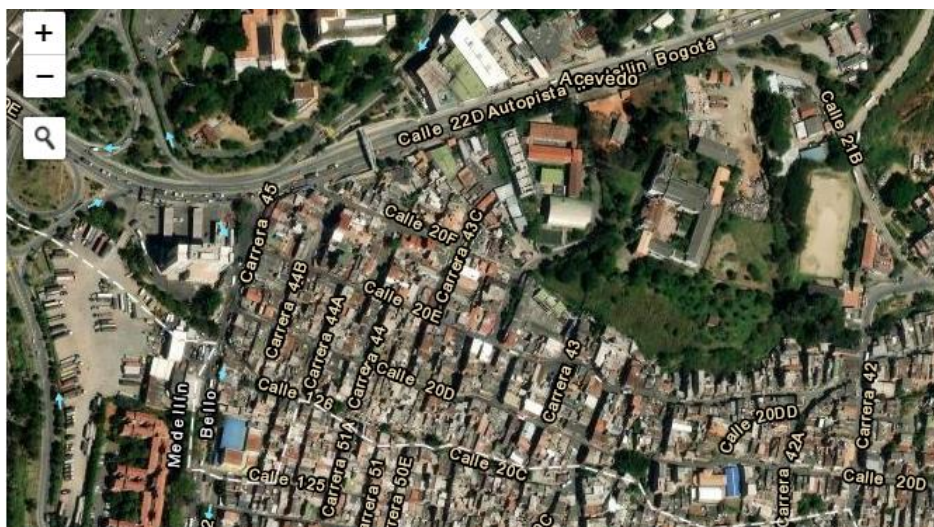
Ilustración 1. Imagen tomada de satélite

quedó la estación Acevedo y piensen que ese es el barrio Acevedo, mientras que su barrio lo nombran Zamora, el barrio que limita al norte y que nombra a la comuna 11 de Bello.