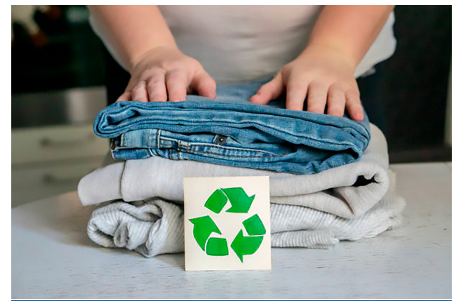
Fotografía tomada de un banco de imágenes