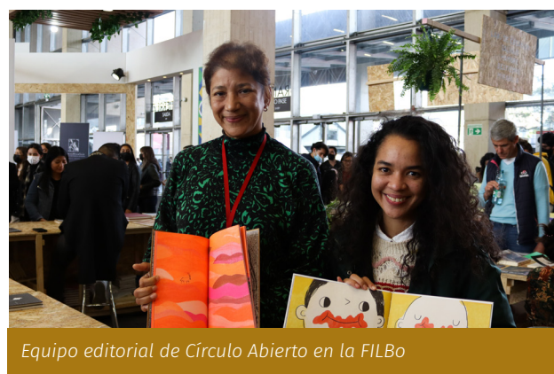
Equipo editorial de Círculo Abierto en la FILBo

Entre el 1 y el 5 de junio de 2022, Colombia