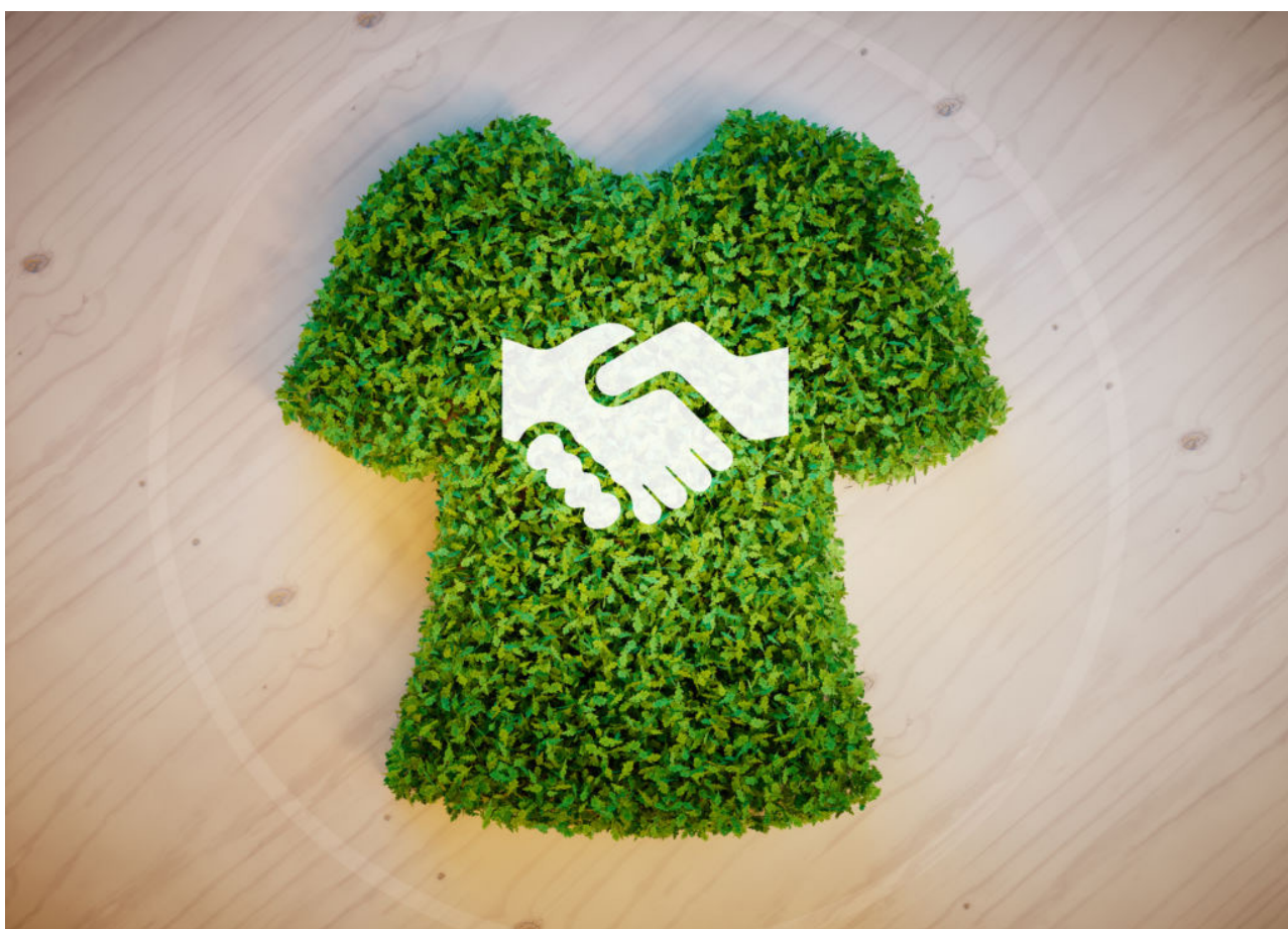
Fotografía tomada de un banco de imágenes