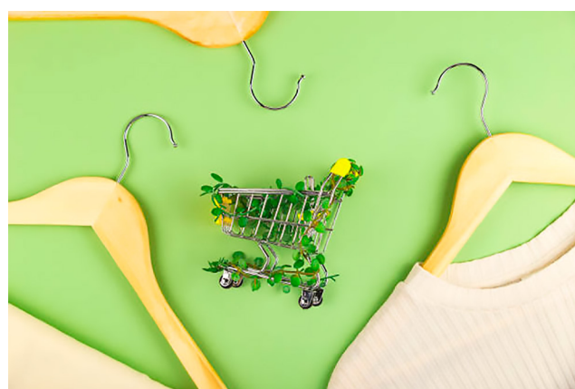
Fotografía tomada de un banco de imágenes