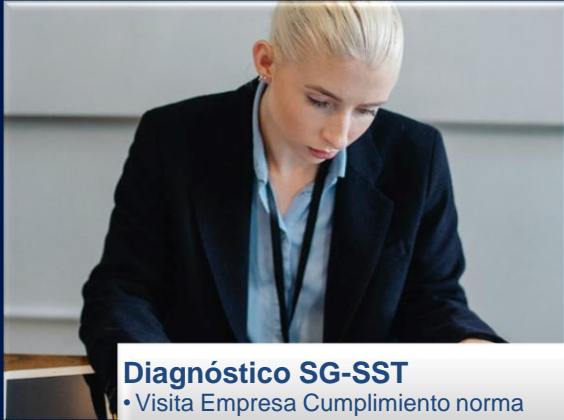
Diagnóstico SG-SST • Visita Empresa Cumplimiento norma • Entrega Matriz