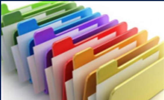
Elaboración Documentos • Formatos • Procedimientos