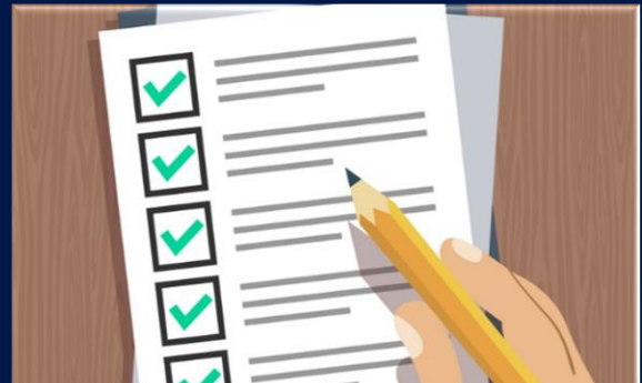
Elaboración Matrices • Diseño y Elaboración • Identificación Peligros