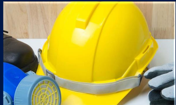
Revisión y Asesoría EPP • Revisión Elementos • Capacitación uso EPP