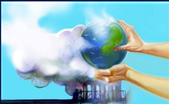
Programa Ambiental • Desarrollo Procedimientos • Disposición Residuos