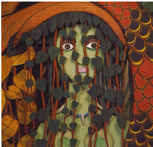
ESPÍRITU DEL MANGLAR, realizado por Hernando Tejada con madera de balsa policromada y que formó parte de su exposición en Bogotá.

Uno de los lacres de nuestra sociedad es la corrupción, que engendra como consecuencia la injusticia.