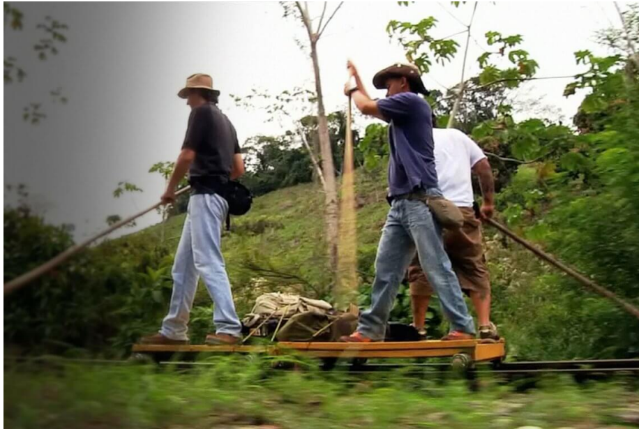
Ilustración 3 extraído de https://telemedellin.tv/documentales/el-hacedor-de-imanes/