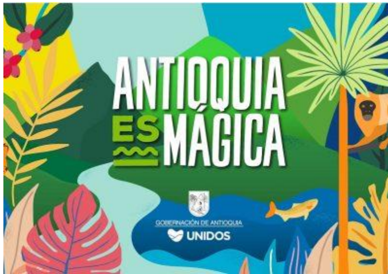
Ilustración 1