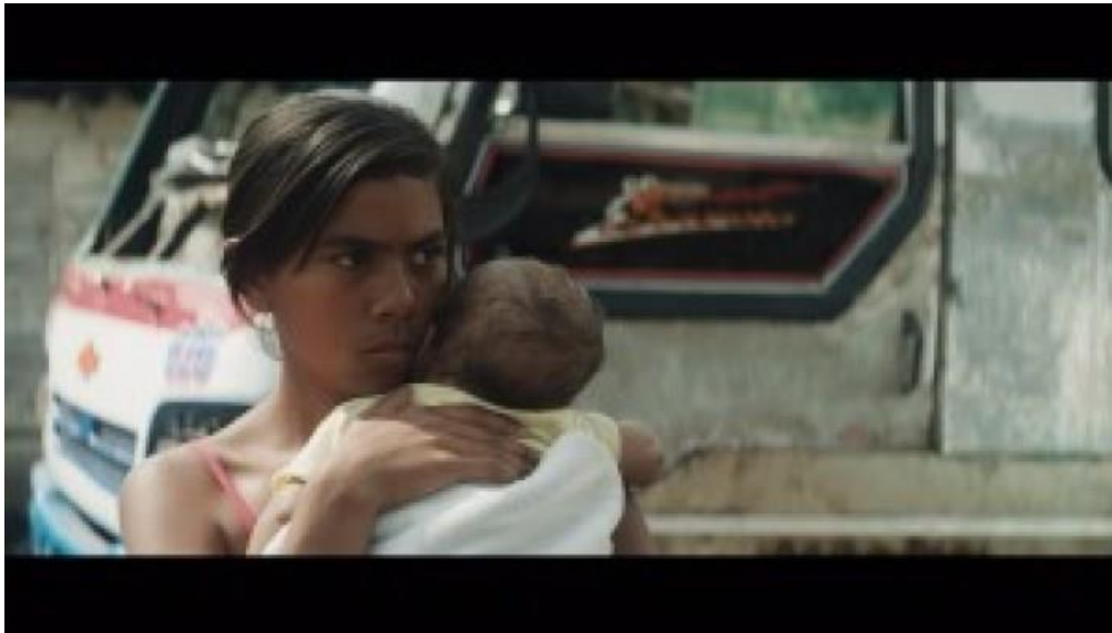
Ilustración 4 extraído de https://www.tiempodecine.co/web/desde-las-colinas-de-medellin/