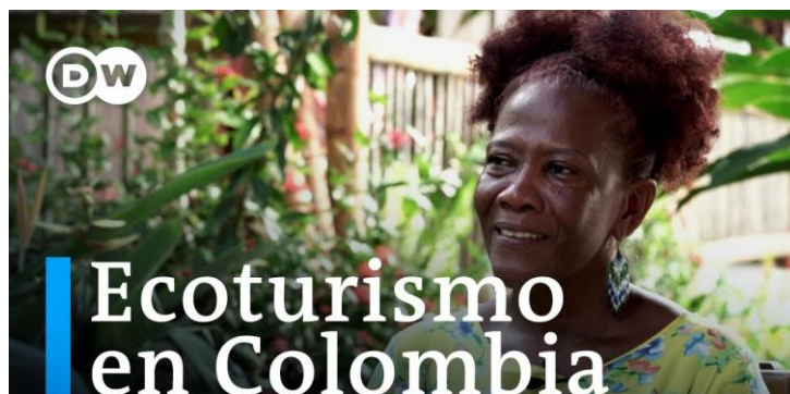
Ilustración 2 fotograma extraído de https://www.youtube.com/watch?app=desktop&v=NjbqPAAVh_A

Este proyecto audiovisual es pertinente contrastarlo en el documental de Atarrayando La Miel porque, aunque es una narrativa con temáticas distintas, brinda la oportunidad de ejemplificar escenarios donde sus pobladores tienen gran afinidad por las afluentes y da luz al espectador para entender con mayor familiaridad la manera en qué las comunidades más marginadas salen adelante a través del ecoturismo responsable.