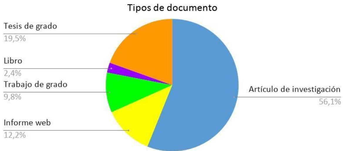
Figura 3 Tipos de documentos.

idioma inglés (33%), francés (13%), italiano (5%) y por último, portugués (5%). La consulta en diversos idiomas fue necesaria debido a que no se encontraron suficientes artículos en el idioma español. Además de esto, se identificó que la mayoría de los documentos utilizados en el presente trabajo fueron artículos de investigación (56.1%), continuando con tesis de grado (19.5%), informes web (12.2%), trabajos de grado (9.8%) y finalmente, libros (2.4%).