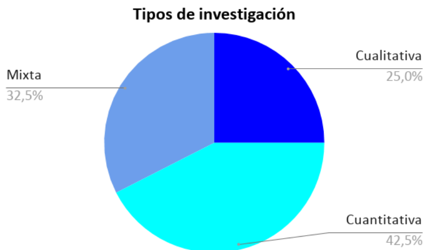
Figura 4 Tipos de investigación.

En el presente trabajo se consultaron diferentes tipos de investigaciones sobre la incidencia del hacinamiento en el bienestar emocional de los menores de edad, se evidenció que principalmente los estudios cuantitativos tienen un mayor índice en las investigaciones publicadas, tal vez, porque este enfoque de análisis de datos y numeración permite tener un mayor alcance en la recolección de información que se desea encontrar. En esta medida, se evidencia que el estudio de enfoque mixto se encuentra en la intermediación de tipo cuantitativo y cualitativo, donde este último engloba un menor número de publicaciones encontradas.