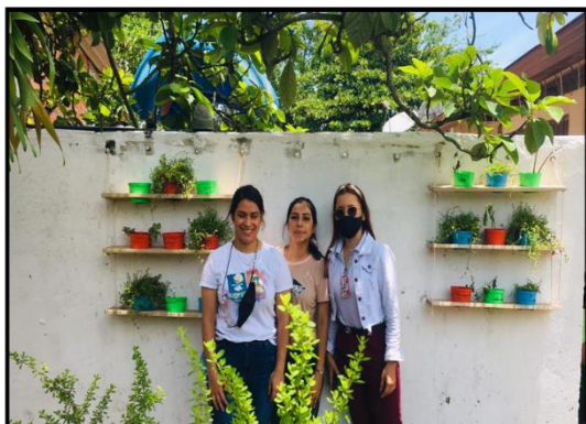
Nota. Presentación final de los jardines Fuente. Docente de la institución