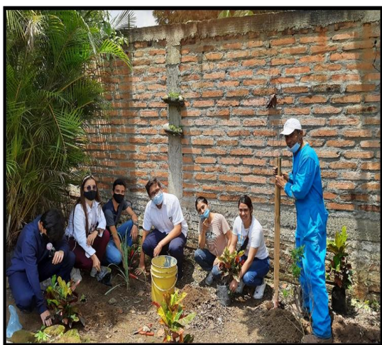
Nota. Actividad de embellecimiento y mantenimiento a las zonas verdes con entes externos