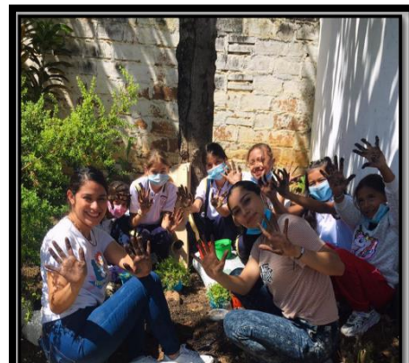
Nota. Actividad de creación jardines verticales