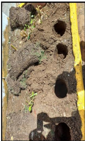
Nota. Actividad de embellecimiento y mantenimiento a las zonas verdes