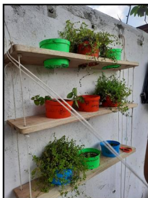
Nota. Estantes del jardín vertical.