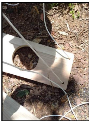
Nota. Elaboración de los estantes del jardín vertical.