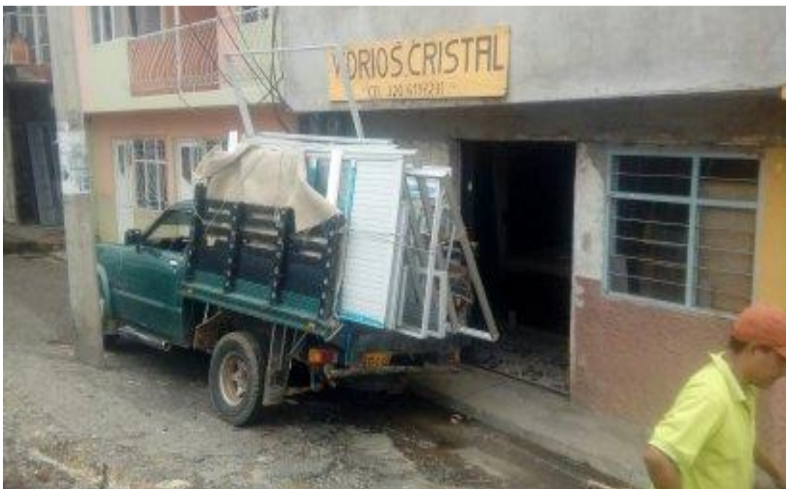
Imágenes de las instalaciones de la empresa Vidrios y aluminios Cristal en el municipio de Chachagüi.