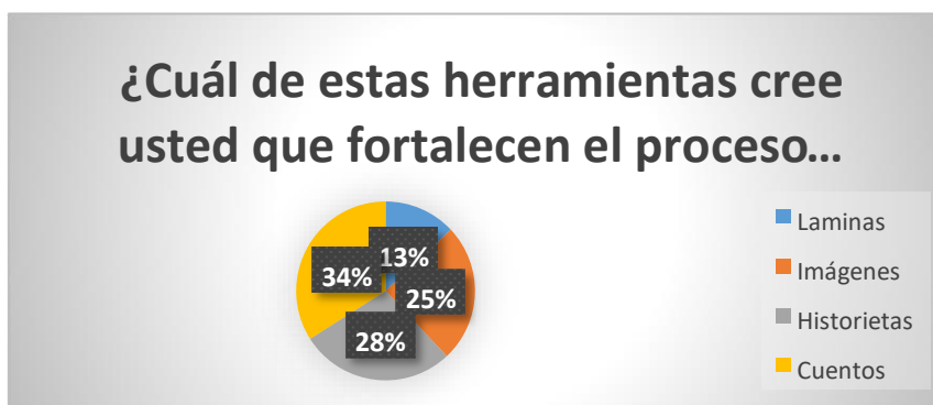
Gráfica 2: Cuestionario para padres y/o cuidadores

Esta grafica muestra que un 45% les leen cuentos infantiles, 15% no les leen ningún libro y el 30% solo para hacer tareas de otra área, se enfatizó en esta pregunta para buscar una fuente más clara acerca de las causas de la desmotivación por la lecto escritura, donde se logra evidenciar que los cuentos son la mayor herramienta para despertar un hábito lector en los estudiantes. Debido a esto la motivación tiende a descender durante la clase, lo que conlleva a un análisis de las estrategias que se plantean en clase para el proceso de aprendizaje de la lecto escritura. de éstas por parte de los docentes.