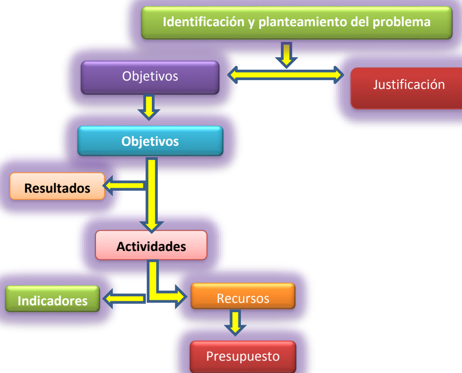
Figura 2: Ciclo del proyecto en su identificación y formulación: guía para las organizaciones de víctimas, Gil (2007)

Para este fin, se propone determinar la estructura y factores claves para el desarrollo de la herramienta pedagógica a través de una guía práctica para formulación de proyectos, que a continuación se determina en la siguiente figura.