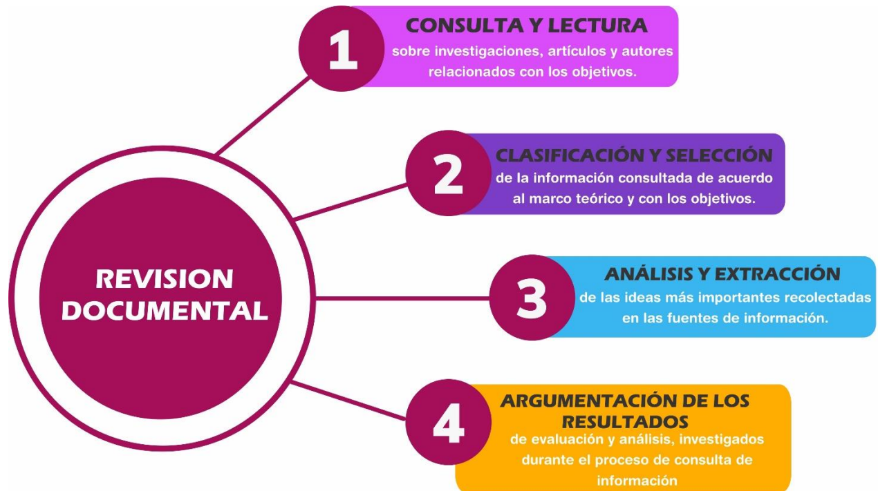
Figura 2. Flujoograma de revisión documental