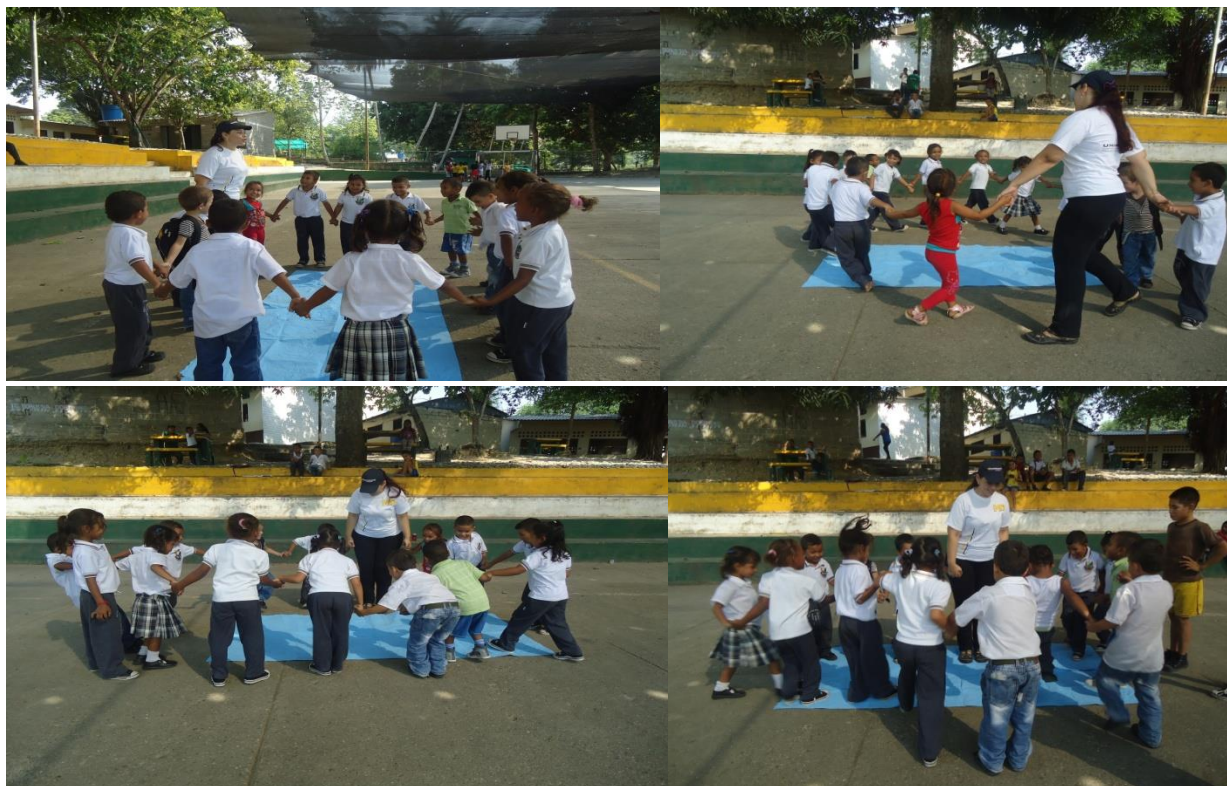
Evidencias fotos 13, 14, 15, 16: el juego me motiva a participar.