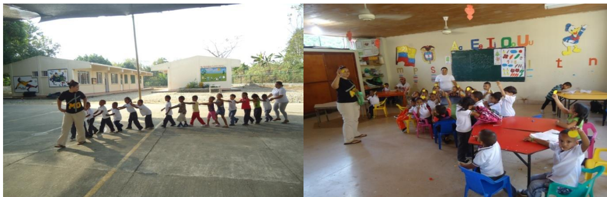
Evidencias fotos 11, 12: pintando me divierto