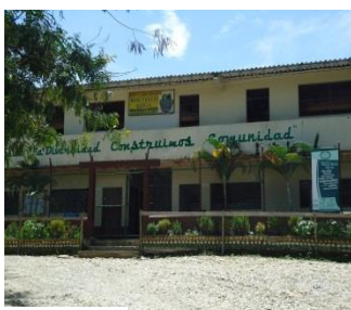
Foto 1 Institución Educativa Nancy Rocío García

La Institución Educativa Nancy Rocío García está ubicada en el corregimiento de Buenos Aires perteneciente al municipio de Zaragoza, en la actualidad atiende a una población estudiantil de 600 estudiantes en su área urbana y de 200 en la rural, la Institución se ha