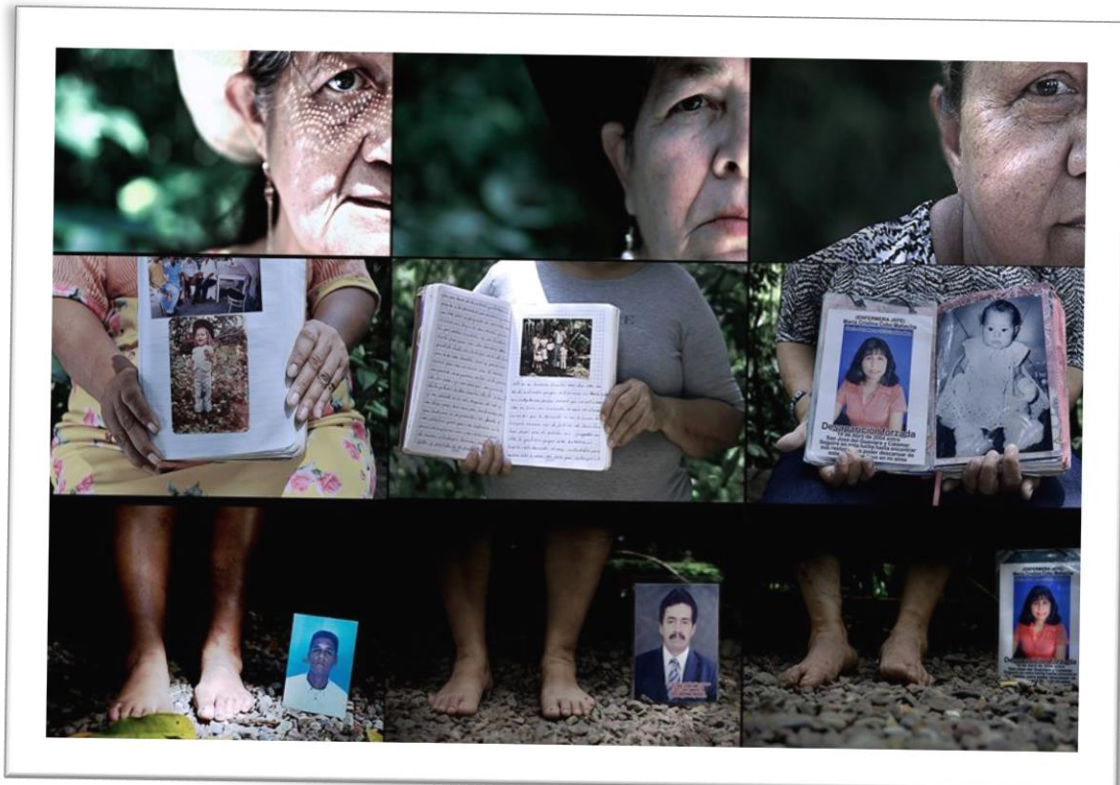
Ilustración 5. Presentación del cuaderno de la memoria por las mujeres víctimas de desaparición forzada.