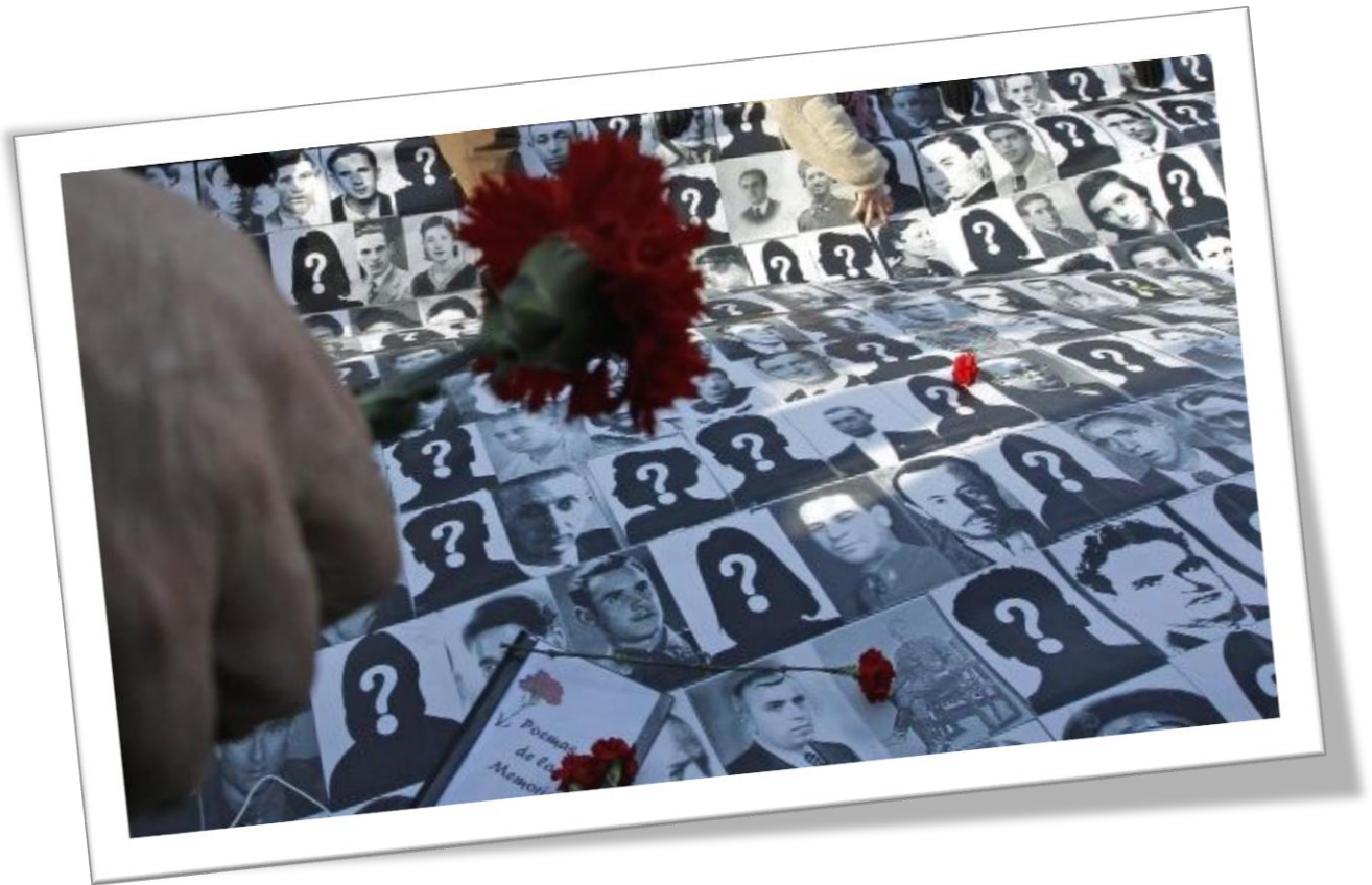
Ilustración 1. Galería de Personas por Desaparición Forzada.