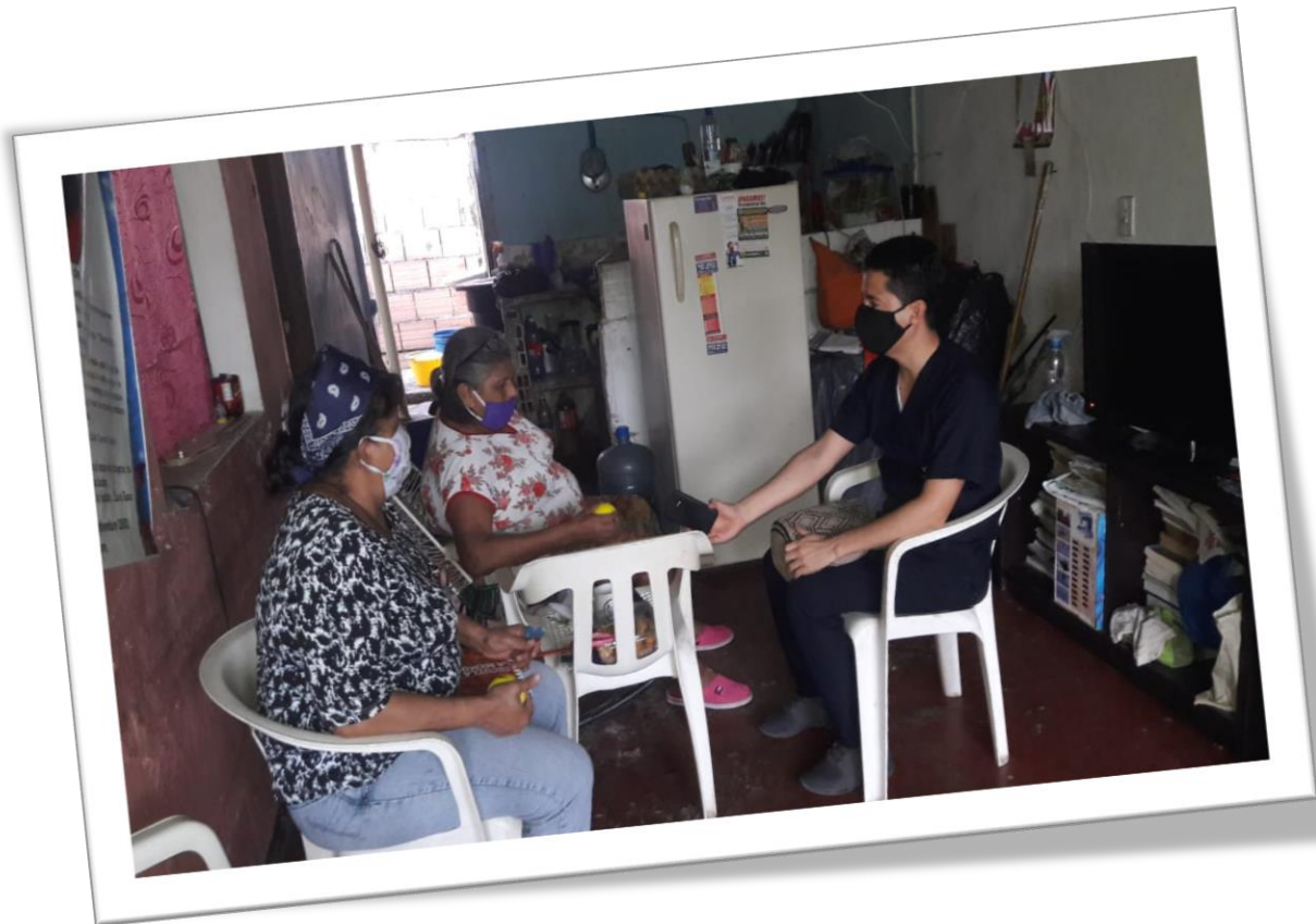
Ilustración 4. Fotografía del grupo de discusión con líderes.