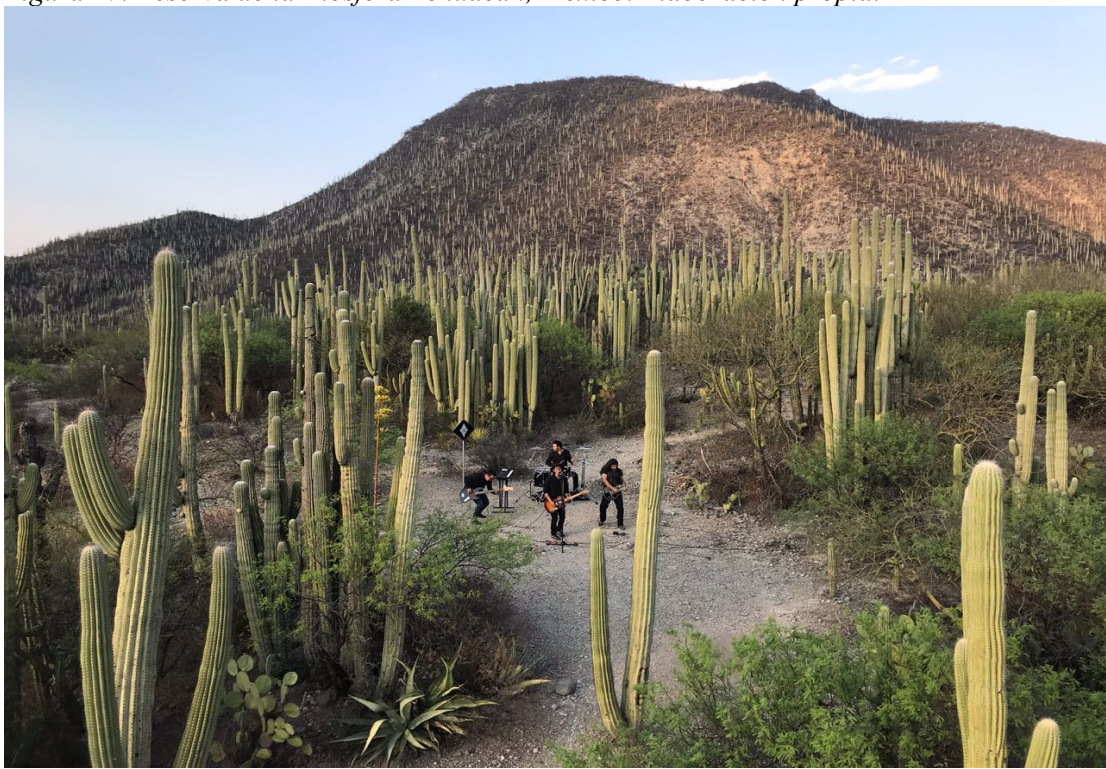
Figura 28. Grabación de video musical, Reserva de la Biosfera Tehuacán, México. Elaboración propia.