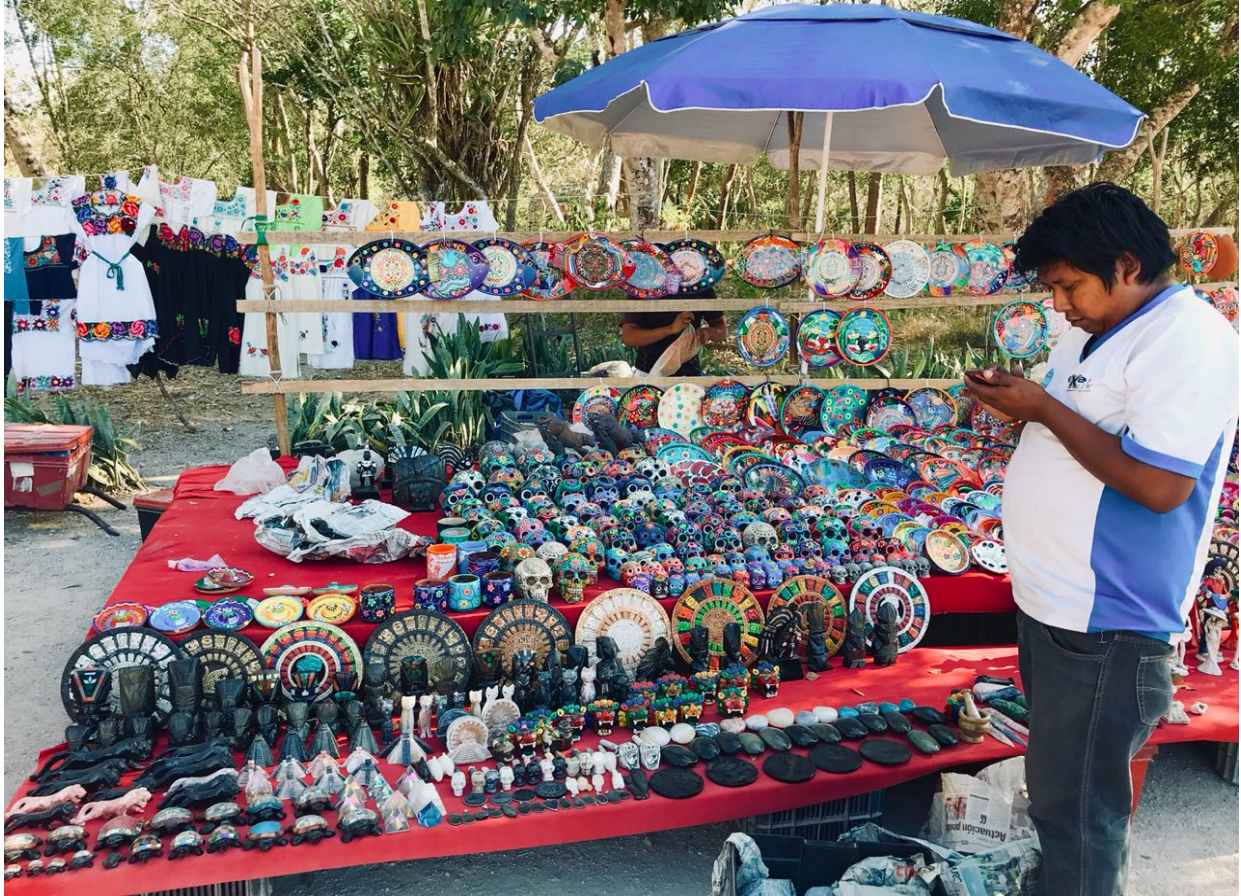
Figura 4. Puesto de artesanías, Ciudad de México. Elaboración propia.