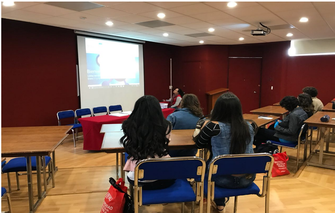
Figura 18. Salón "menor de aprendizajes audiovisuales", Universidad Iberoamericana de Puebla, Puebla-México.