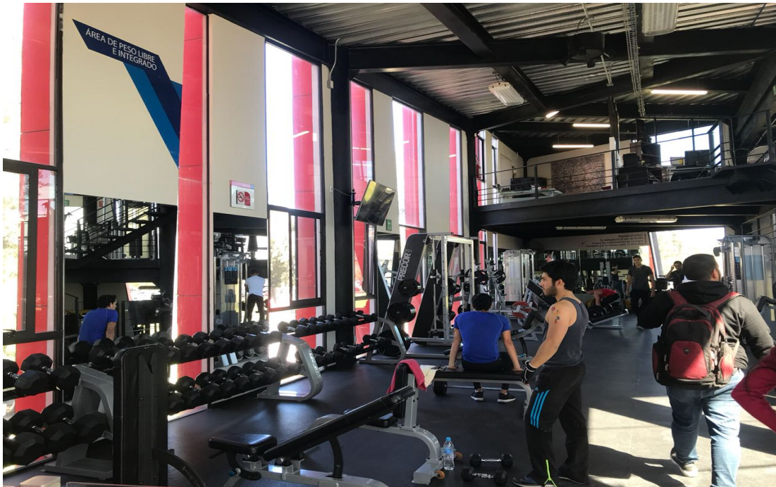
Figura 16. Gimnasio con equipo de pesas, Universidad Iberoamericana de Puebla. Elaboración propia.