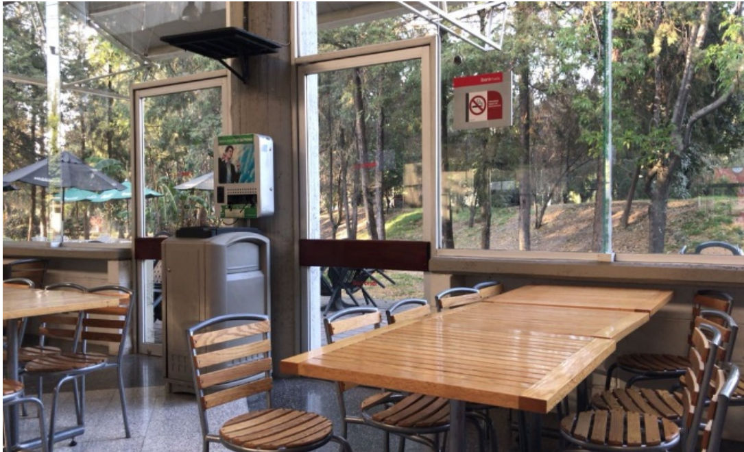
Figura 17. Cafetería central, Universidad Iberoamericana de Puebla, Puebla-México. Elaboración propia.