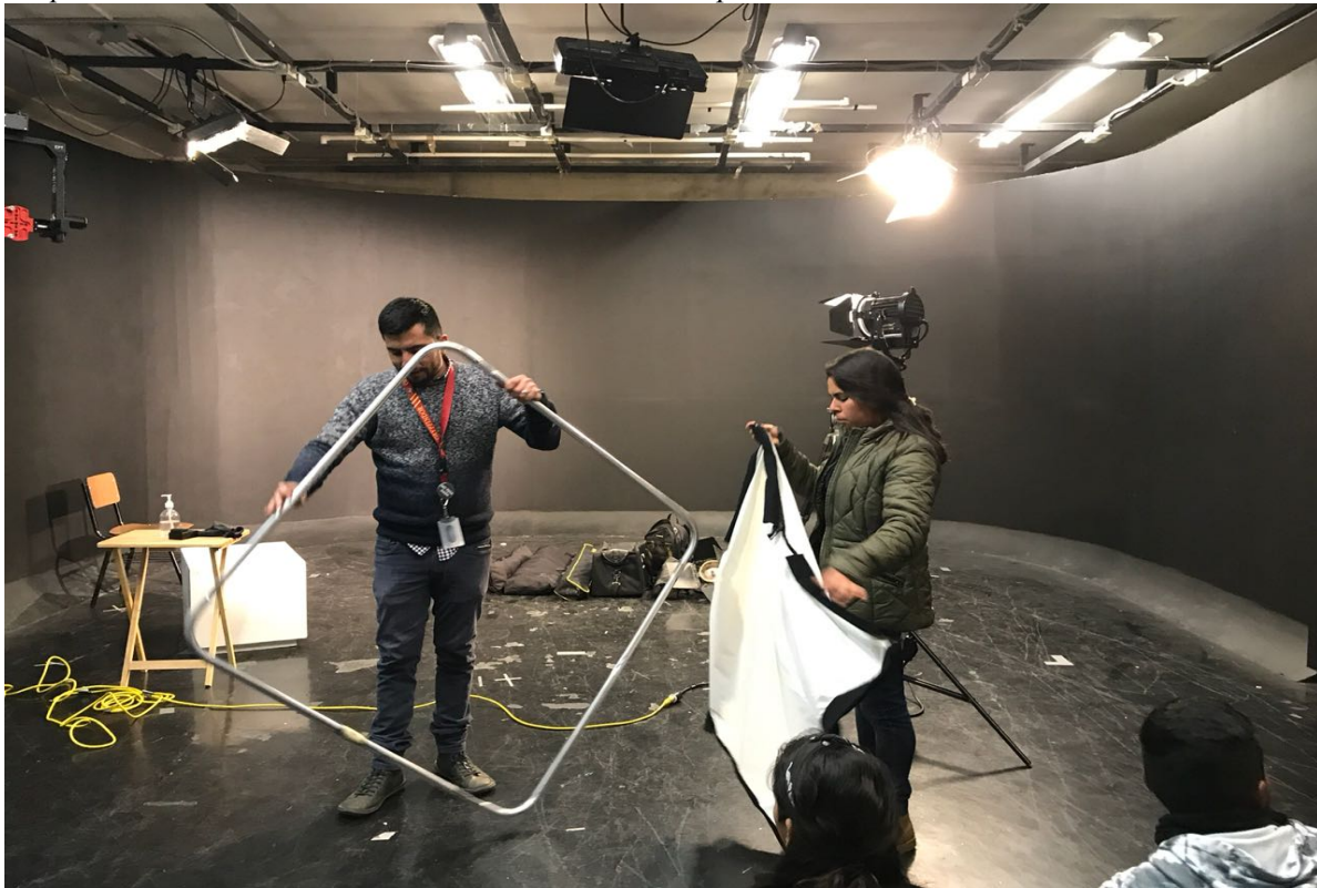
Figura 21. Estudio de Televisión, Universidad Iberoamericana de Puebla. Elaboración propia.