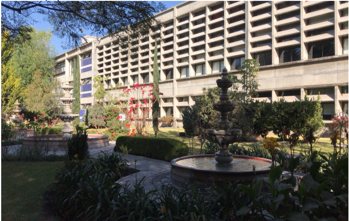
Figura 12. Al fondo Edificio H, Planta baja, Universidad Iberoamericana de Puebla, Puebla-México.