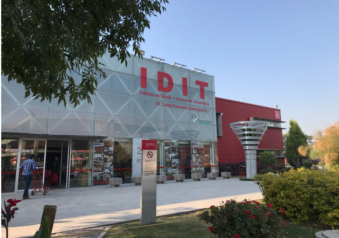
Figura 13. Instituto de Diseño e Innovación Tecnológica, IDIT, Edificio J, Universidad Iberoamericana de Puebla, Puebla-México. Elaboración propia.