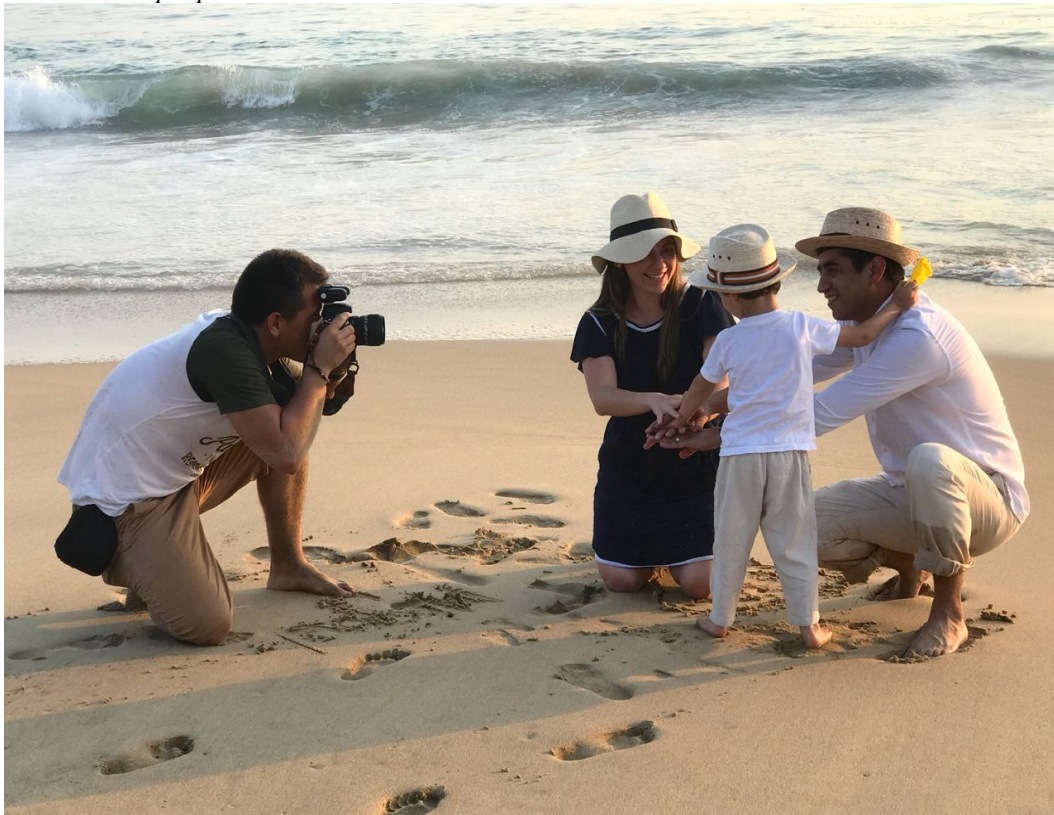
Figura 32. Sesión fotográfica en Acapulco, México. Elaboración propia.