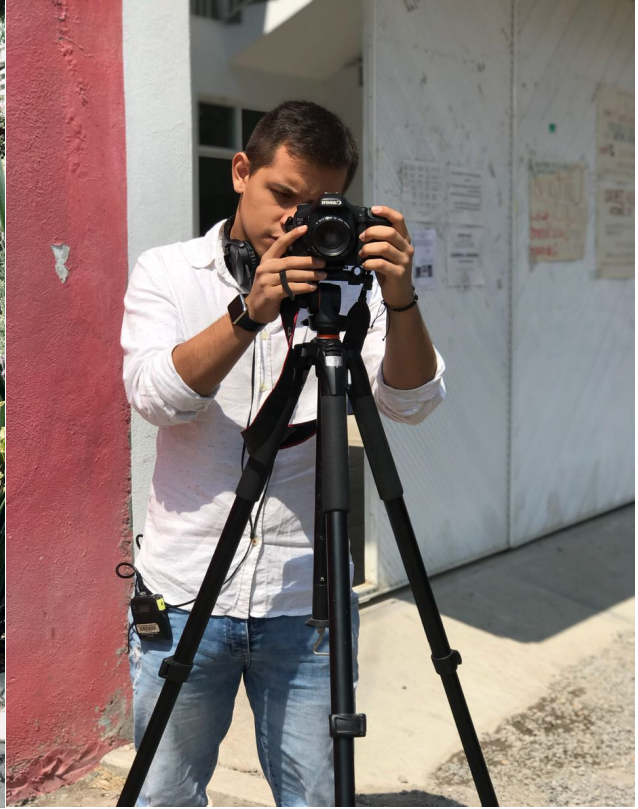
Figura 20. Prácticas en CASA IBERO. Elaboración Propia.