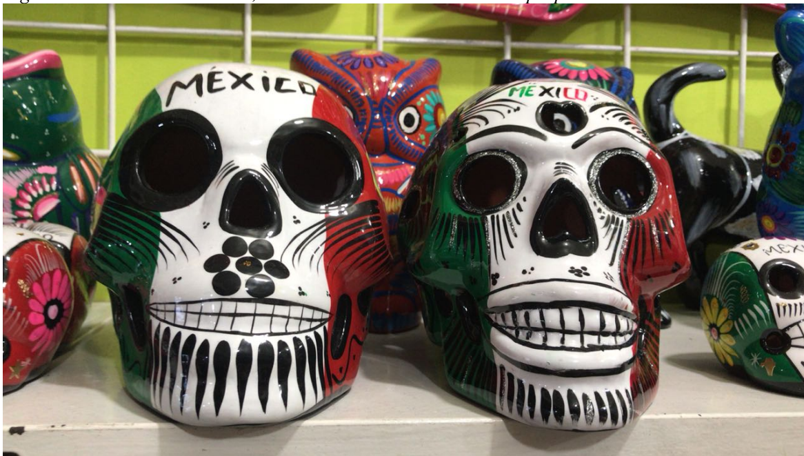
Figura 5. Calaveras artesanales, Ciudad de México. Elaboración propia.