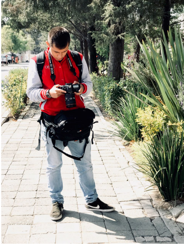
Figura 19. Primer día de prácticas.