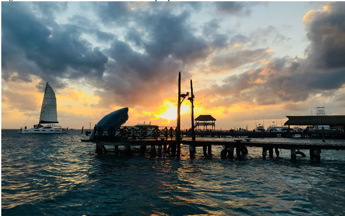
Figura 30. Playa del Carmen, México. Elaboración propia.