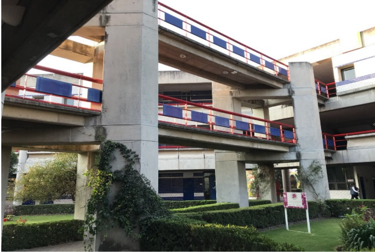
Figura 11. Edificio H, Planta baja, Universidad Iberoamericana de Puebla, Puebla-México Elaboración propia.