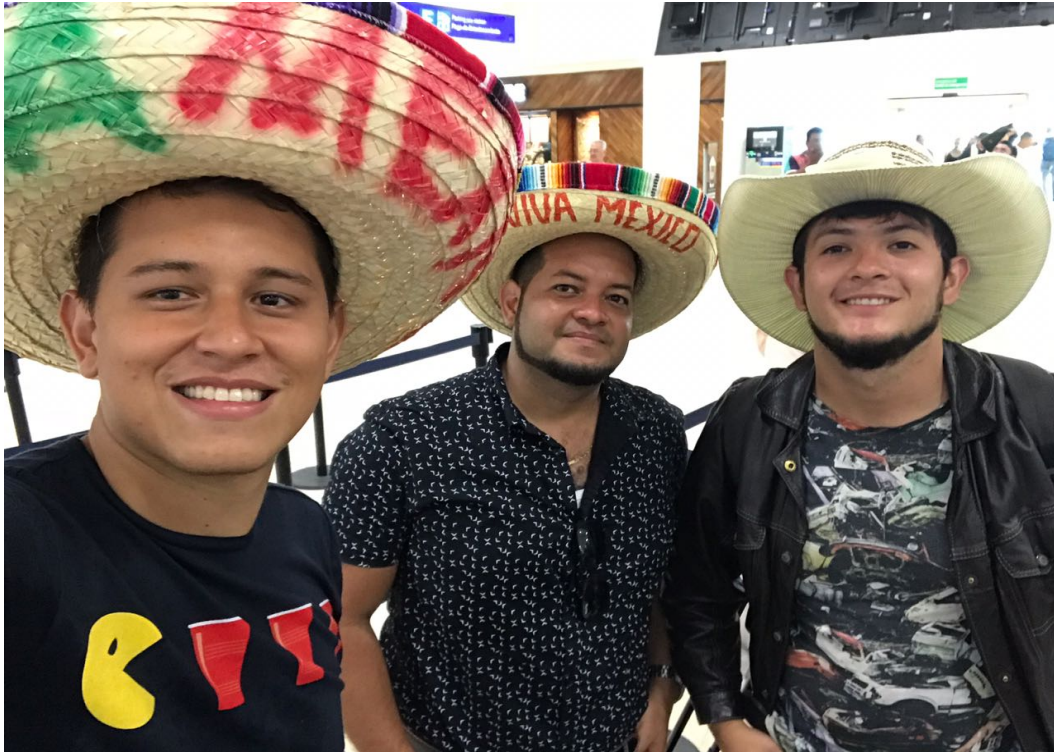
Figura 31. Última fotografía antes del vuelo a Bogotá, salida desde Cancún, México. Elaboración propia.