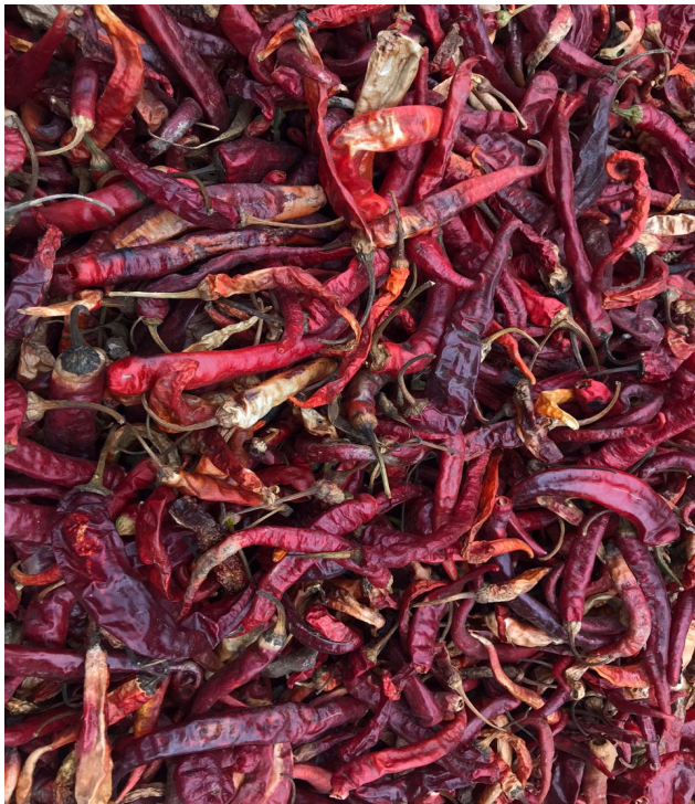
Figura 24. Chiles. Elaboración propia.

Podría concluir diciendo que la cultura mexicana y colombiana se asemejan, la una pueda que tenga mejores atributos que la otra y viceversa. Tal vez, México sea el país más parecido a Colombia en Latinoamérica. Al igual que en Colombia, tiene mucho trabajo que hacer para que mejore como país, en calidad de vida y en oportunidades. Pero, en algo están en un paso por delante y es que se movilizan y participan más desde las calles en busca de reivindicaciones o exigencias de sus derechos, y ese ya es un “plus” que hace la diferencia.