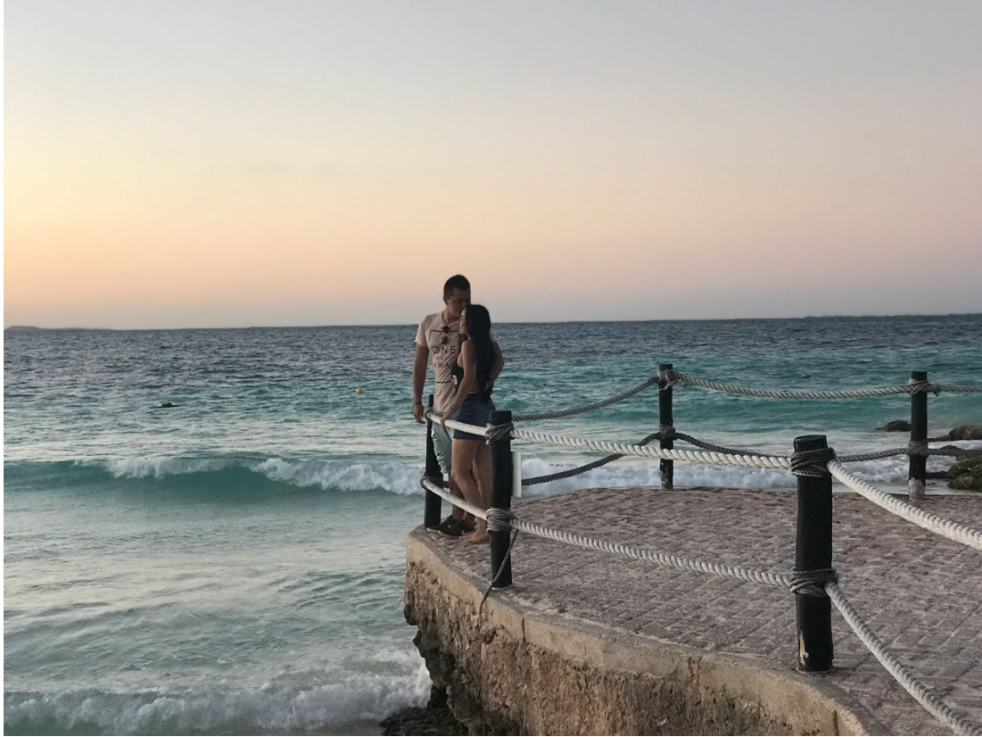
Figura 29. Cancún, México. Elaboración propia.