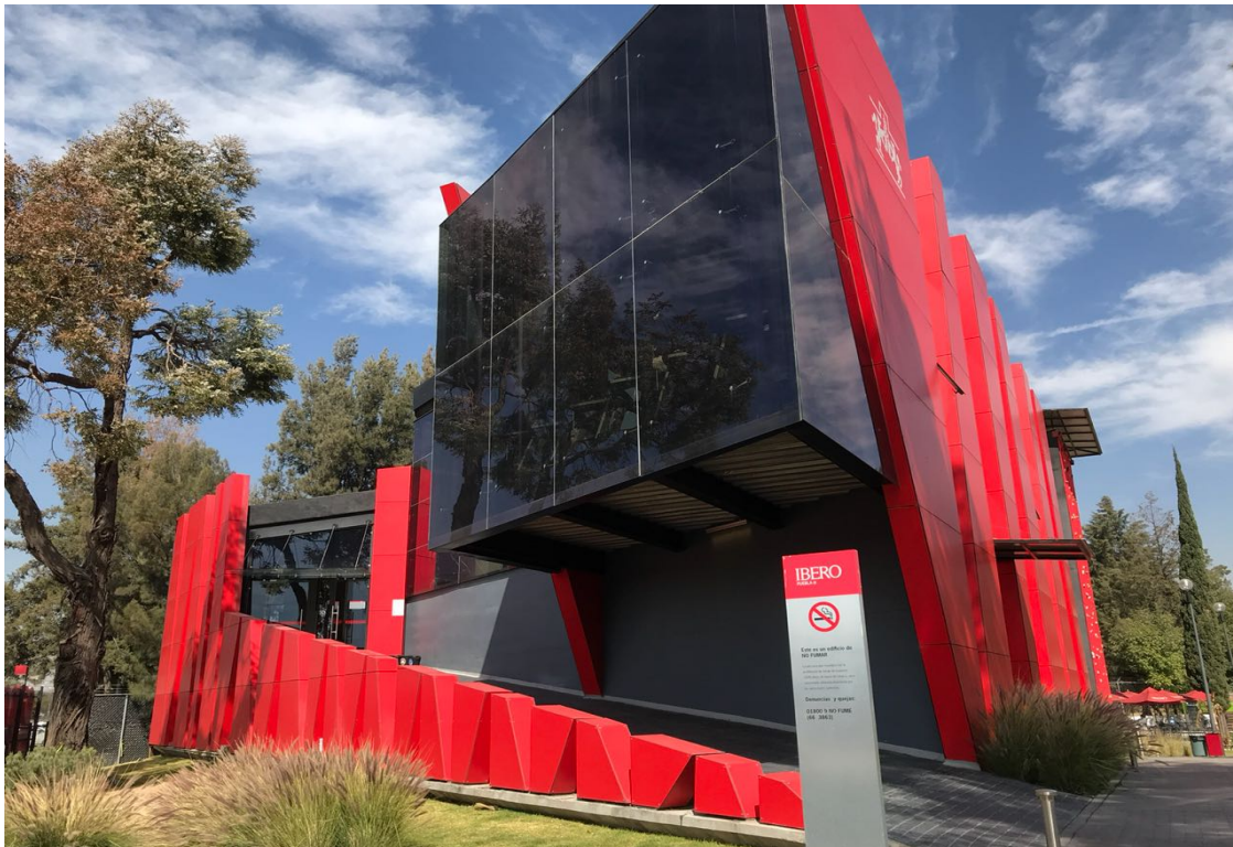
Figura 14. IDIT, Edificio J, Universidad Iberoamericana de Puebla, Puebla-México. Elaboración propia.