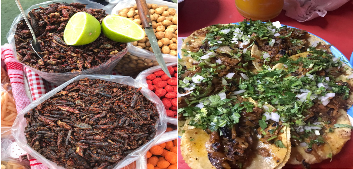
Figura 1. "Chapulines". Elaboración propia. Figura2. Tacos al pastor. Elaboración propia.