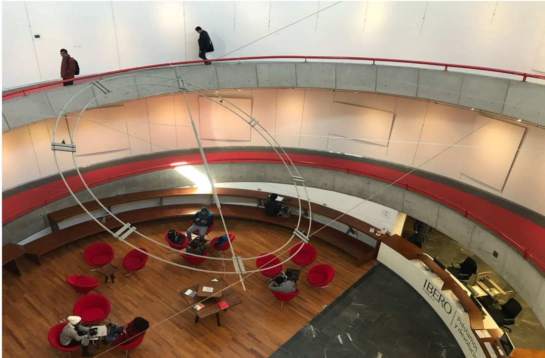
Figura 15. Biblioteca P. Pedro Arrupe S.J., Segundo Piso, Universidad Iberoamericana de Puebla, Puebla-México. Elaboración propia.