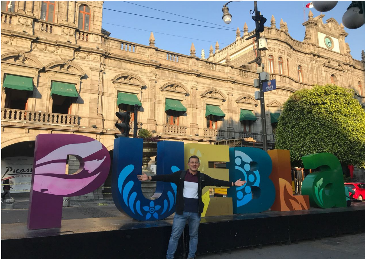
Figura 6. Ciudad de Puebla, México. Elaboración propia.

Antes de contextualizar a Puebla, es necesario aclarar que la siguiente información está basada en la página www.laciudaddepuebla.com .