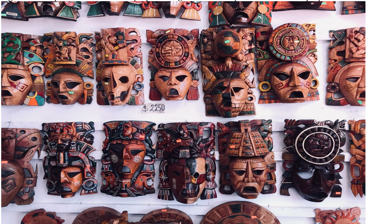
Figura 3. Artesanías, Ciudad de México. Elaboración propia.