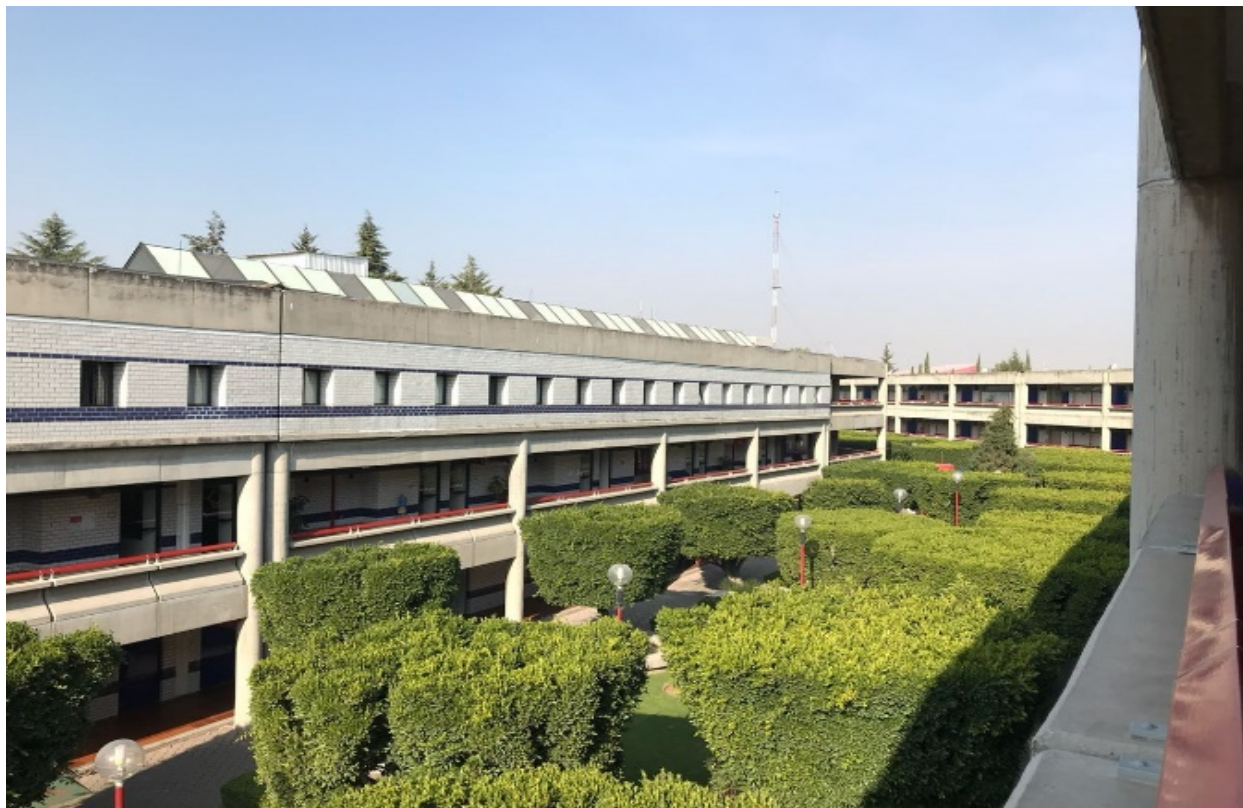
Figura 10. Edificio D, Segundo Piso, Universidad Iberoamericana de Puebla, Puebla-México. Elaboración propia.