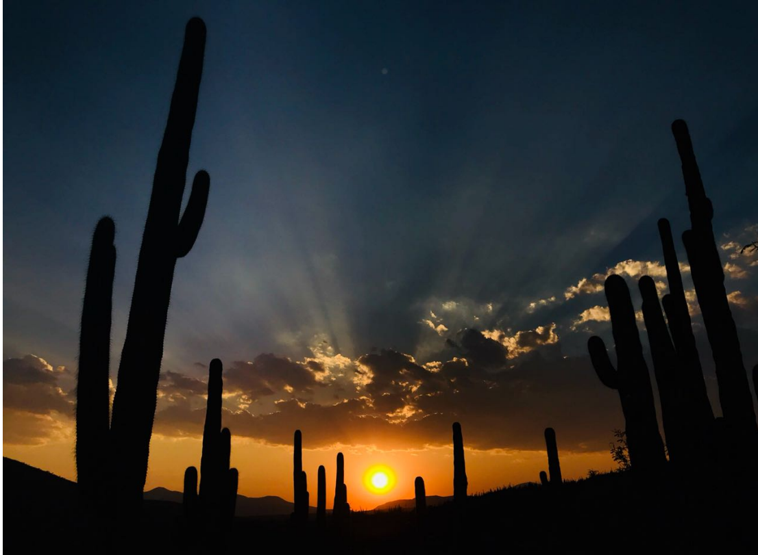
Figura 27. Reserva de la Biosfera Tehuacán, México. Elaboración propia.