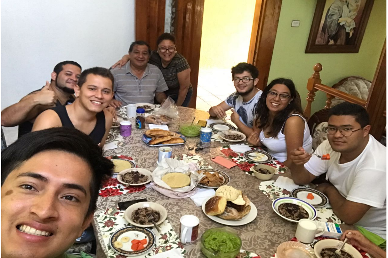
Figura 26. Familia que nos hospedó en Veracruz. Elaboración propia.