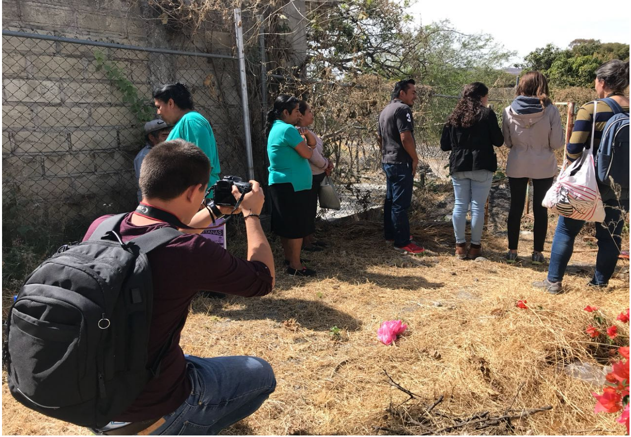
Figura 23. Reconocimiento de la comunidad Valle del Paraíso, Puebla- México. Elaboración propia.