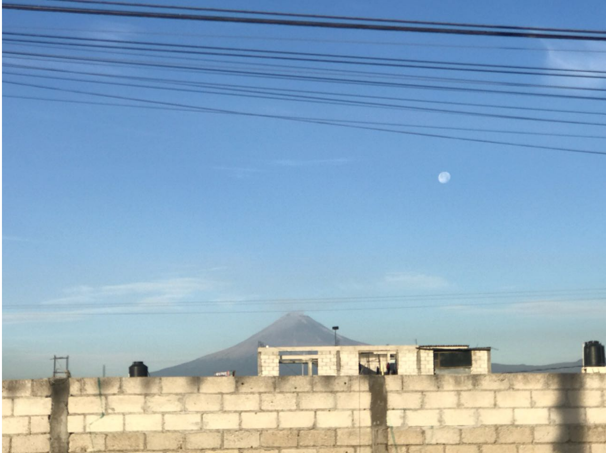
Figura 7. Volcán de Popocatépetl visto desde la ciudad de Puebla, México. Elaboración propia.