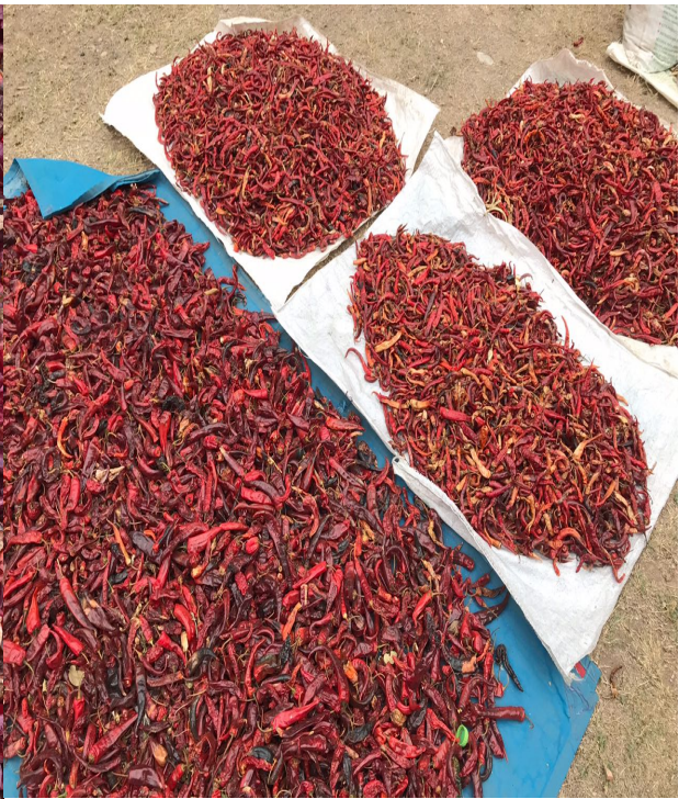
Figura 25. Chiles. Elaboración propia.