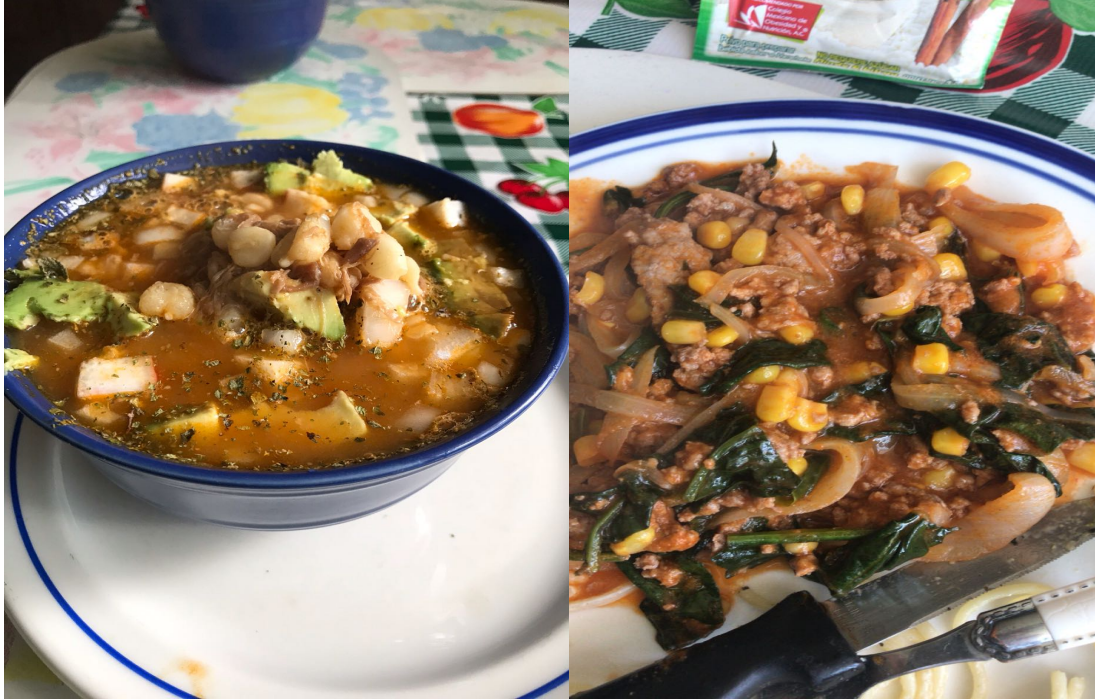
Figura 8. Pozole, plato autóctono de México. Figura 9. Pozole. Elaboración propia. Elaboración propia.