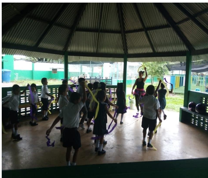
Ilustración 5 Salta y salta

A continuación, se relacionan las actividades realizadas por las investigadoras.