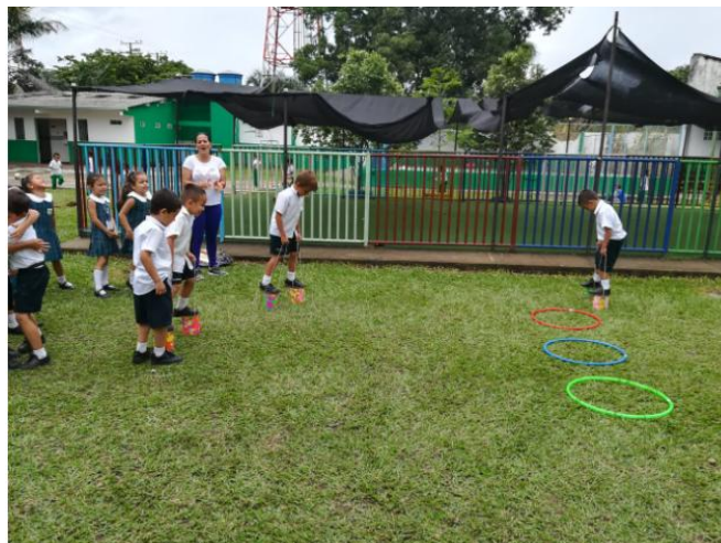
Ilustración 13 Un nuevo camino