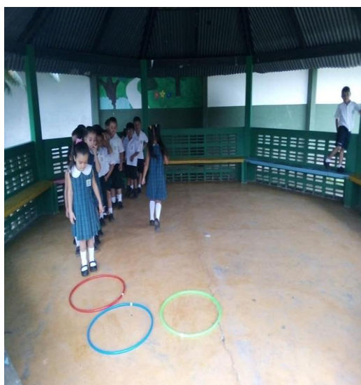
Ilustración 2 El aro

A continuación, se presenta la evidencia respectiva de la aplicación de la anterior propuesta: