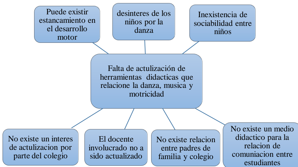
Gráfica 1 Problemática

Consintiendo así, la propuesta pedagógica enfocada a niños y niñas de transición del colegio COFREM de Puerto López Meta, el cual se enfoca en el aprendizaje partiendo de nuevas herramientas didácticas, que hacen que el niño aprenda de formas más activas y comunicativas; la danza no solo se caracteriza por estimular la motricidad gruesa y fina, sino que también por medio de esta se realizan avances de conocimientos nuevos.