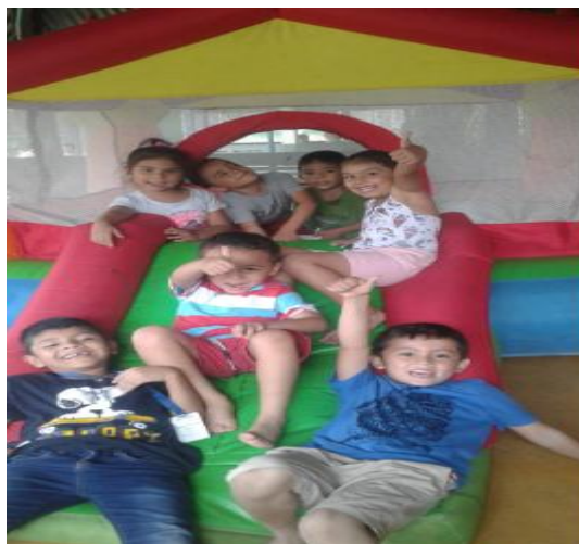
Ilustración 9 Baile del cien pies