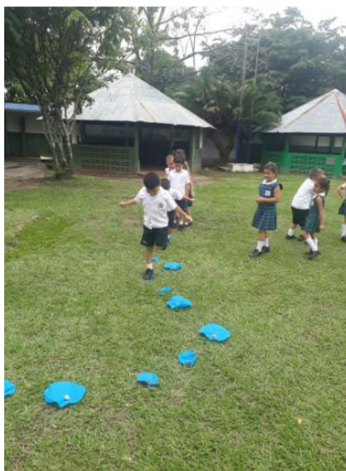
Ilustración 14 Una felicidad absoluta

A continuación, se relacionan evidencias de la realización de la actividad.