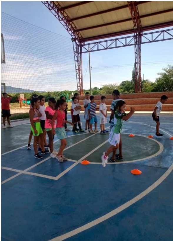
los demás niños y niñas que están a su alrededor.

1.1.1 Rev. latinoam. educ. inclusiva vol.13 no.2 Santiago dic. 2019