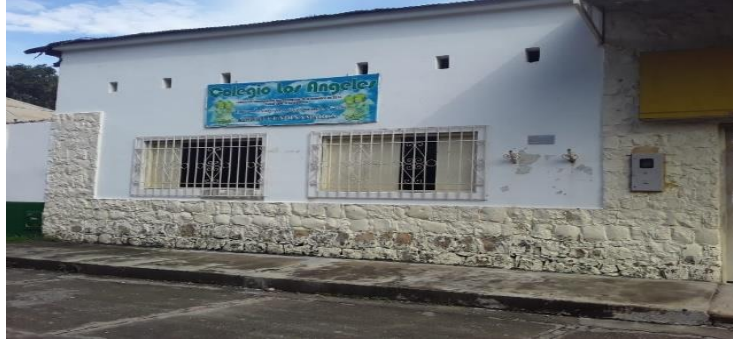
Ilustración 2 colegio los Ángeles