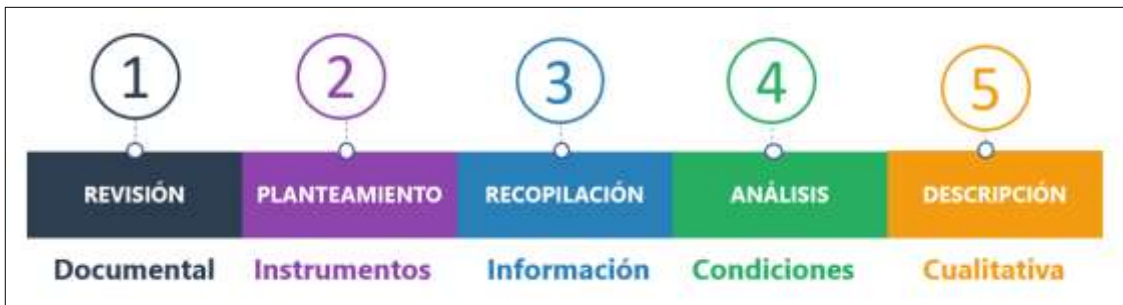
Figura 2. Procedimientos de la investigación.

Esta investigación está organizada de la siguiente manera (figura 2), en principio se diseñaron los instrumentos, luego se aplicaron, se obtuvieron resultados y con todo lo anterior se logró describir el papel del gerente en función de la mejora de las condiciones de seguridad y salud en el trabajo.