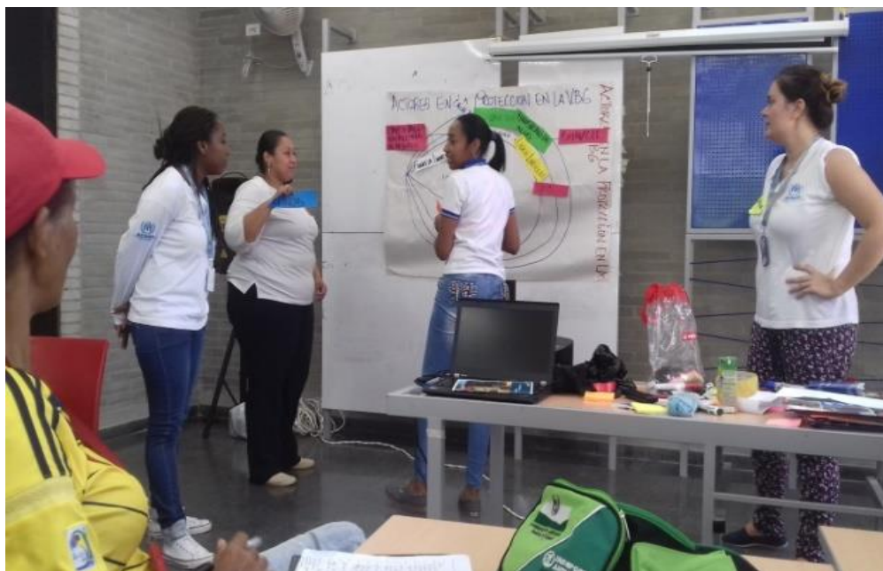
Figura 2. Capacitación equidad de género 2016.