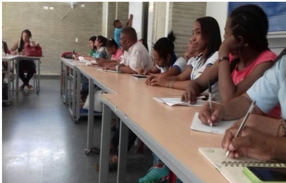
Figura 1. Capacitación Mesa de Infancia y Adolescencia 2016.