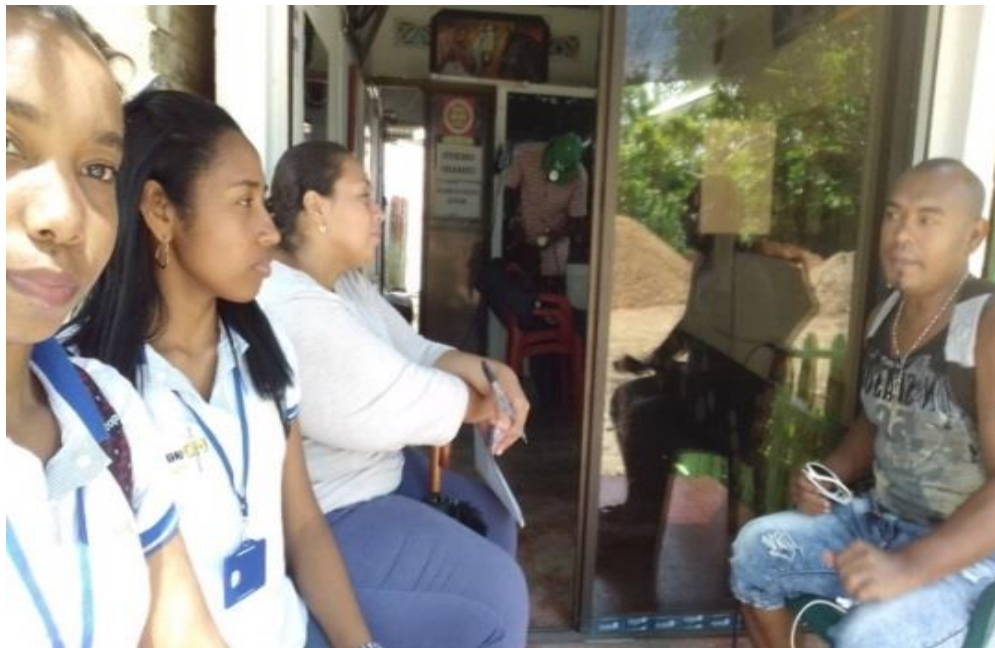
Figura 4. Encuesta a familia del municipio de Necoclí.