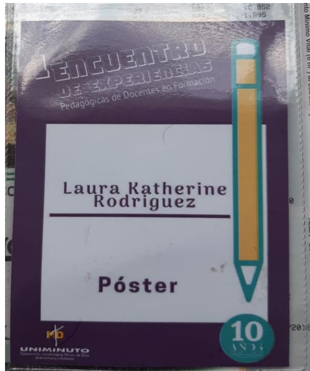
Anexo 1. Escarapela Primer encuentro de Experiencias pedagógicas.