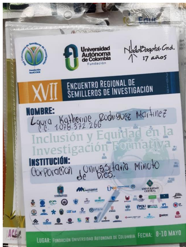
Anexo 5. Escarapela Encuentro Regional Redcolsi 2019.

Análisis y reflexión de la experiencia como Semillerista del programa Licenciatura en Educación Básica con Énfasis en Ciencias Naturales y Educación Ambiental de la Corporación Universitaria Minuto de Dios.