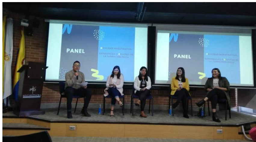
Imagen 8. Estudiantes participando en el "panel de movilidad investigativa: Experiencias y desafíos en la formación inicial"

Este seminario conto con la participación de 3 estudiantes investigadoras provenientes de la ciudad de México y la estudiante de la Corporación Universitaria Minuto de Dios de la ciudad de Bogotá, allí se habló sobre las experiencias nacionales e internacionales como Semilleristas de cada universidad, así como las dificultades, ventajas y principales aprendizajes adquiridos. La audiencia, estudiantes del programa Licenciatura en Educación Básica con Énfasis en Ciencias Naturales y Educación Ambiental, se mostraron atentos e interesados en conocer la dinámica de pertenecer a un semillero de investigación, no solo por el hecho de viajar, sino por la formación integral que se tiene y todas las ventajas que ello trae, como lo es, conocer distintas personas con amplios conocimientos que en un futuro podrían contribuir a mejores oportunidades o el hecho de que ser Semillerista se convierte en una opción de grado muy interesante.