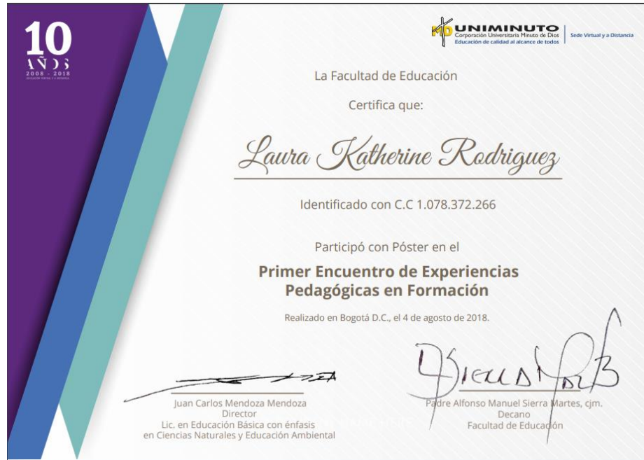
Anexo 11. Certificación primer encuentro de experiencias pedagógicas en formación.