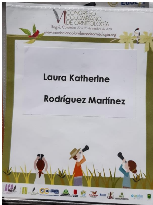
Anexo 8. Escarpela VI congreso Colombiano de Ornitología.

Análisis y reflexión de la experiencia como Semillerista del programa Licenciatura en Educación Básica con Énfasis en Ciencias Naturales y Educación Ambiental de la Corporación Universitaria Minuto de Dios.