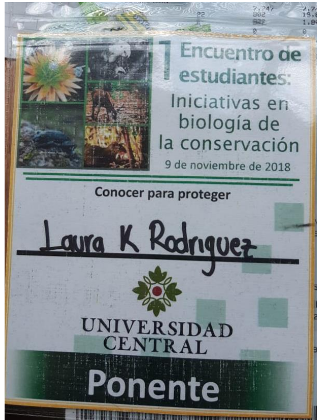
Anexo 4. Escarpela Encuentro de Biología.

Análisis y reflexión de la experiencia como Semillerista del programa Licenciatura en Educación Básica con Énfasis en Ciencias Naturales y Educación Ambiental de la Corporación Universitaria Minuto de Dios.