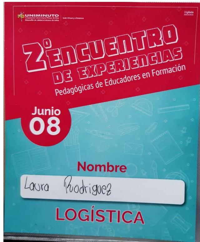
Anexo 6. Escarpela segundo encuentro de experiencias pedagógicas.

Análisis y reflexión de la experiencia como Semillerista del programa Licenciatura en Educación Básica con Énfasis en Ciencias Naturales y Educación Ambiental de la Corporación Universitaria Minuto de Dios.