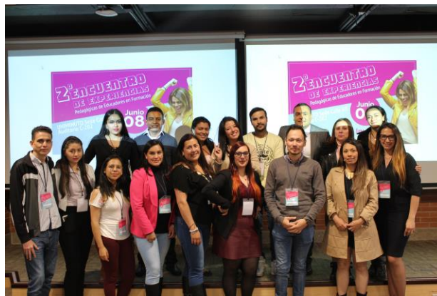
Imagen 7. Participantes del "2° encuentro de experiencias pedagógicas de educadores en formación"

Este encuentro es organizado por el programa de Licenciatura en Educación Básica con Énfasis en Ciencias Naturales y Educación Ambiental, el cual busca divulgar los proyectos autónomos de los estudiantes según su enfoque, por ello se tenían 3 ejes centrales, innovación en el aula, inclusión y diversidad y educación rural, esto facilitaba la recepción y clasificación de los proyectos a participar. Para este encuentro se tuvo la participación como encargada de la logística, función que contribuía a la organización y buen desarrollo del mismo.