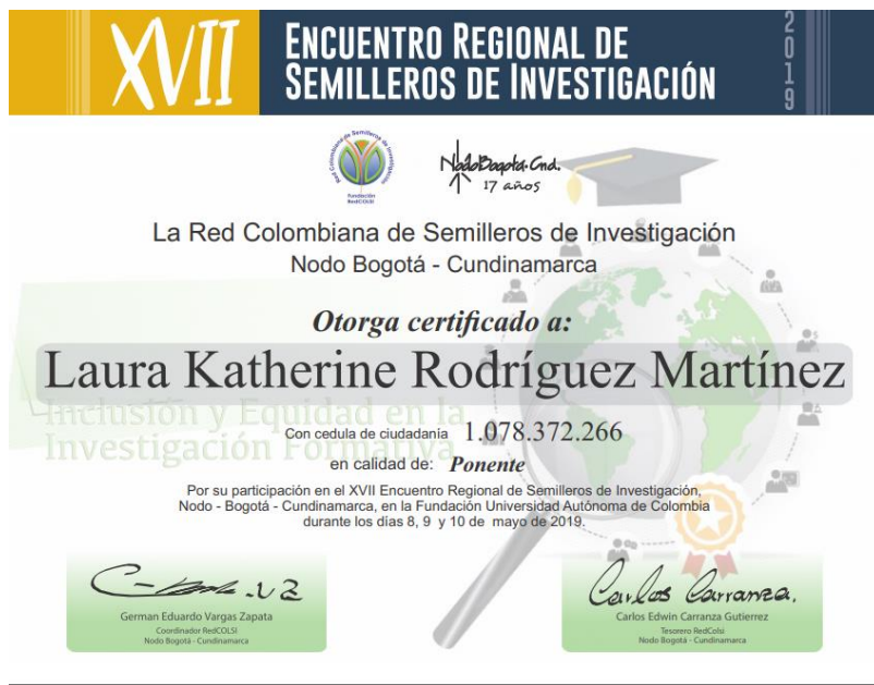
Anexo 9. Certificación XVII Encuentro Regional de Semilleros de Investigación.