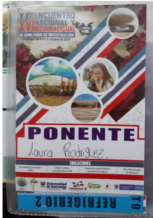
Anexo 7. Escarpela Encuentro Nacional Redcolsi 2019.

Análisis y reflexión de la experiencia como Semillerista del programa Licenciatura en Educación Básica con Énfasis en Ciencias Naturales y Educación Ambiental de la Corporación Universitaria Minuto de Dios.