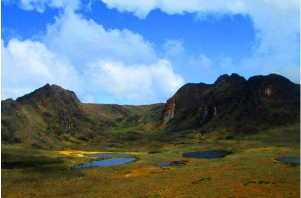
Figura 17: Santuario de Bocagrande