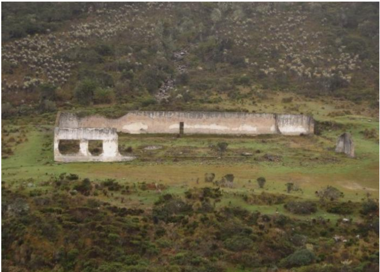
Figura 12: Cárcel de la dictadura