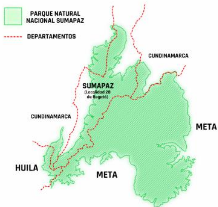
Figura 10: Delimitación del Sumapaz

http://subaalternativa.com/la-procuraduria-vigila-proceso-de-escogencia-de-alcaldes-locales-en-bogota/mapa-localidades/