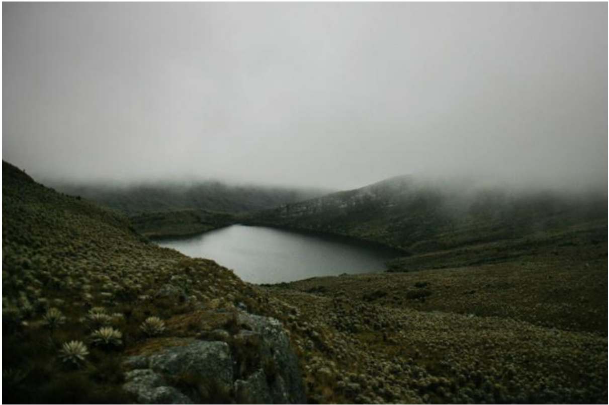
Figura 13: Laguna Negra