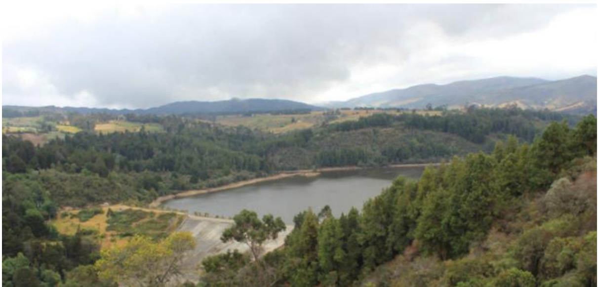
Figura 14: Mirador Buenos Aires o Loma chata