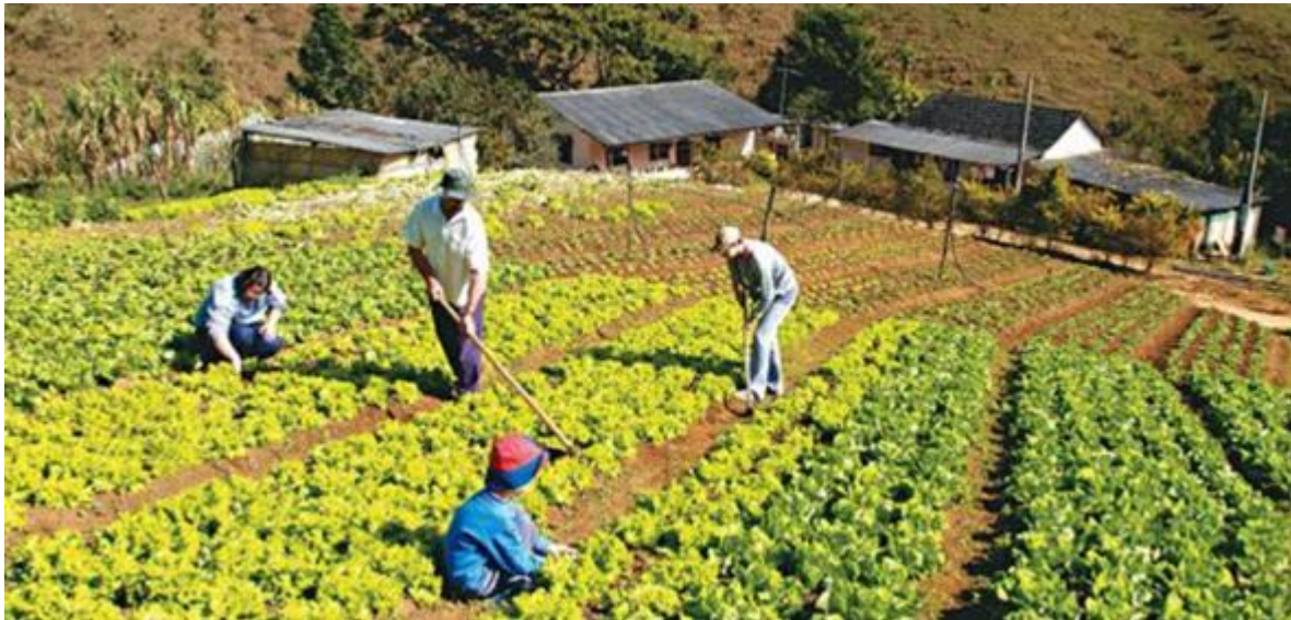
Figura 3. Entorno económico