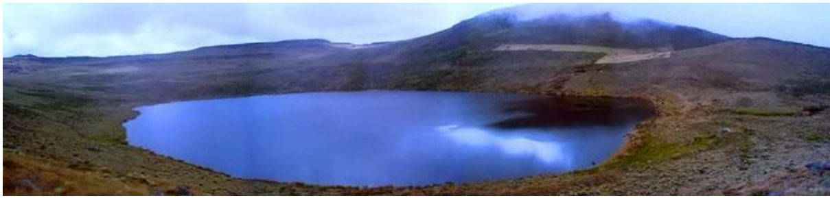
Figura 15: Laguna los colorados