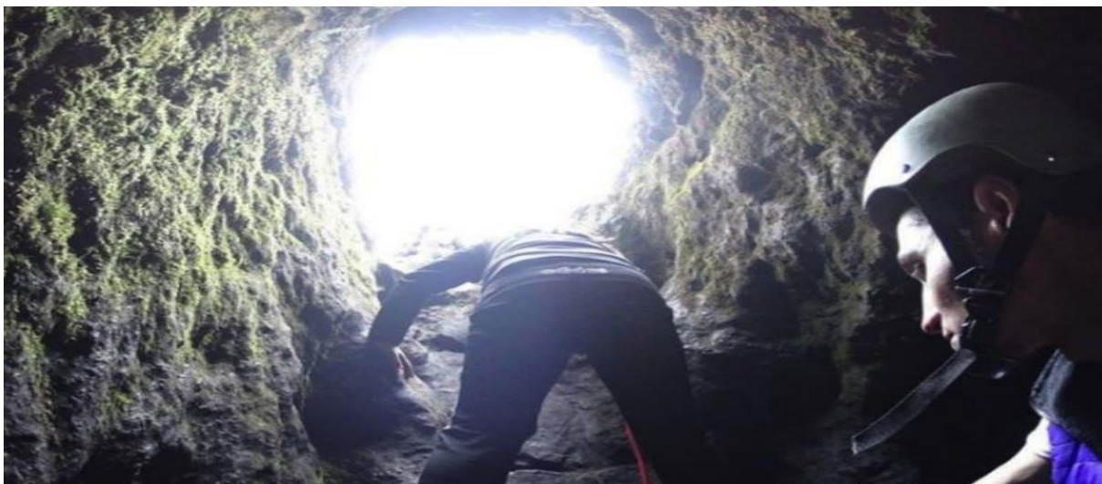
Figura 20: Cueva de murciélagos del Verjón