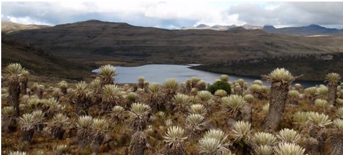
Figura 2. Parque Nacional Natural del Sumapaz.