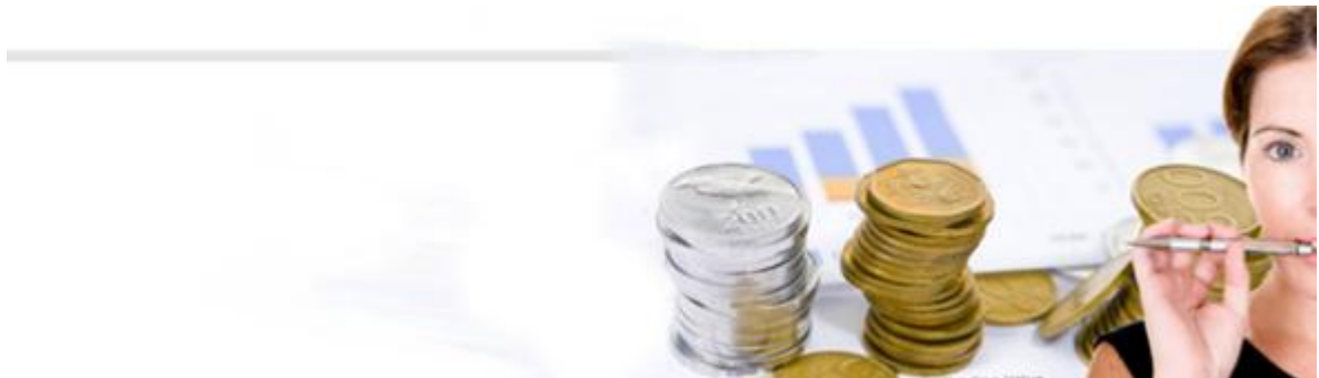
Figura 4. Caracterización económica y empresarial