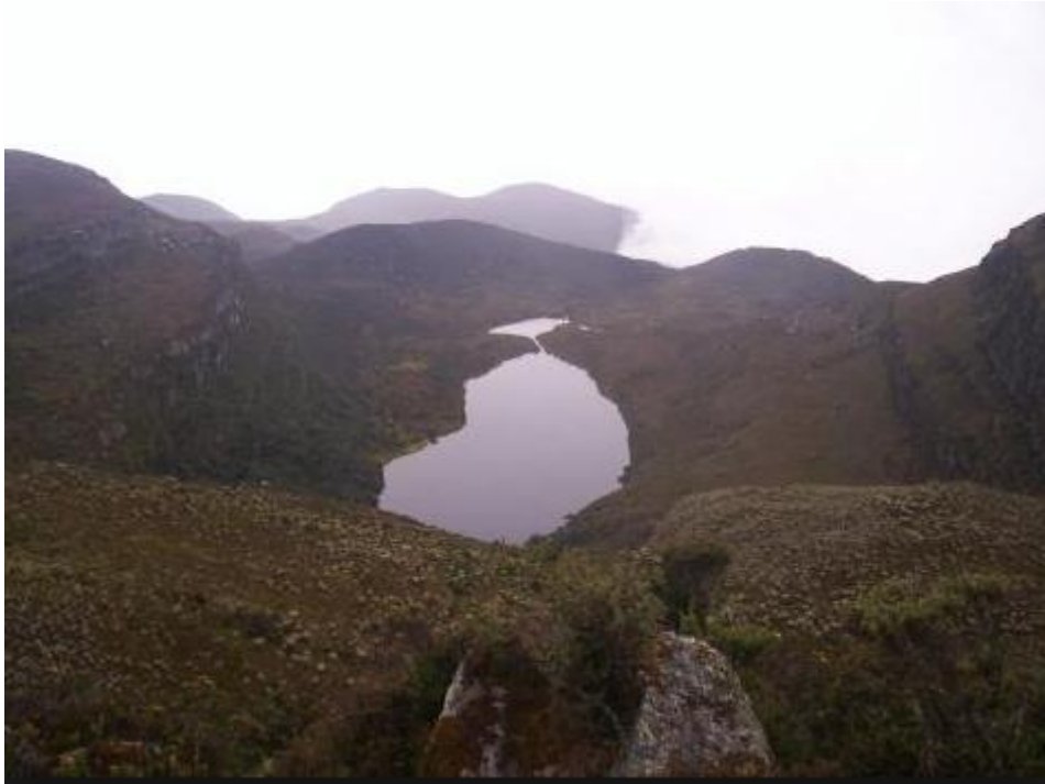
Figura 19: Laguna Cajitas