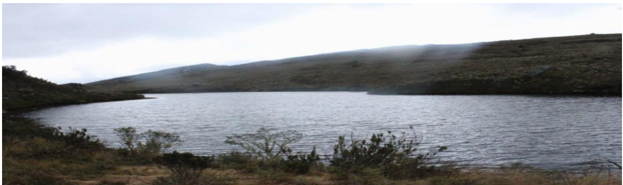
Figura 18: Laguna Larga