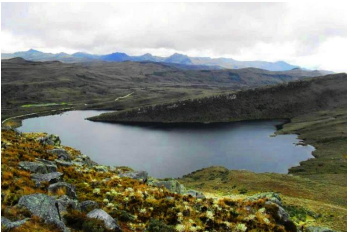
Figura 16: Los tunjos

https://www.google.com.co/search?q=Laguna+los+Colorados+sumapaz&rlz=1C1CHZL_esCO739CO739&source=lnms&tbn=isch&sa=X&ved=0ahUKEwjS_NWQy-zbAhXhzVkKHTuDXcQ_AUICigB#imgrc=Hevgpi9ZGmHJdM: