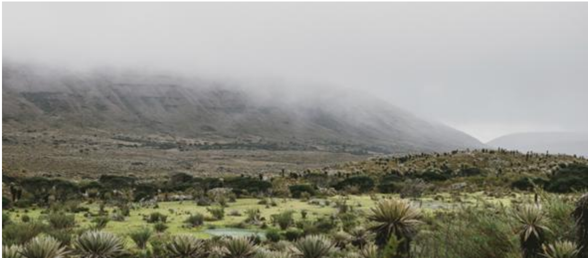
Figura 1. Sumapaz.