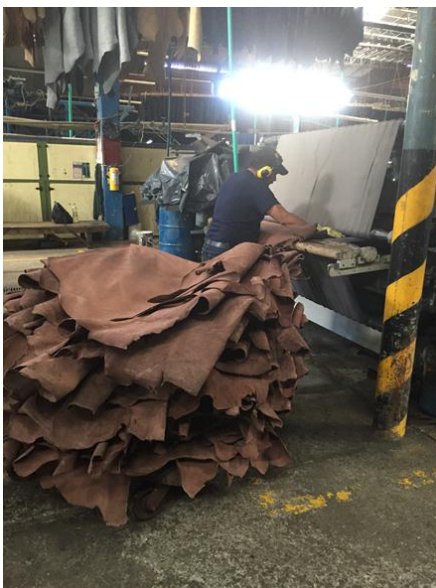
Figura 10. Secado, ablandado y estirado