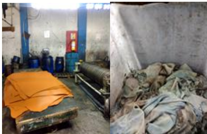
Figura 15. Peligros