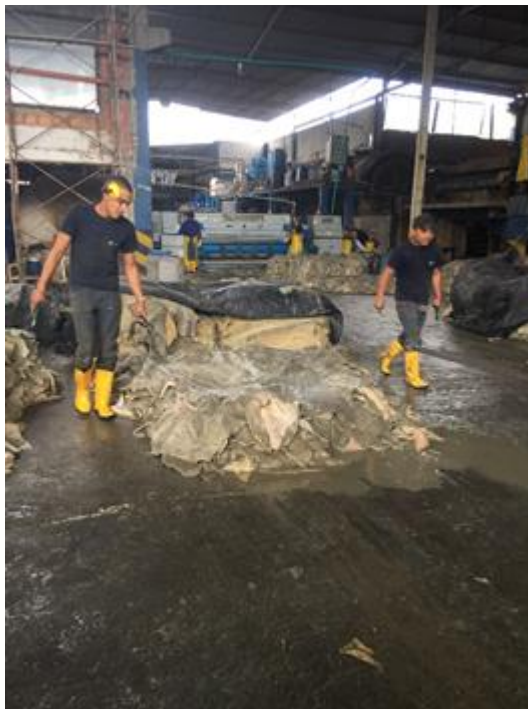
Figura 4. Descarnado