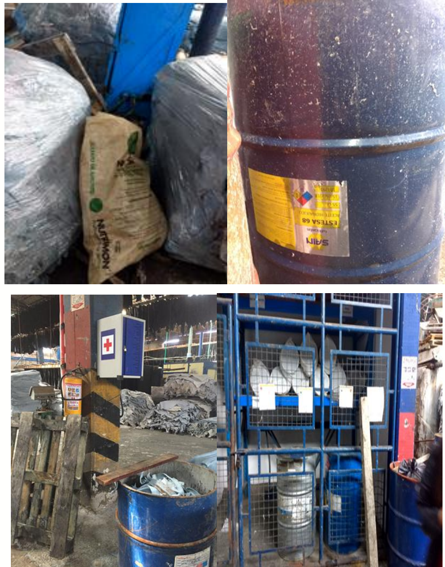
Figura 14. Identificación de sustancias químicas y fichas de seguridad MSDS en planta.

De otra parte, según lo explicado por la ingeniera química encargada de manejar la parte ambiental de la curtiembre; para el tratamiento y vertimiento de agua después de usarse en el proceso de transformación de piel a cuero, se realizan tres pasos: en un tanque se almacena el agua con sulfuro, en otro el agua del cromo y por último el agua del curtido y enjuagues que no contienen químicos en gran porcentaje para realizar sedimentación, oxidación catalítica y así obtener un PH de 8.5 y 9 (para sulfuro y cromo) y asegurar la norma de en un miligramo por litro máximo de estas sustancias.