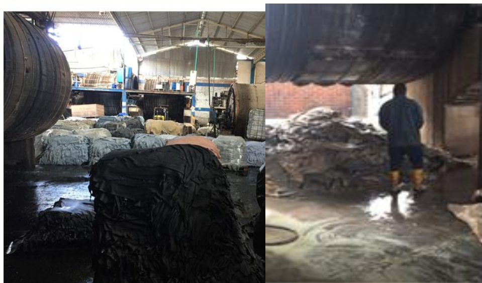
Figura 3. Pelambre y encalado.

El pelambre corresponde a la operación de remoción del pelo con formulación química.