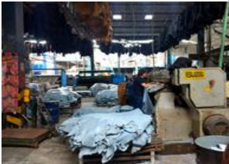
Figura 9. Rebajado del espesor del cuero.