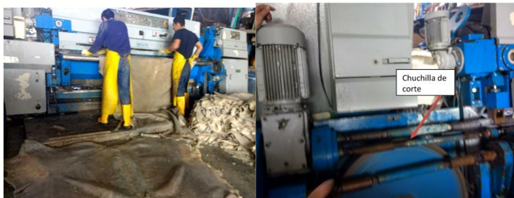
Figura 5. Dividido (flor y carnaza)

Utilizando la máquina para dividir cueros se separa dos capas de la piel llamadas la flor y la carnaza. Donde la flor es destinada para obtener el producto deseado (cuero para calzado, marroquinería); la carnaza según el tamaño y grosor se usa para curtirla y obtener cuero de baja calidad para la fabricación de guantes industriales, botas industriales y en otros casos juguetes caninos.