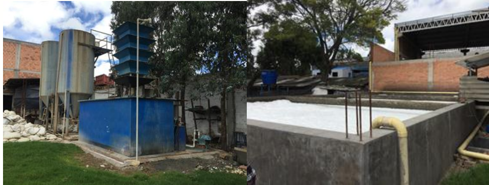
Figura 15. Tratamiento de vertimientos de aguas residuales.

pasen a los sedimentadores en simultáneo junto con las bacterias liofilizadas para culminar su procesamiento y ser regresada a la planta para su uso. La Figura 15 permite evidenciar el proceso de tratamiento de aguas residuales.