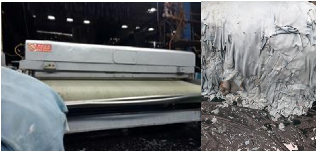
Figura 8. Ecurrido

Retirados los cueros del fulón y utilizando máquinas escurridoras se le retira entre el 80 y el 90% de humedad y a la vez con ésta misma máquina, se obtiene incremento del área.