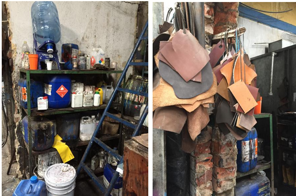
Figura 12. Proceso final de transformación de piel a cuero

En esta etapa final se pinta el cuero en máquinas de pistolas o de rodillos y luego de grabado dándole el dibujo más apropiado para la confección del artículo que se quiera elaborar con este cuero. Posteriormente, se mide el área del cuero para su venta con máquinas electrónicas o manualmente con marcos.