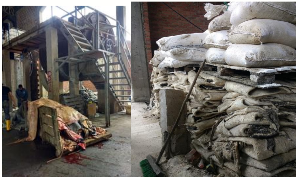
Figura 1. Pieles crudas (frescas y saladas)

Las pieles de animales sacrificados pueden recibirse frescas o saladas para evitar su putrefacción; estas pieles son descargadas desde el interior de un camión al suelo de la planta para pasar al proceso de desmote donde se retiran manualmente y con ayuda de un cuchillo los restos de carne y grasa.