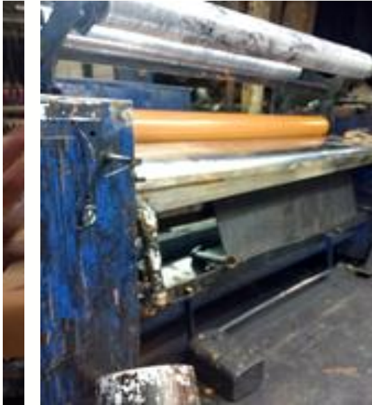
Figura 11. Recurtido, teñido, engrasado