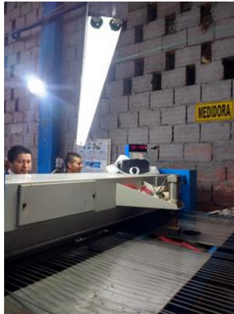
Figura 13: medidora de área