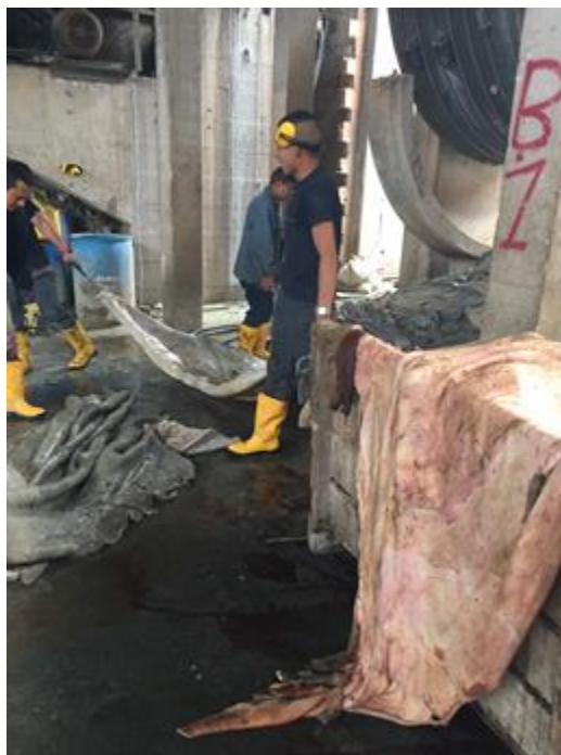
Figura 2. Remojo

La operación de limpieza requiere el acelerado paso a la siguiente etapa por la facilidad de proliferación de bacterias y posterior daño de la piel.