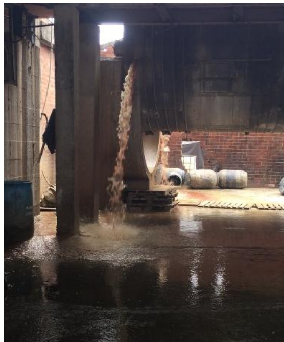
Figura 6. Proceso de desencalado y purga

La purga es realizada adicionando enzimas para aflojar las fibras del colágeno, deshinchar la piel, aflojar el pelo y degradar la grasa. Los productos químicos utilizados en esta etapa son el ácido sulfúrico ( H_2SO_4 ), ácido fórmico ( CH_2O_2 ), ácido bórico ( H_3BO_3 ).