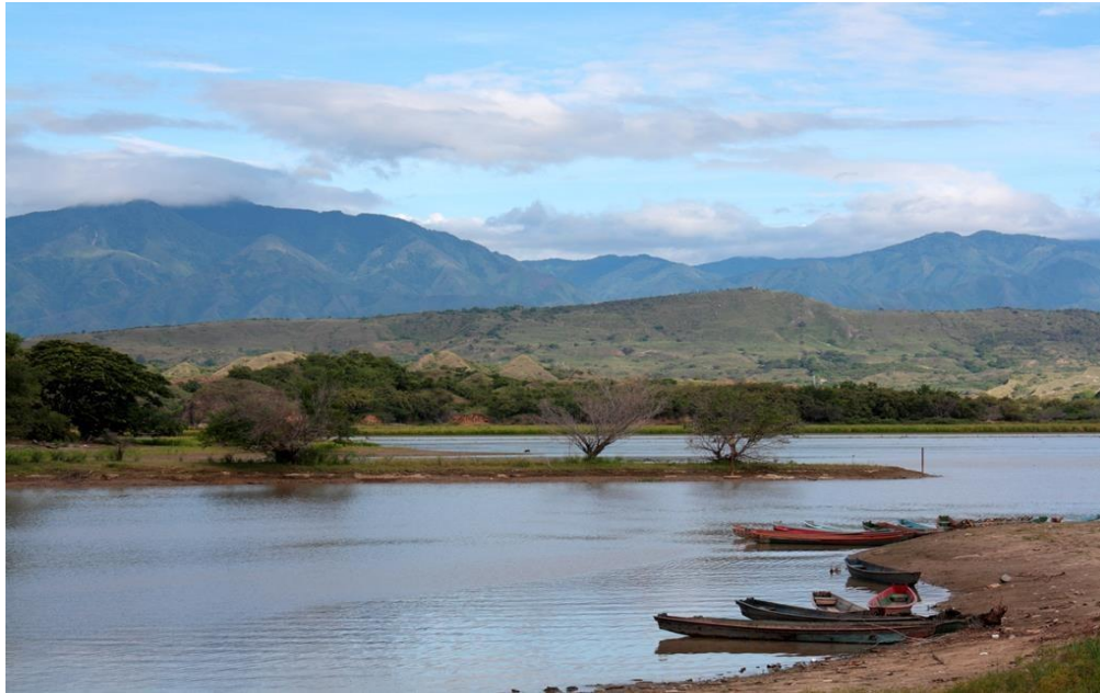
Puerto Mómico. Fuente propia

ASOQUIMBO, asociación de afectados por el proyecto hidroeléctrico El Quimbo, organización social sin ánimo de lucro, constituida el 26 de julio del 2009 en Gigante, Huila.