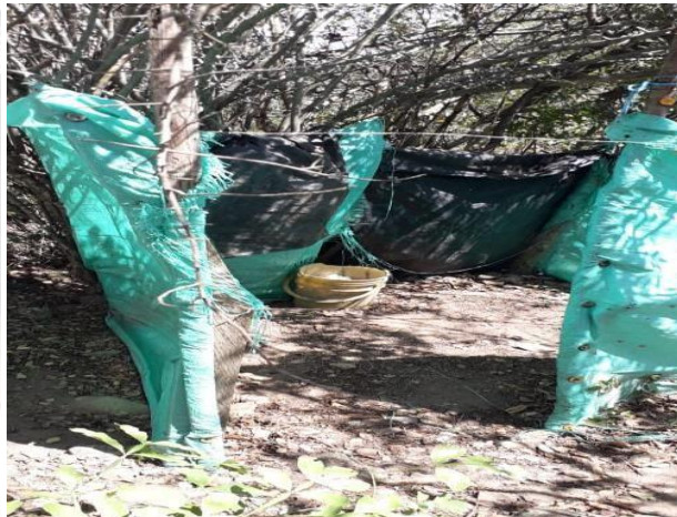
Baños, no cuentan con acueducto