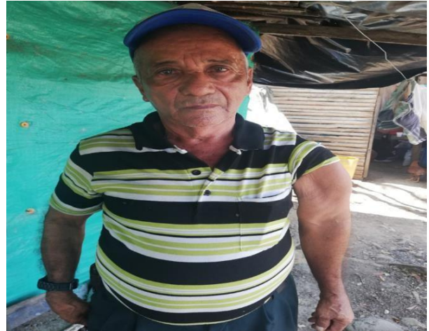
Pescador que casi pierde su brazo por ir a manifestar