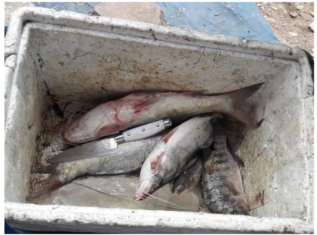
Pesca de una semana

RESISTENCIAS CIVILES Y TERRITORIALIDAD EN EL QUIMBO 76