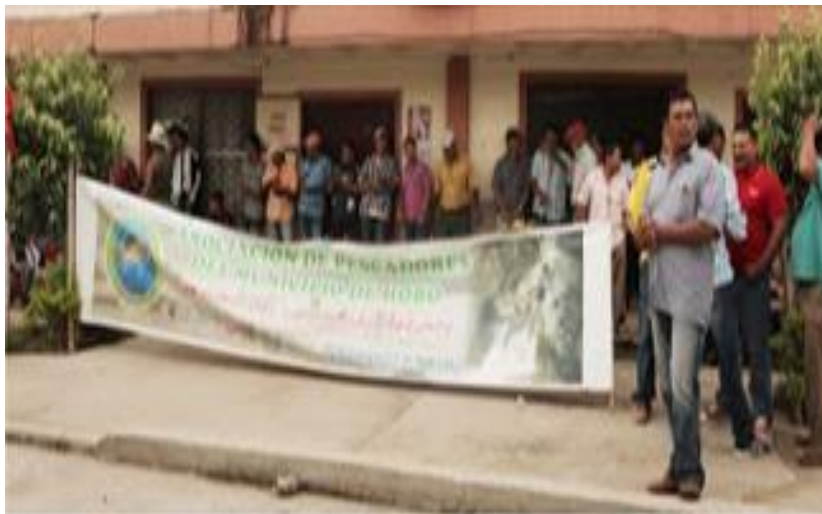
Pescadores artesanales del Hobo radicando tutela para la protección de sus derechos al trabajo, la vida digna y la seguridad alimentaria.