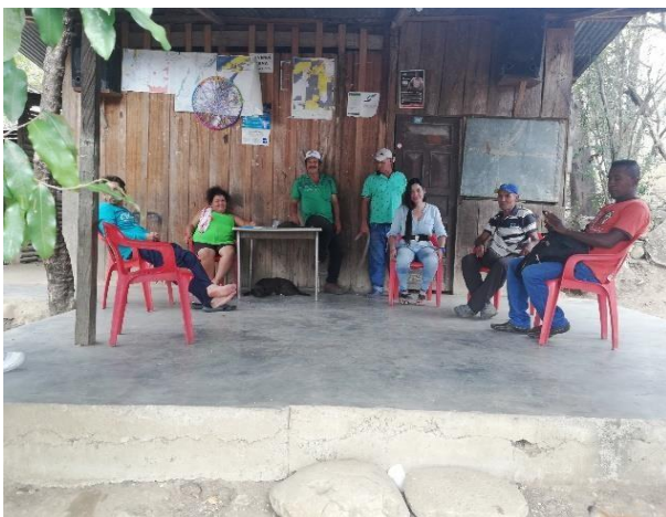
Sitio de encuentro, Puerto Momicó

RESISTENCIAS CIVILES Y TERRITORIALIDAD EN EL QUIMBO 76