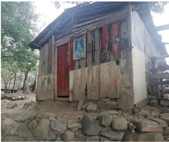
Casa de vocero de la asociación