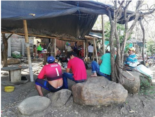
Encuentro mensual de la asociación