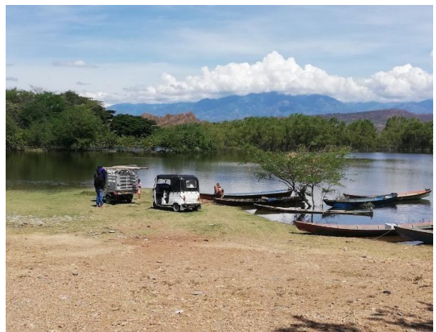
Los pocos turistas de un domingo