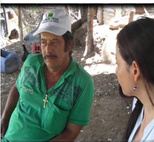
Aplicación de entrevistas