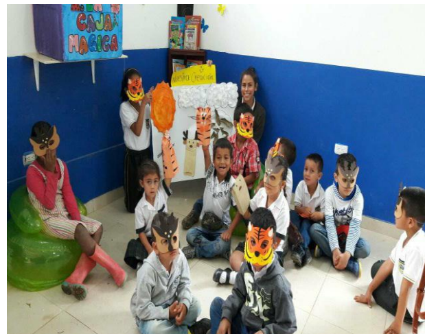
Ambientación del rincón literario