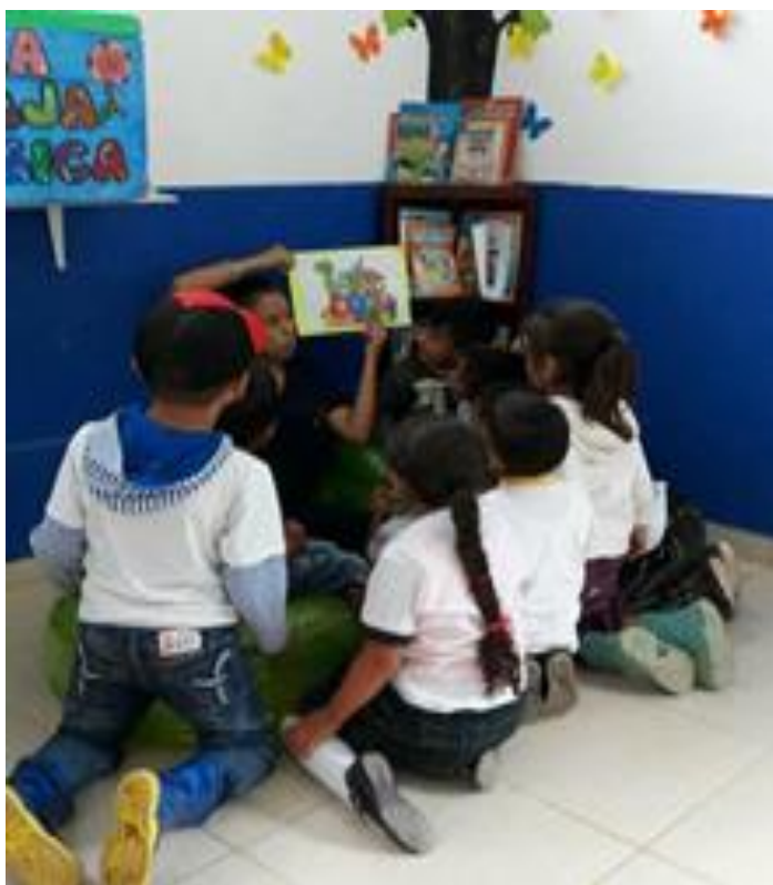
Actividad del tren de los valores