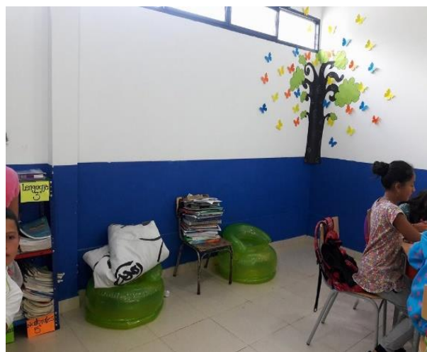
Proceso final del rincón Literario