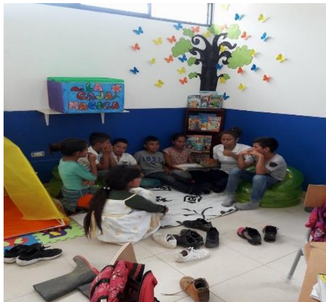
Observación de la práctica actual de la docente