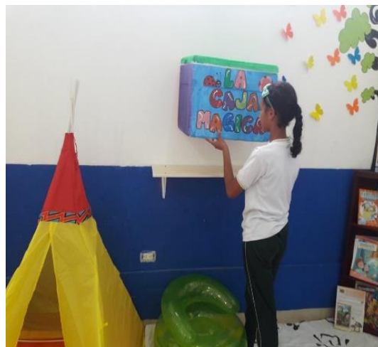
Creación del rincón literario