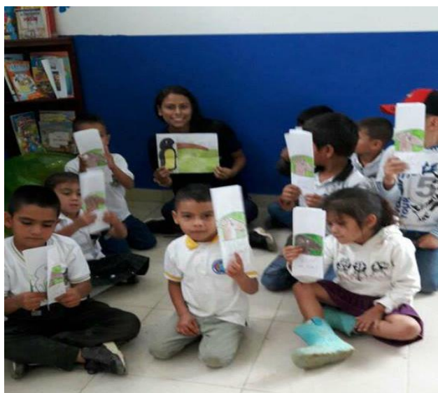
Actividad cuento infantil – mediante un friso