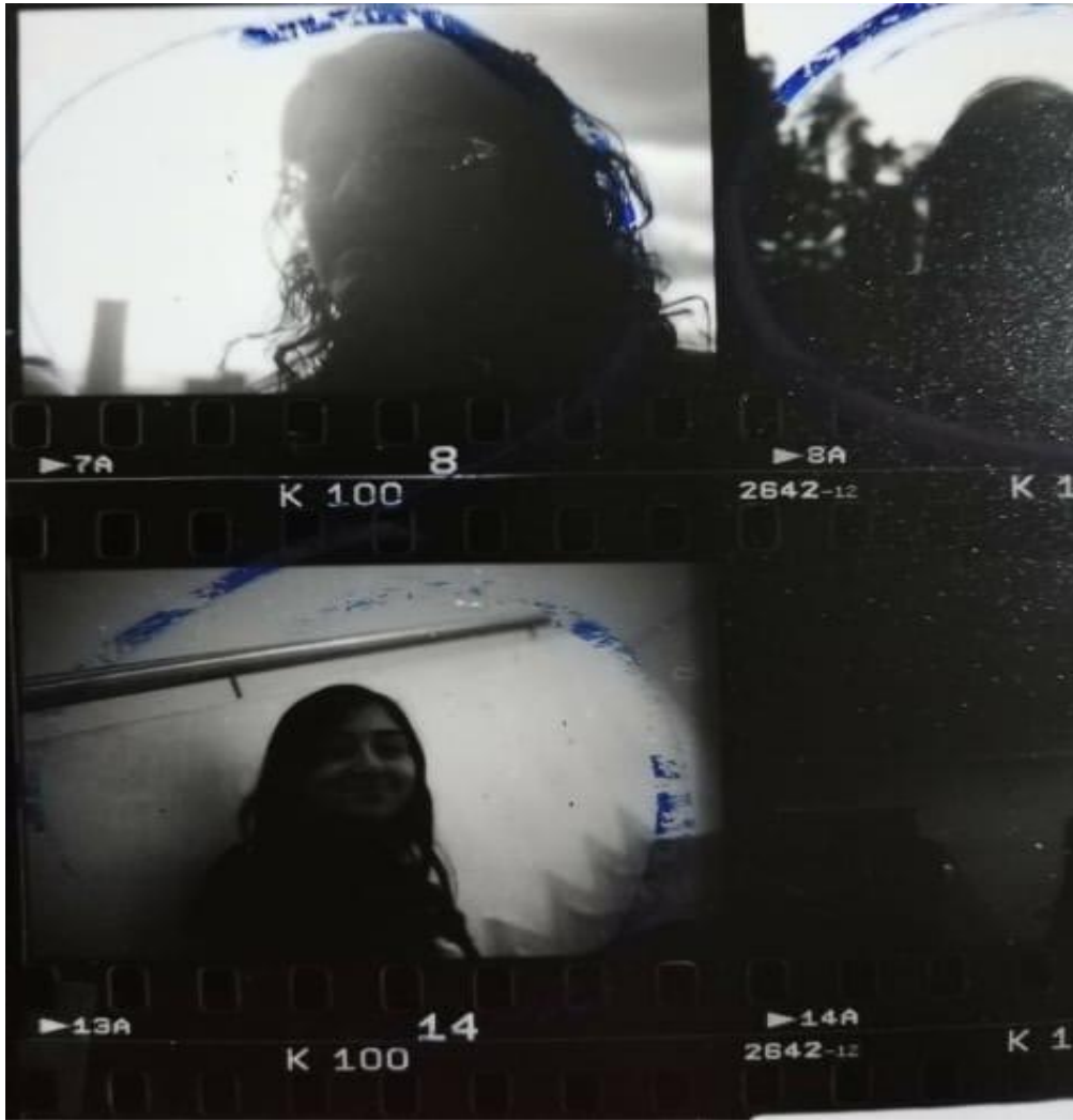
Ilustración 5 E1MPA2018. Retratos. Fotografía.