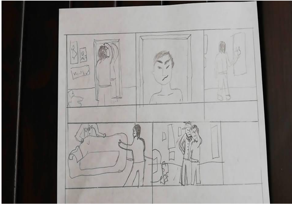
Ilustración 15E2MPA2018, Storyboard. Fotografía.