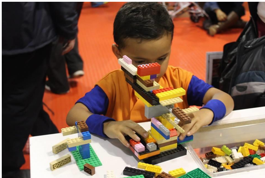
Ilustración 10E1HPA2018, Actividad SOFÁ. Fotografía