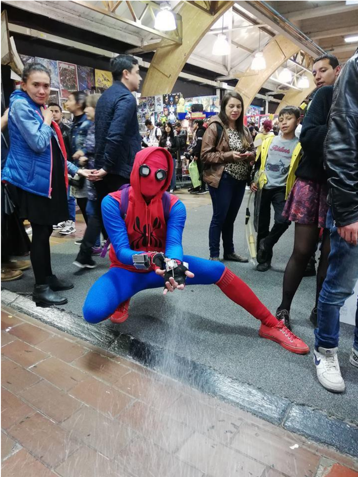
Ilustración 12E1MPA2018. Retratos. Fotografía.