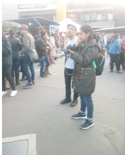
Ilustración 4 Escobar W, 2018. SOFÁ. Fotografía.