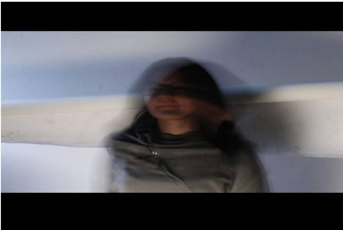
Ilustración 13E1MPA2018. Fotografía.