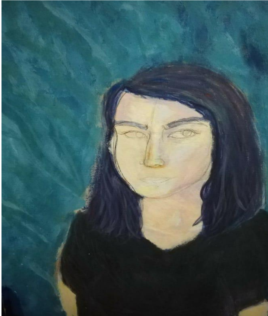
Ilustración 6E1MPA2018. Autorretrato Pintura.

Fotografías Experiencias artísticas SOFA