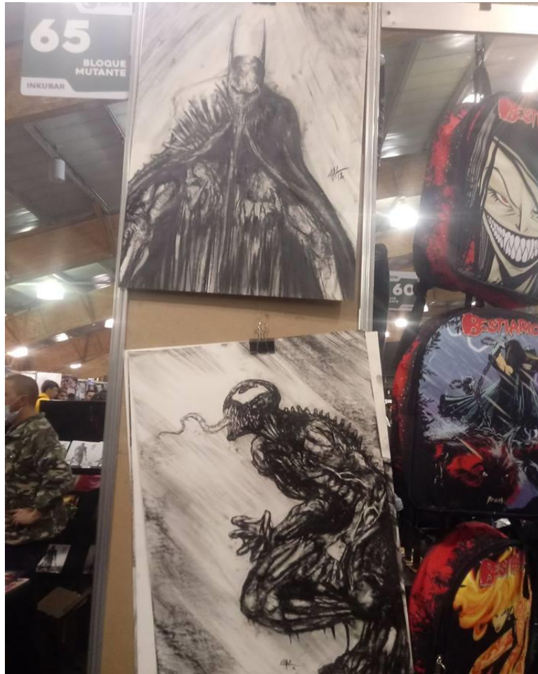
Ilustración 9E1HPA2018, Actividad SOFÁ. Fotografía