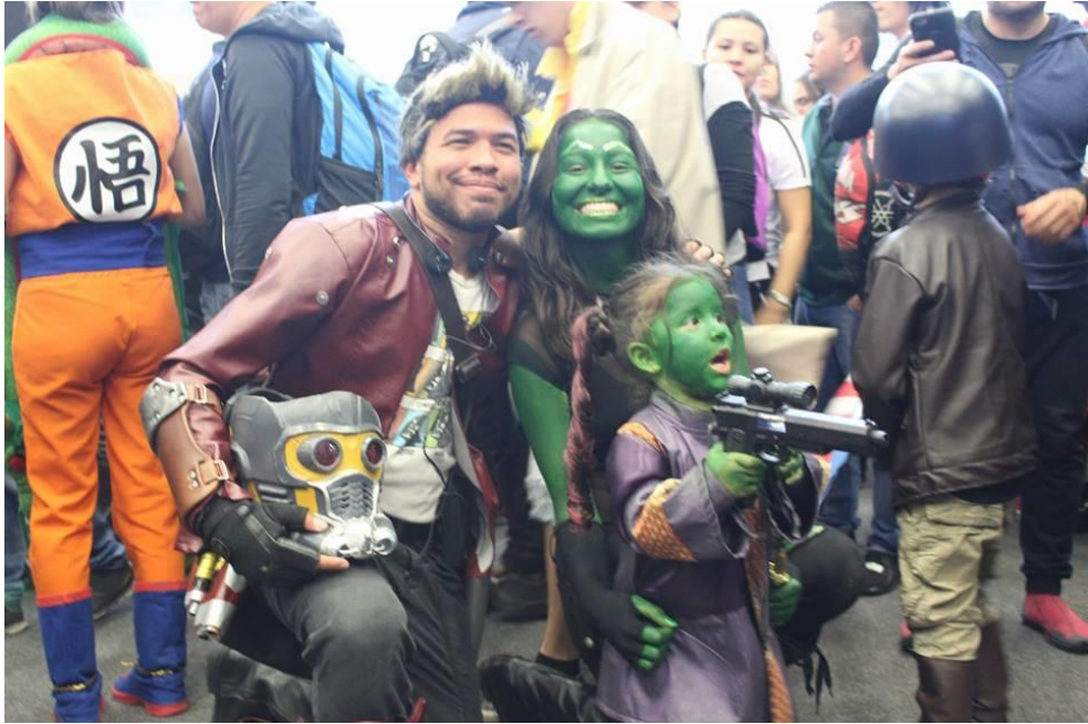
Ilustración 7E 1 HPA, 2018, Actividad SOFÁ. Fotografía