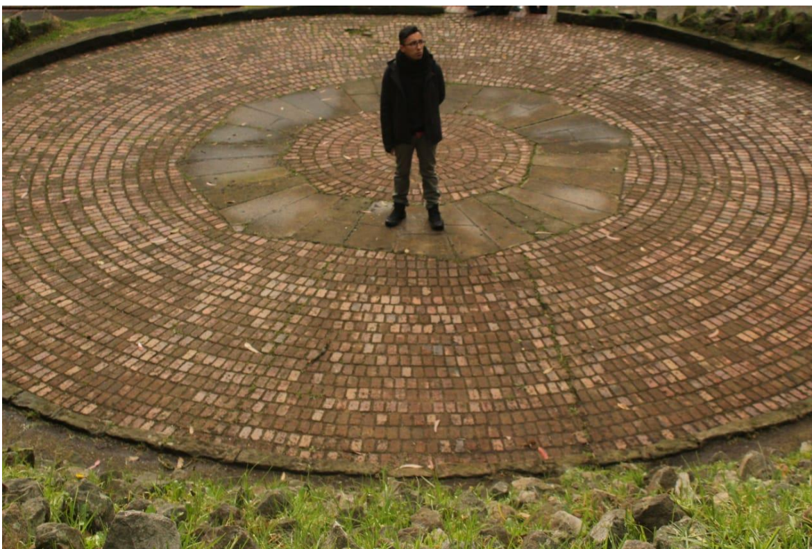
Ilustración 14E1HPA2018. Fotografía.