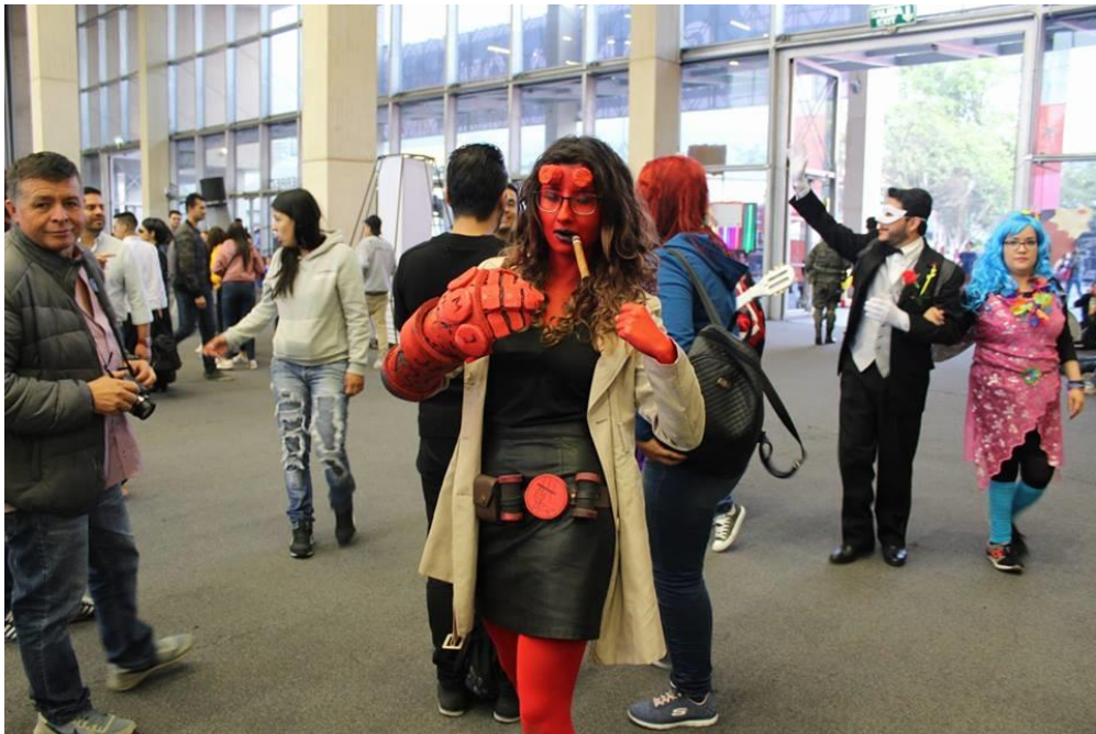
Ilustración 8E1HPA2018, Actividad SOFÁ. Fotografía