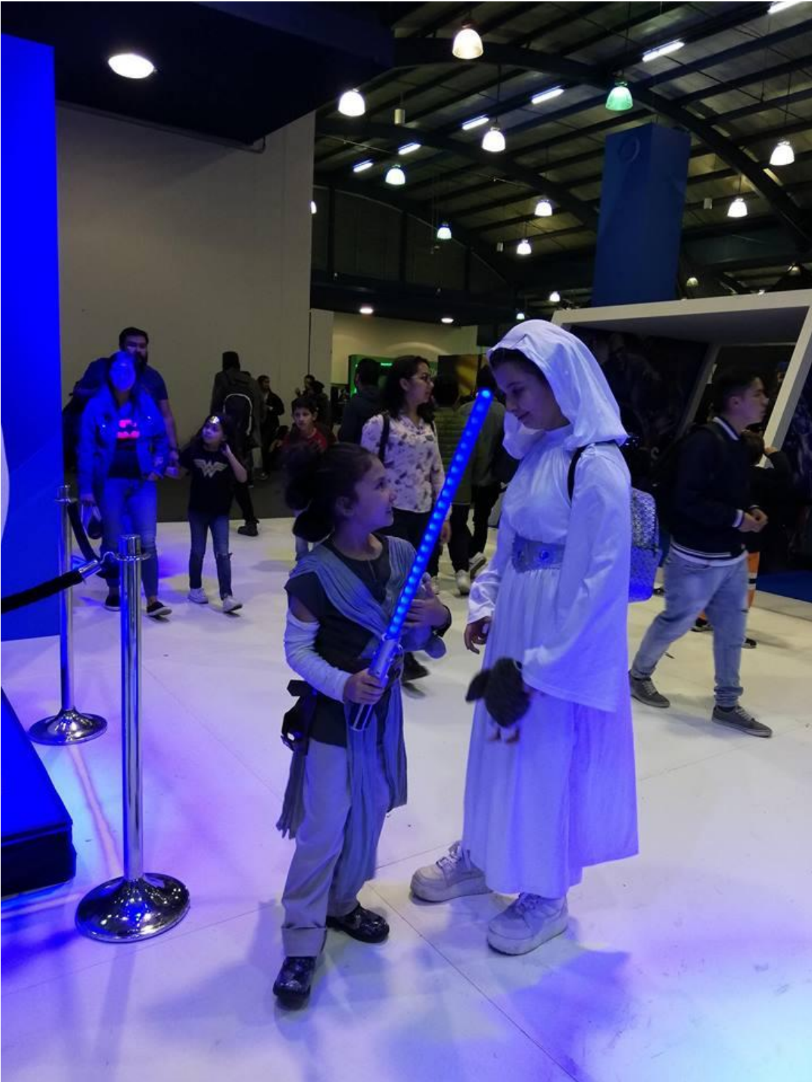
Ilustración 11E1MPA2018. Retratos. Fotografía.