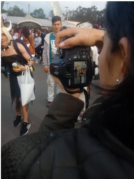
Ilustración 3 Escobar W, 2018. SOFÁ. Fotografía

Los entrevistados comparten las características similares a su trastorno del ánimo, durante la investigación se pudo evidenciar los diferentes comportamientos y cómo estos se veían afectados durante el rodaje de las entrevistas, el estado de ánimo variaba en cuanto tienen la función de apoyar en el rodaje o la producción de sus muestras artísticas. la disposición parecía alejar o ignorar todos estos síntomas compartidos que se ven en la matriz de análisis, así como el desarrollo de las actividades y el después de concluir las mismas.