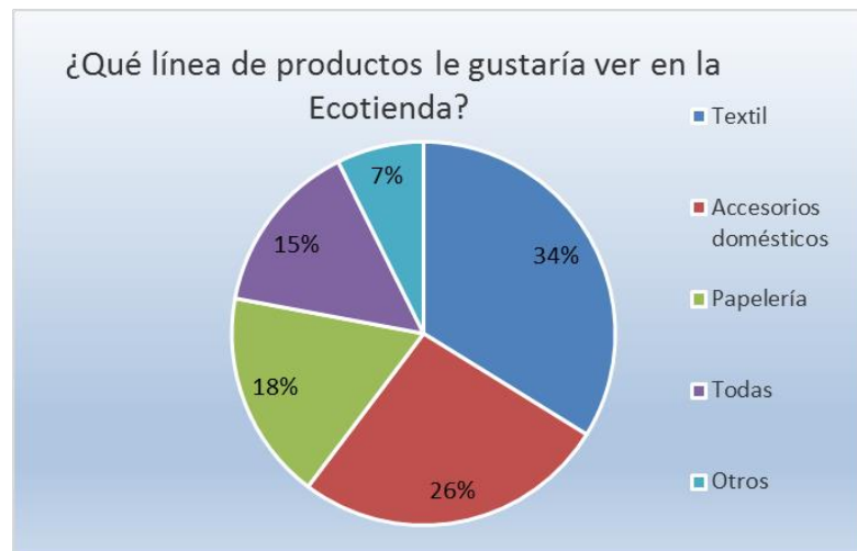
Gráfica No. 1

A continuación se muestra la preferencia de las líneas de productos por parte de los visitantes: