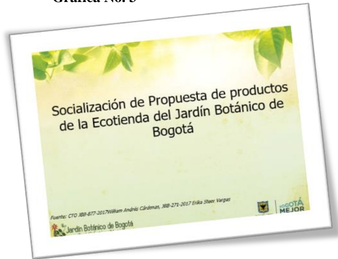
Gráfica No. 3