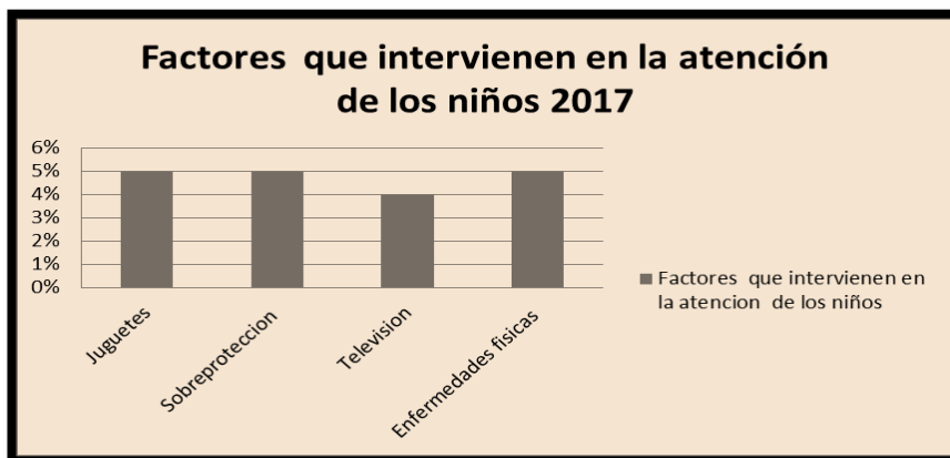
Figura 3. Factor que influye en la atención de los estudiantes