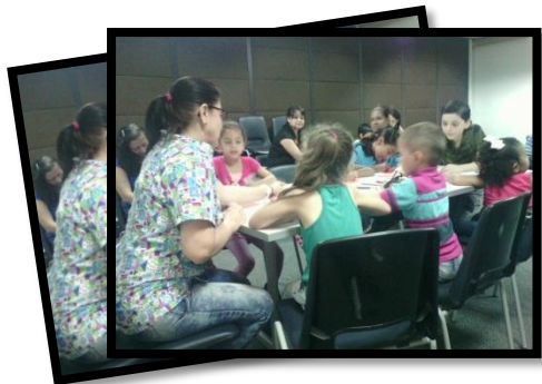
Ilustración 6

Una de las estrategias que los niños sugirieron en varias ocasiones cuándo les preguntábamos