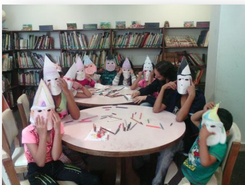
Ilustración 3

Por último los materiales de apoyo fuera del contexto de la biblioteca pero que tengan que ver con la lectura llaman mucho la atención de los niños (peluches, cajas, dulces, etc.), los hace sentir una curiosidad especial además de que esto genera una concentración más profunda y ellos lo disfrutaban al mismo nivel de las manualidades en las que pueden demostrar su creatividad y llevárselas a casa.