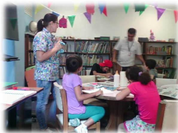
Ilustración 5