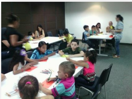
Ilustración 7