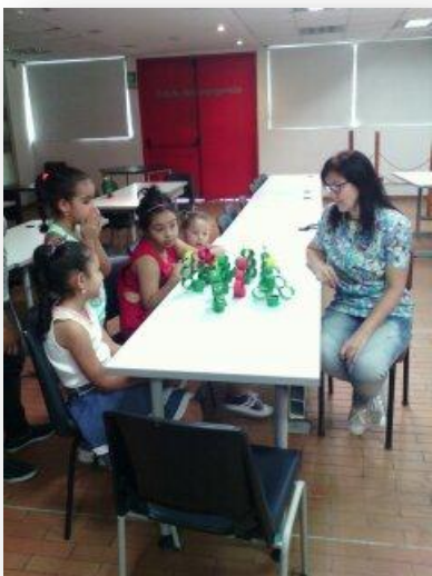
Ilustración 10

se reflejara el incremento de la comprensión lectora, por ejemplo en el juego alcance la estrella los niños resolvían cada vez con mayor rapidez las preguntas que se planteaban sobre la lectura.