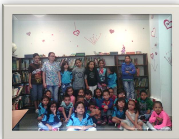
Ilustración 2

Las actividades antes mencionadas son técnicas en las que se apoyan los lecto-juegos, las cuales fueron diseñadas para grupos entre 15 a 25 personas, programadas para realizarse inmediatamente después de la lectura en voz alta y practicarse en el mismo espacio de lectura. Fueron seleccionadas específicamente para ayudar a la formación de lectores y en la medida que ellos se divierten asimilen mejor la narración lo cual genera interés por otras obras y motivación