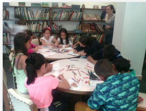
Ilustración 4