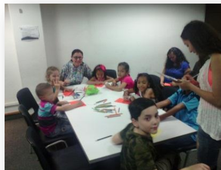
Ilustración 8

“La comprensión lectora es una de las habilidades básicas que deben desarrollar las personas para poder decodificar los mensajes escritos. A través de esta lectura adquirirás las herramientas necesarias para aplicar distintos tipos de lecturas de acuerdo con el material que estés revisando y a los objetivos planeados para su lectura. Además analizarás los distintos textos que existen, su intención comunicativa y la lectura de otros códigos” (Quijada, V. 20014). La comprensión lectora es un proceso de interacción entre el pensamiento y el lenguaje que permite elaborar un significado por medio de las ideas relevantes de un texto y relacionarlas con los conceptos que ya tienen un significado para el lector. El desarrollo de la comprensión resulta fundamental, pues esta actividad cognitiva posibilita un sinnúmero de aprendizajes que tienen que ver con el desarrollo de la competencia comunicativa, el fortalecimiento de los procesos cognitivos y el enriquecimiento del imaginario del niño.