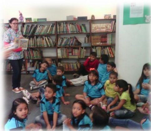
Ilustración 9

Durante mi práctica iniciaba la hora del cuento con los conocimientos previos que tenían los niños, con una serie de preguntas analizaba si contaban con los elementos necesarios para la comprensión del texto o por el contrario tenían conocimientos reducidos, nulos o equivocados, mi papel como docente en muchos casos fue promover la ampliación de conocimientos para aumentar el entendimiento del texto y en otras ocasiones fue generar interrogantes que iban a ser resueltos durante la lectura. Este tipo de conversatorios facilitaba la producción de respuestas