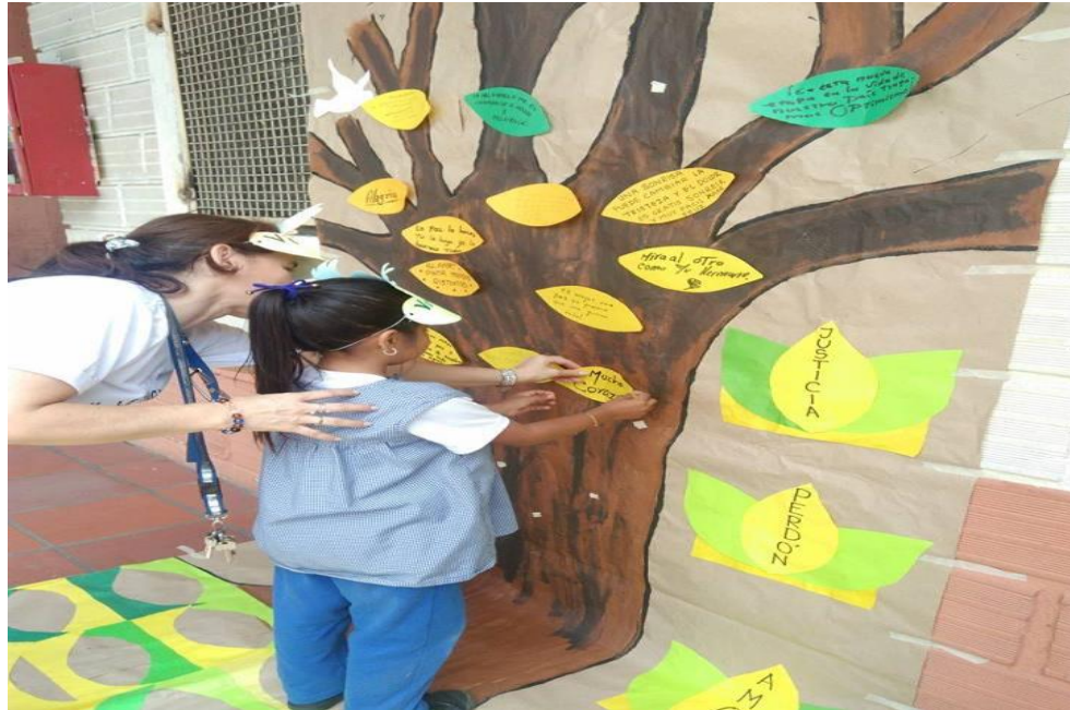
Figura 8. Árbol Por La Paz. Actividad de clausura. 24-11-2016.