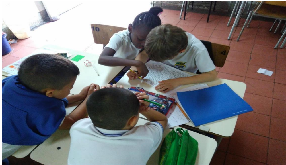
Figura 4. Trabajo Cooperativo, 10-11-2016