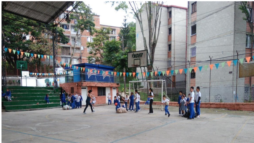
Figura 5. Juego Limpio. Actividad de competencia, 17-11-2016.