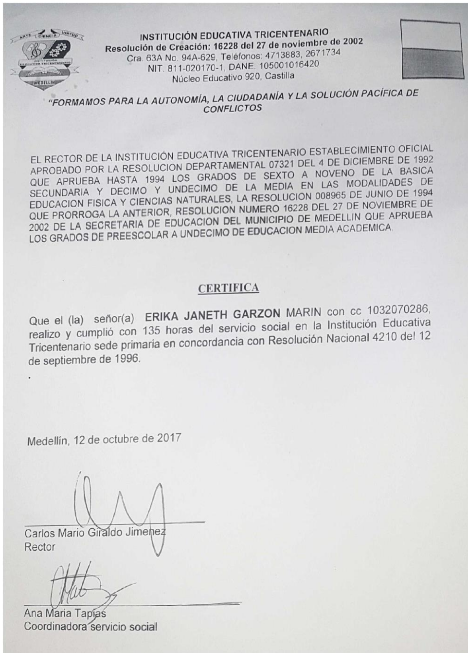
Figura 9: Certificado de la Institución Educativa Tricentenario