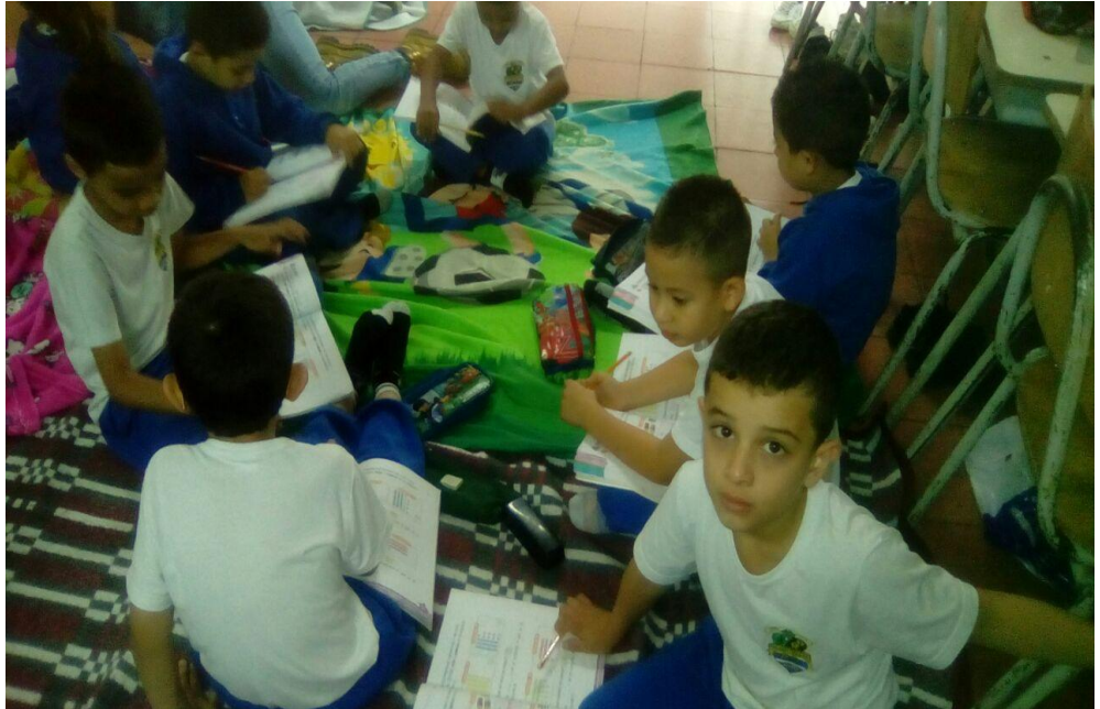
Figura 3. Actividad de Relajación, 27-10-2016.