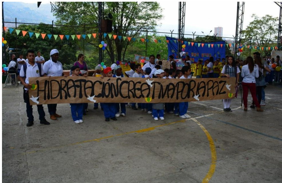
Figura 7. Primero 1, Actividad del Compartir. Actividad de Clausura, 24-11-2016.