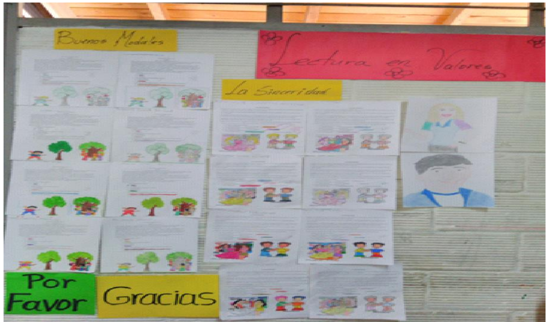
Figura 1. Lectura Para fortalecer Valores, 29-09-2016.