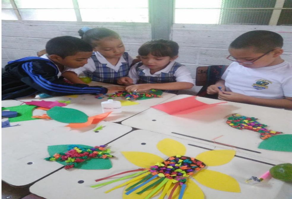
Figura 2. Manualidad y Arte en Equipo, 13-10-2016.