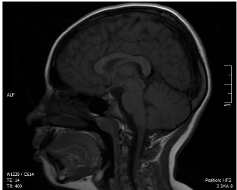
Figura 2. Imagen de Resonancia Magnética Cerebral (RMN), corte sagital T1 en Participante 2 femenina. Aquí se muestra cuerpo calloso con Rodete.

con el sexo masculino, pero sí a nivel neuroanatómico un desarrollo medio del cuerpo calloso (Böttcher et al., 2013) como se observa en esta participante (Figura 2) que con el tiempo dependiendo de su crecimiento y neurodesarrollo podría relacionarse con algunas fallas cognitivas (memoria) y conexiones de la sustancia blanca.