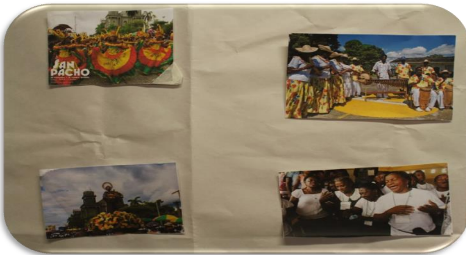
Imagen 12 es la técnica del foto lenguaje.

En la siguiente imagen se encuentra una parte de la técnica del Foto Lenguaje (ver imagen 12)