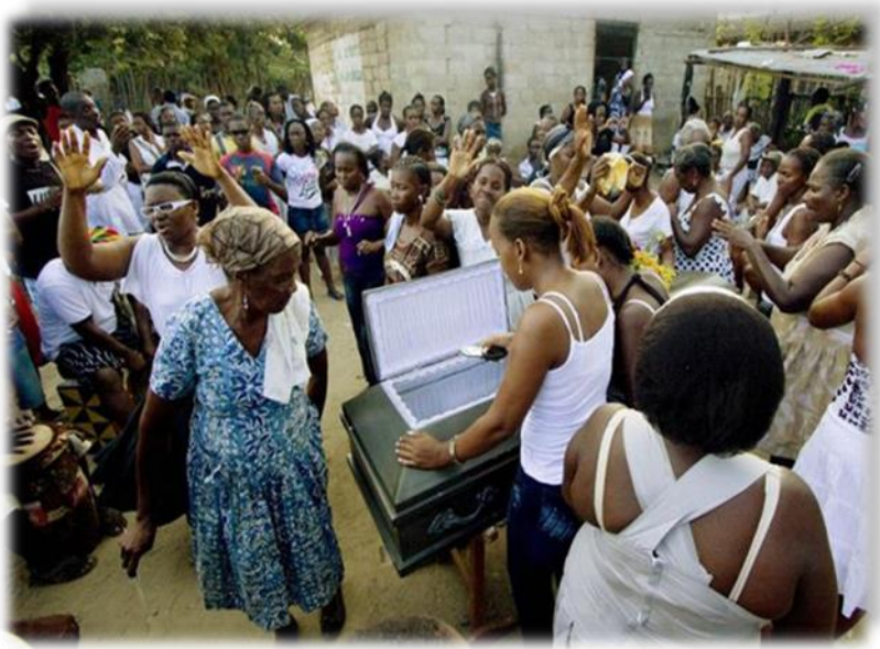
Imagen3 ritos fúnebres adoptado de Tradiciones, S.f Link: http://david-colombia.galeon.com/album2722440.html