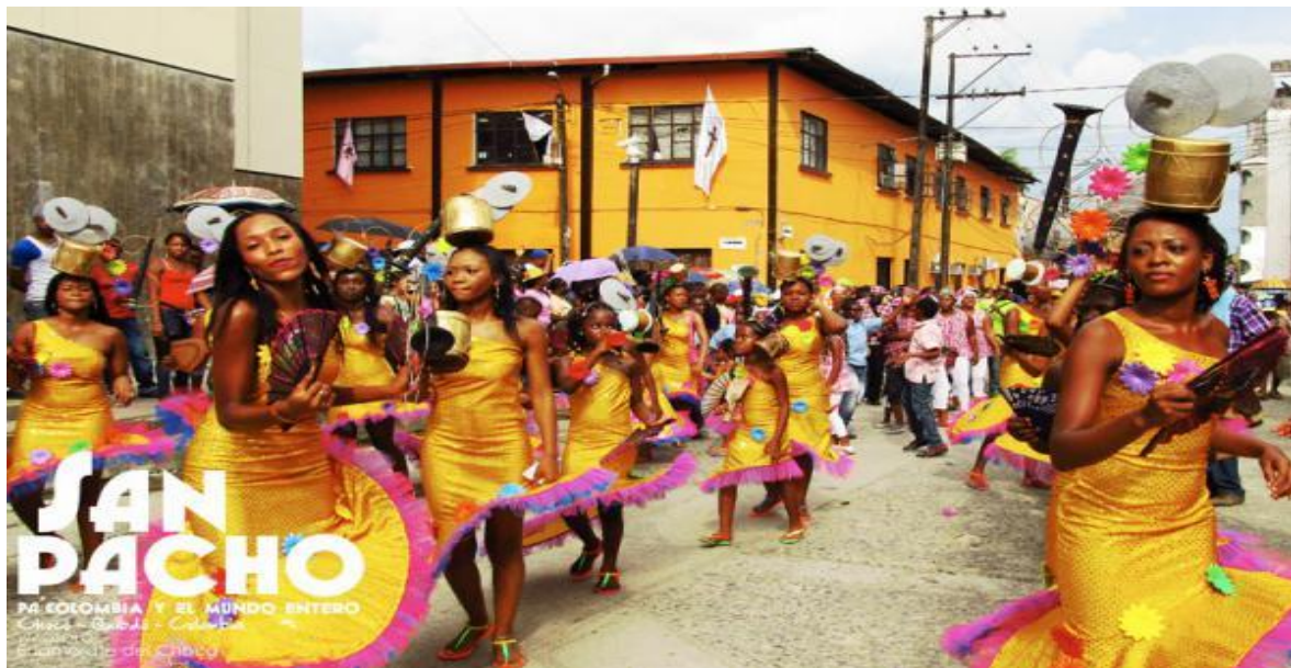
Imagen 4 Fiesta de San Pacho en el Municipio de Quibdó. Adaptado de Ritmo, Agua y Rumba , 31 de agosto de 2014.

Primero se comienza con la alborada, se continua con la valsada, desfile de disfraces y juegos pirotécnicos, luego los gozos Franciscanos, procesión y misa campal, conmemora el fallecimiento de San Francisco de Asís, las festividades tienen un tono ceremonial y religioso y culmina con el cierre de las fiestas y desfile de Arriada de Banderas. En la ilustración 4 se presenta una comparsa en el desfile mayor de San pacho en el Municipio de Quibdó.