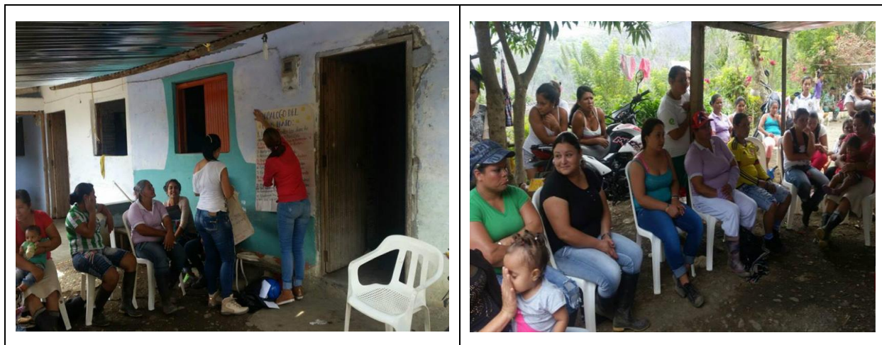
Construcción comunitaria del árbol de problemas

Fotos y evidencias de la construcción del árbol de problemas.