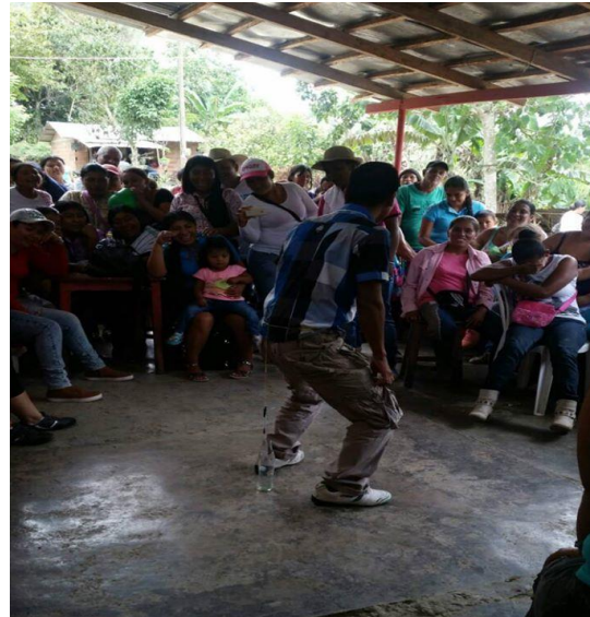
Actividades de esparcimiento con toda la comunidad del barrio La Cancha