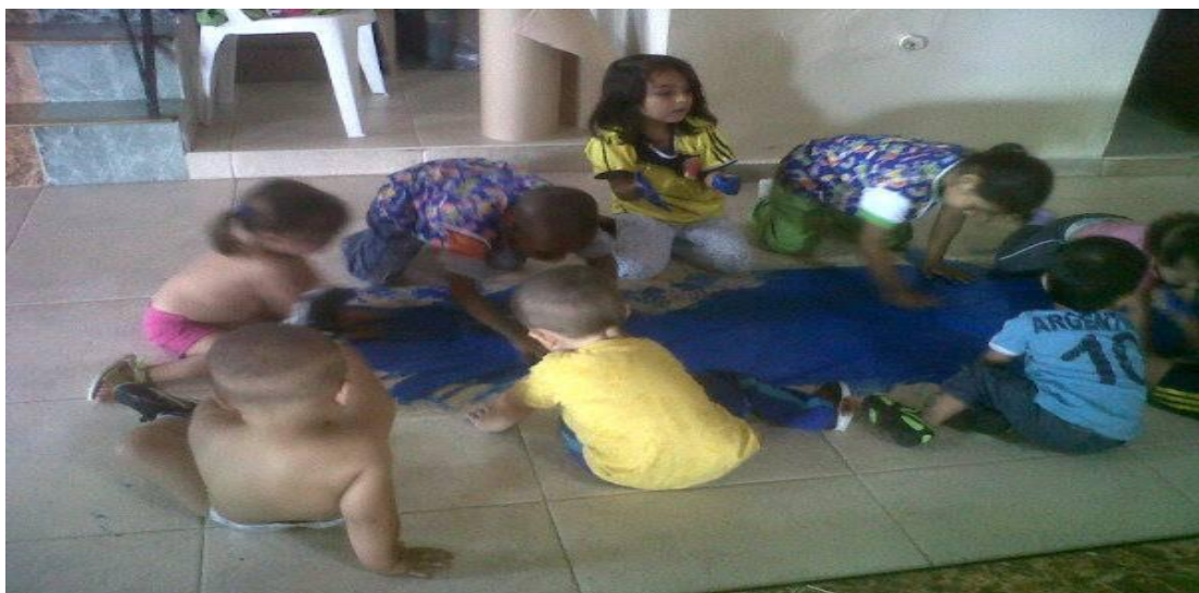
ANEXO 10 En la biblioteca contando el cuento de los animales y su higiene.