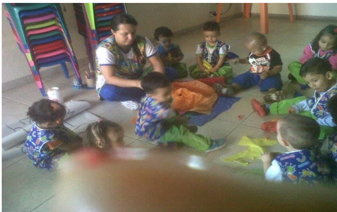
ANEXO 7 Los títeres hablando de la higiene y el cuidado del cuerpo