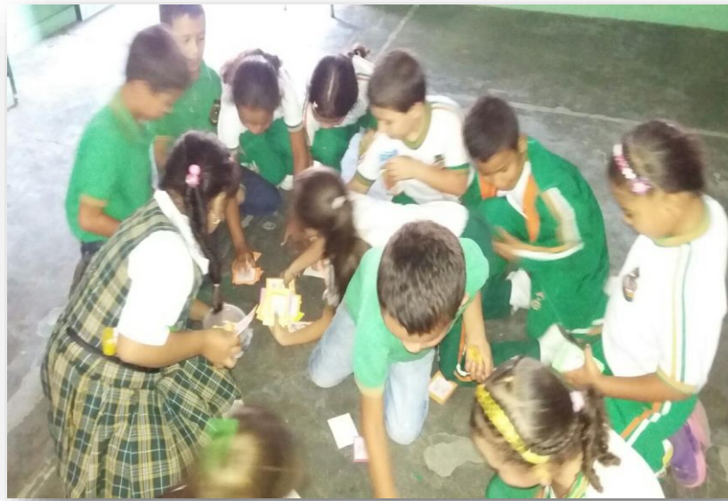
Figura 2. Foto Sobre el Trabajo en equipo, hacia Aprendizajes Cooperativos.

para su vida diaria. Por esta razón, la metodología SCORE: una propuesta pedagógica para desarrollar las habilidades sociales, hacia un aprendizaje cooperativo, lleva a comprender que cooperar es compartir experiencias significativas, trabajar en equipo para lograr metas compartidas y así obtener beneficios para todos los miembros de un grupo.