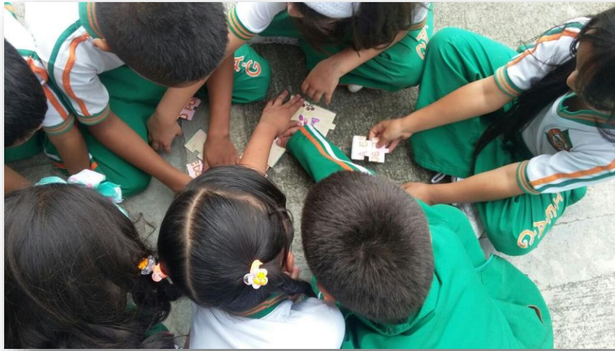
Figura 1. Foto que evidencia la Ayuda y la cooperación, en busca de un Fin en común.

Lo que propende la metodología SCORE aplicada en el campo educativo es, generar un cambio tanto al interior del docente en su mentalidad, al interior del colegio en su pedagogía y al interior del niño en sus paradigmas infantiles, es decir, porque un niño no puede dar los buenos días, porque un niño no puede dar las buenas tardes o las buenas noches, porque un niño no puede aprender a respetar la naturaleza, un árbol, un pájaro, un perro o simplemente respetar las habilidades sociales básicas para convivir en sociedad. A veces se espera a que el niño cumpla ocho, diez años, para inculcarles buenos valores y unas habilidades sociales, qué porque los niños no entienden, no, la metodología SCORE desde el autocontrol, permite y le ayuda al niño a ejercer auto control en sí mismo y en el de al lado, es decir, respetar los límites para generar mejores habilidades sociales. Esta metodología tiene como gran hipótesis que, al crear mejores ciudadanos desde las habilidades sociales, se creara mejor cuidado y todo se forma al interior del hogar y al interior del aula.