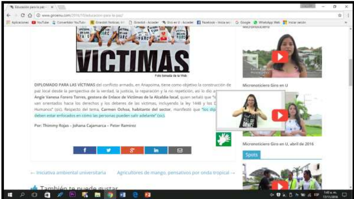
Pantallazo de la plataforma de periódico Giro en U