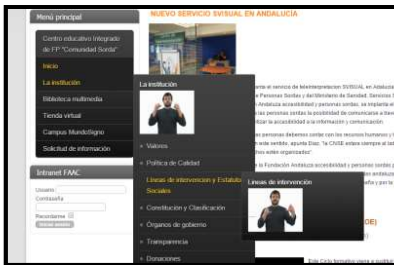
Pantallazo tomado de la página de la Fundación Andaluz

Se hizo con los primeros siete menús principales de la parte superior y con los siguientes 27 que se despliegan de esos siete primeros: para una mayor explicación del contenido de cada uno. Los gifs fueron realizados por un intérprete del Lenguaje de Señas Colombiano (LSC), nativo de Girardot, y tal como se aprecia en la ilustración 5. A su vez, se espera incorporar un botón especial en los artículos para que al poner el cursor sobre él aparezca una pantalla emergente con el intérprete, que leerá o traducirá el contenido de la noticia en LSC.