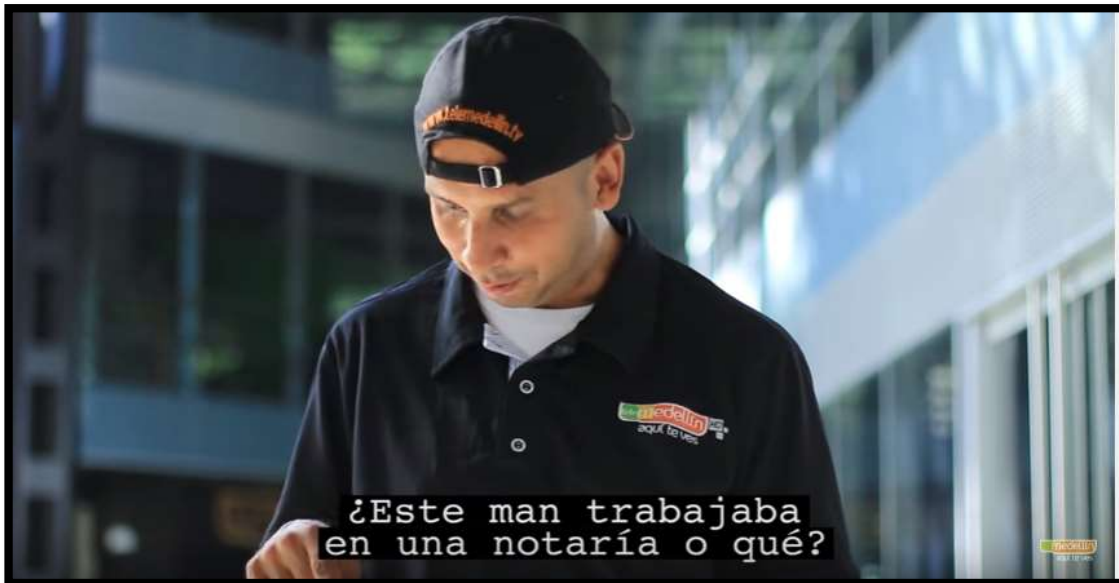
Ilustración 2: Sistema Closed Caption en Telemedellín.

Pantallazo tomado de la página de Telemedellin en YouTube.