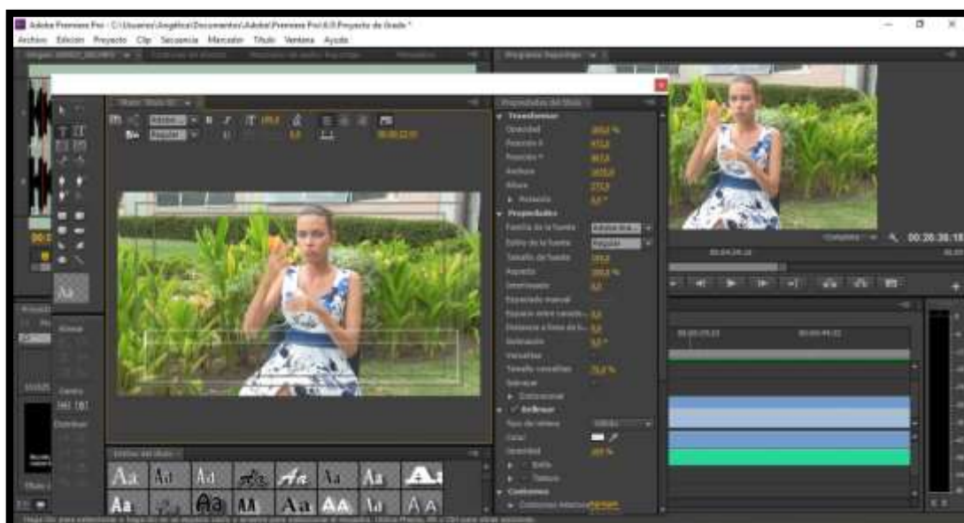
Pantallazo de la edición de la muestra audiovisual