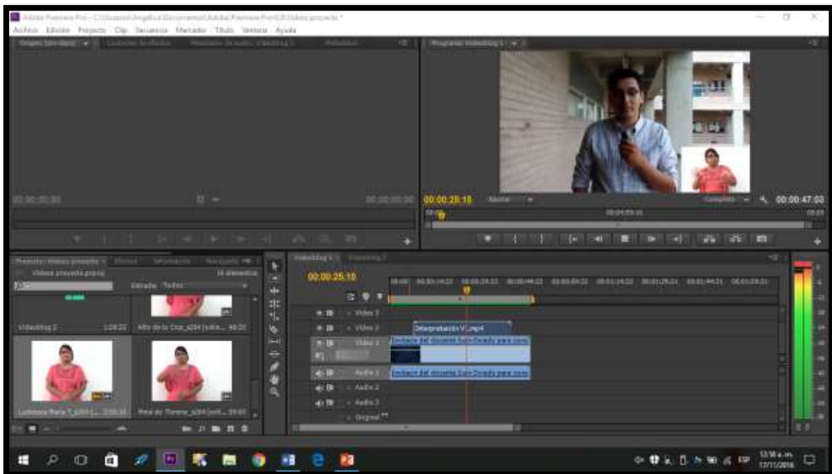
Pantallazo de la plataforma de periódico Giro en U