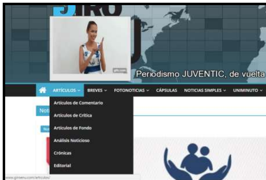
Pantallazo de la plataforma de periódico Giro en U