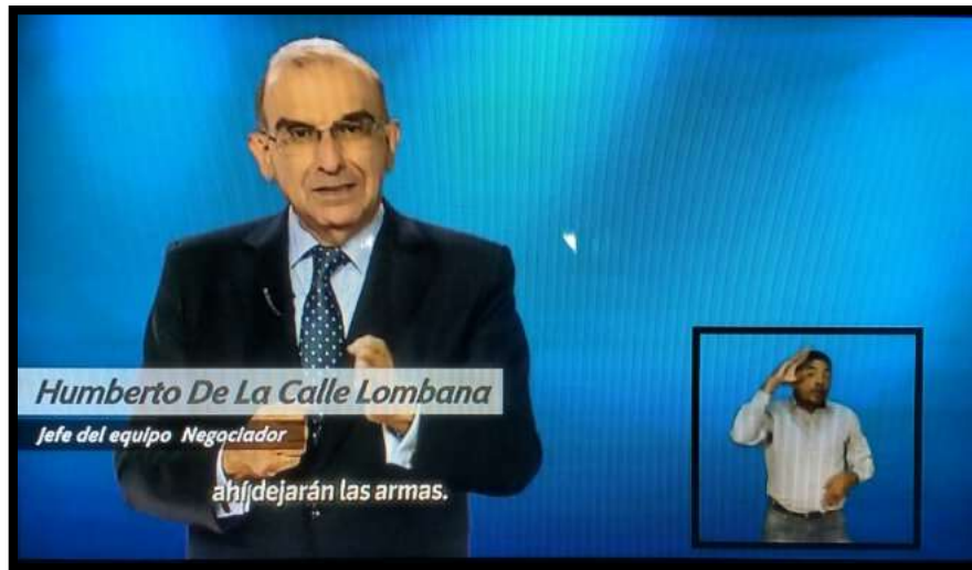
Pantallazo tomado de propaganda de la Gobernación.