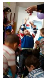
(Octubre 01 y 08 del 2016 actividad “mundo de la fabulas” para estos dos días de actividad se contó con un aproximado de 21 niños y niñas)