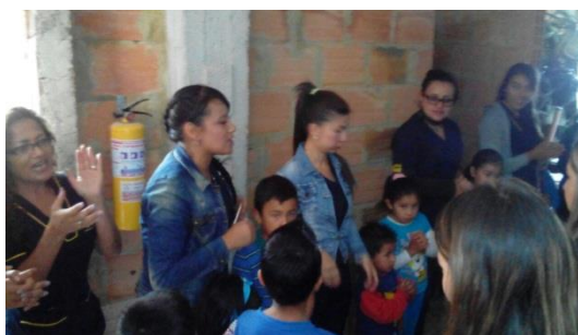
(Abril 09 del 2016 actividad aula móvil “Mundo mágico de literatura” Corporación cristiana creciendo juntos, barrio rincón del lago)