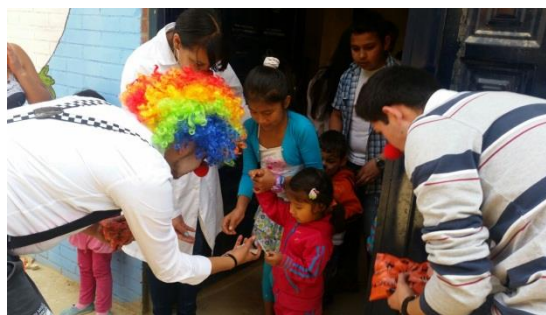
(Abril 23 del 2016 “celebración día del niño” corporación cristiana creciendo juntos, Barrio rincón del lago)