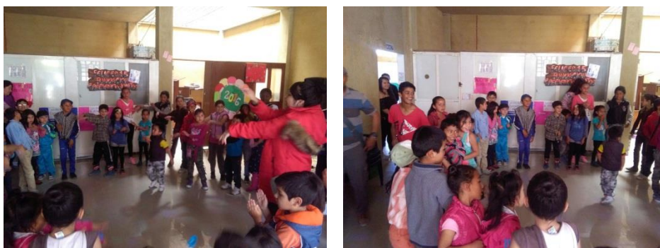
(Agosto 20 del 2016 actividad de “bienvenida” al grupo de semillitas, Contando con la participación de 25 niños y niñas)

Se realizaron diversas rondas infantiles y se entonaron canciones, dando a los niños y niñas del grupo de semillitas confianza para que siguieran asistiendo a las demás actividades ya planeadas además se les brindo un refrigerio a manera de compartir. Este día se evidencio alegría y entusiasmo por parte de los asistentes.