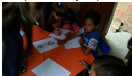
(Septiembre 24 del 2016 actividad “mundo de las caricaturas” Se contó con una asistencia de 20 niños y niñas)