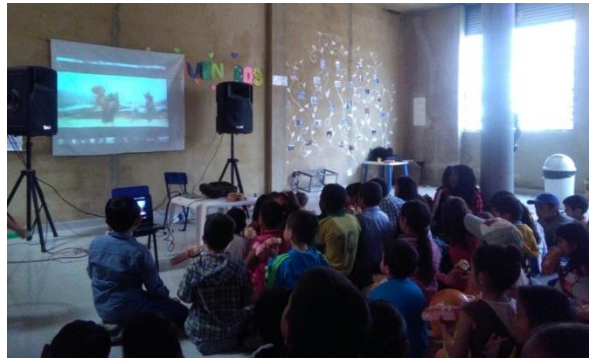
(Noviembre 5 del 2016 actividad “mundo de películas” para esta actividad se contó con una asistencia de 25 niños y niñas)

Ellos reconocieron el nombre de la película y hablaron sobre ella frente al grupo. Por medio de esta actividad se busca potenciar habilidades de concentración, seguimiento de instrucciones, comunicación, Valores (respeto a la opinión del otro, tolerancia, amabilidad, escucha). Los recursos utilizados fueron: Video, Video Bean. Computador, parlantes, sillas.