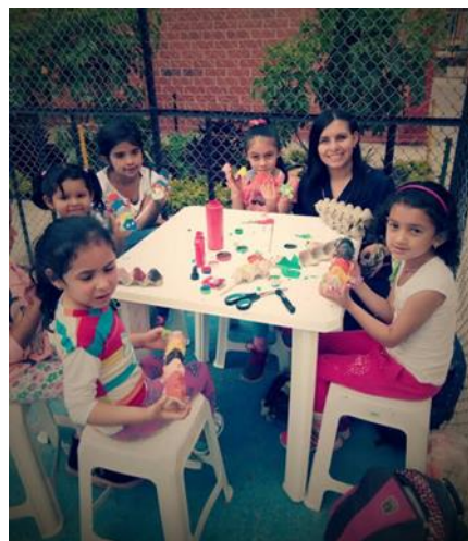
(Abril 16 del 2016, actividad “taller artístico para niños” Barrio bosques de zapan)