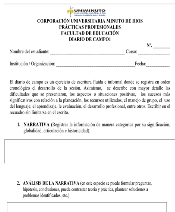
Figura 2 Formato diario de campo UNIMINUTO

El diario de campo debe permitirle al investigador un monitoreo permanente del proceso de observación. Puede ser especialmente útil [...] al investigador en él se toma nota de aspectos que considere importantes para organizar, analizar e interpretar la información que está recogiendo. (p.70)