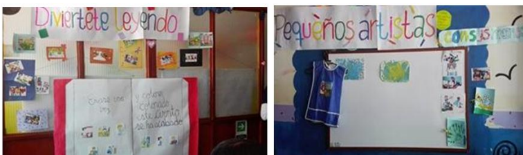
Figura 3 Rincones

Evidencias recolectadas a lo largo del proceso desarrollado con los grupos focales en la Jardín Infantil “Mi Propio Mundo”