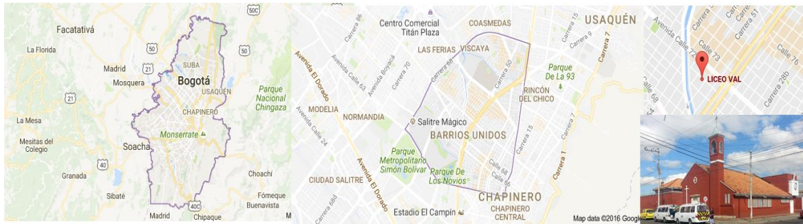
Figura 1. Ubicación geoespacial del Liceo VAL