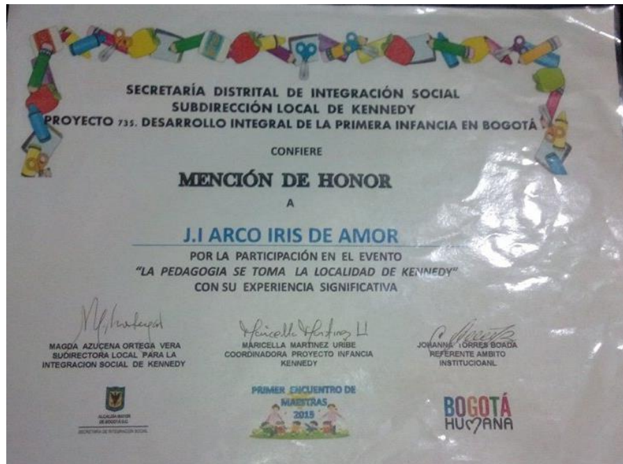
Figura 69. Participación como experiencia significativa. Jardín Infantil Arcoíris de Amor.

Sistematización de la experiencia La lectura visual como estrategia de aprendizaje significativo.