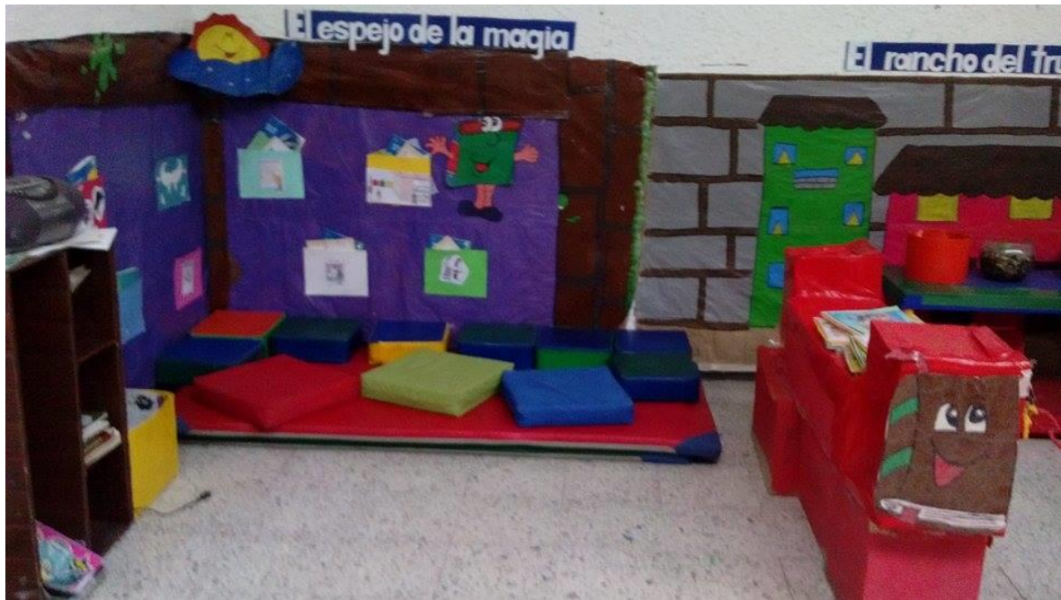
Figura 55. Espacio destinado para fortalecer la lectura visual, CDI Cafam.

La lectura visual como estrategia de aprendizaje significativo.