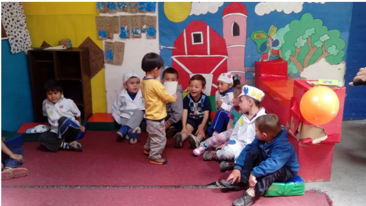
Figura 52. Leyendo imágenes de manera grupal, CDI Cafam