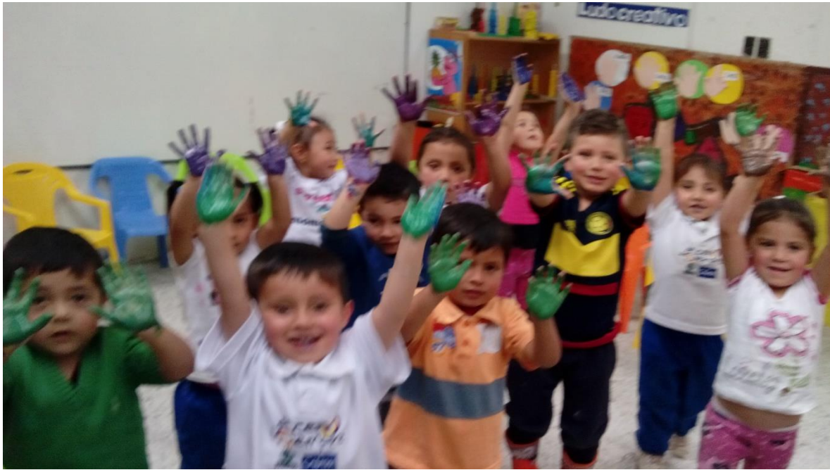
Figura 47. Exploración de nuevos contextos, CDI Cafam.

Sistematización de la experiencia La lectura visual como estrategia de aprendizaje significativo.