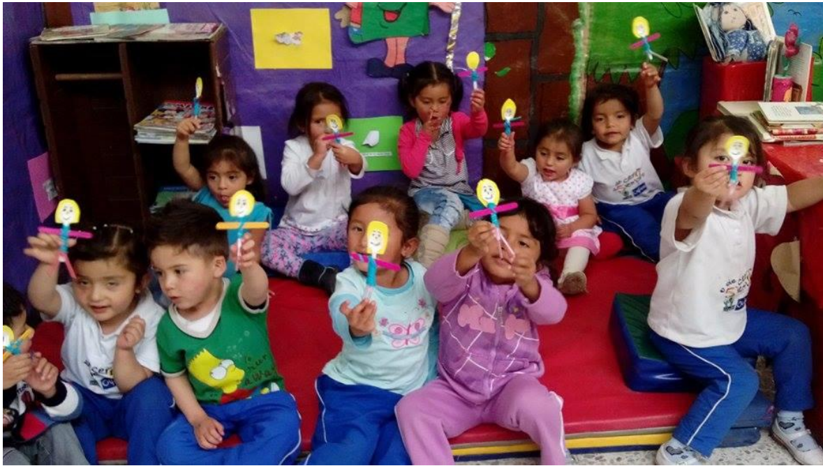
Figura 45. Construcción de títeres a partir de la lectura de sí mismos, CDI Cafam.

La lectura visual como estrategia de aprendizaje significativo.