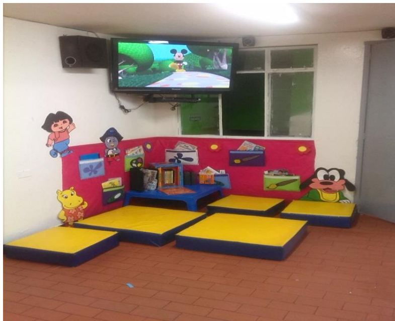
Figura 42 Ambientación espacio de lectura visual, Jardín Infantil Arcoíris de Amor.