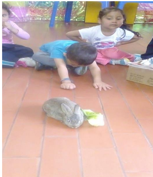
Figura 60. Visualizando las características del conejo, Jardín Infantil Arcoíris de Amor