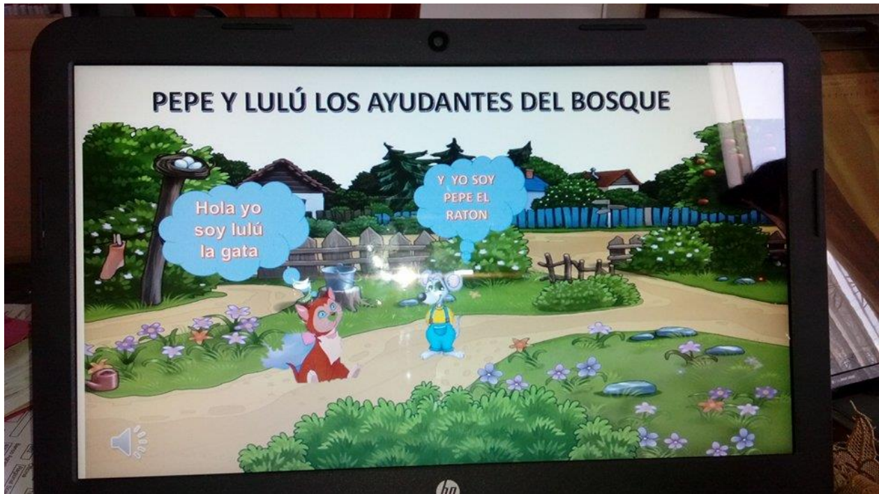
Figura 75. Elaboracion y reproduccion cuento digital.

Sistematización de la experiencia La lectura visual como estrategia de aprendizaje significativo.