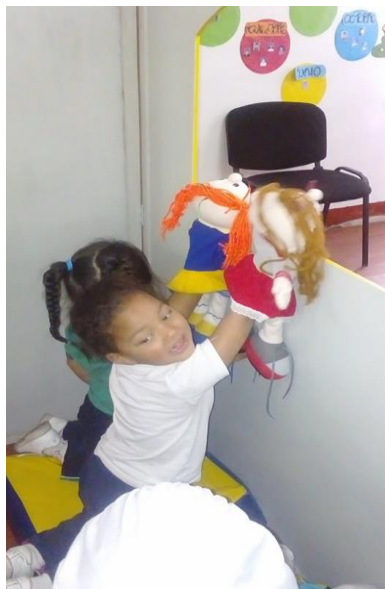
Figura 64. Desarrollo de la comunicación verbal a través de la imaginación, , Jardín Infantil Arcoíris de Amor.