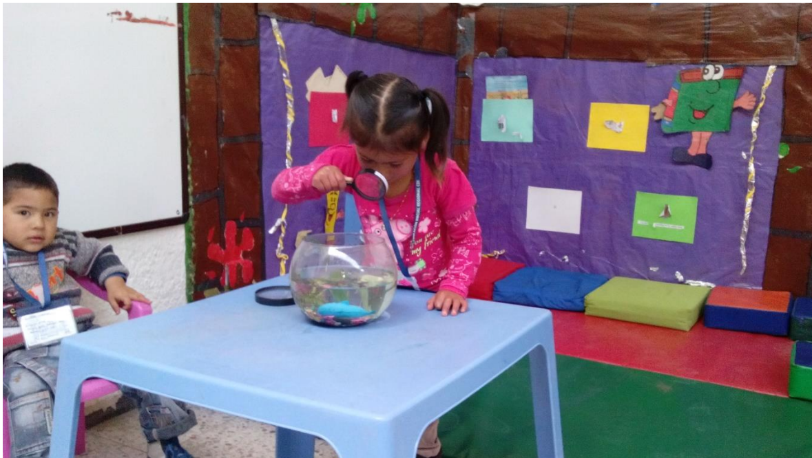
Figura 50. Explorando mi entorno visual, CDI Cafam.