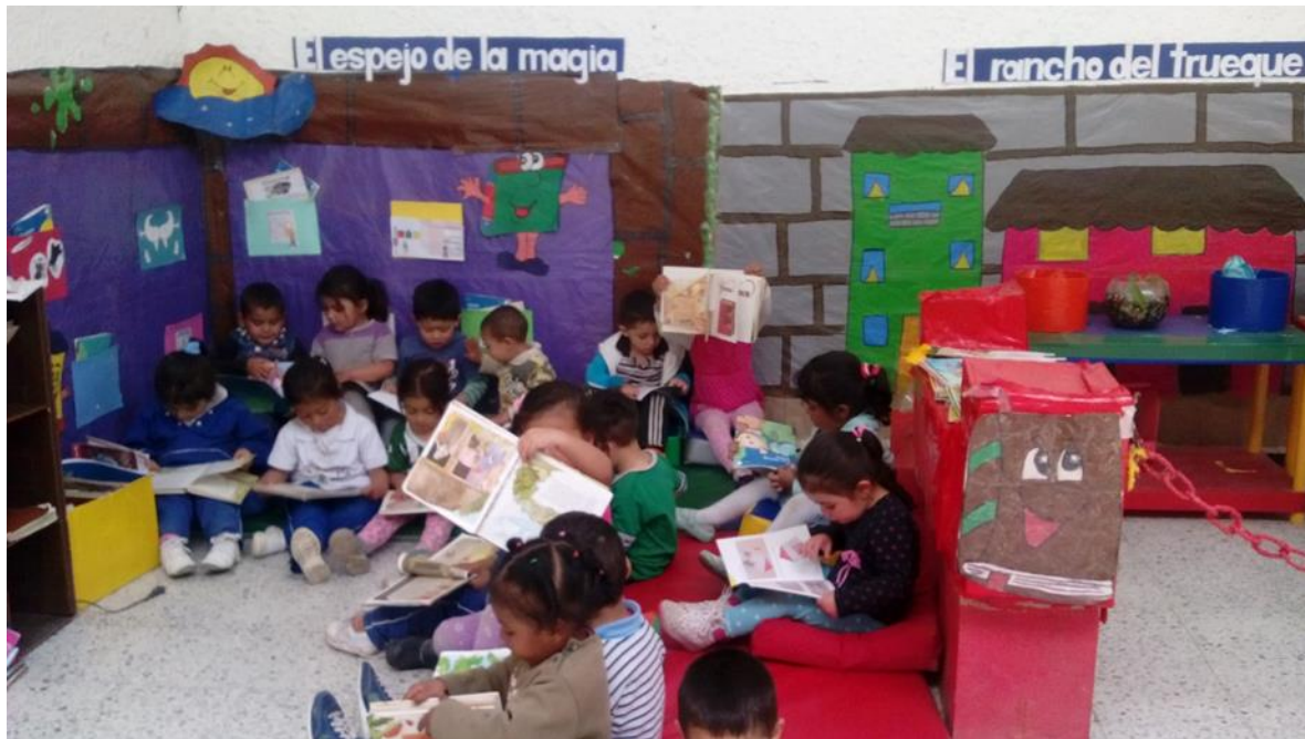
Figura 43. Construyendo historias a partir de las imágenes, CDI Cafam.

La lectura visual como estrategia de aprendizaje significativo.