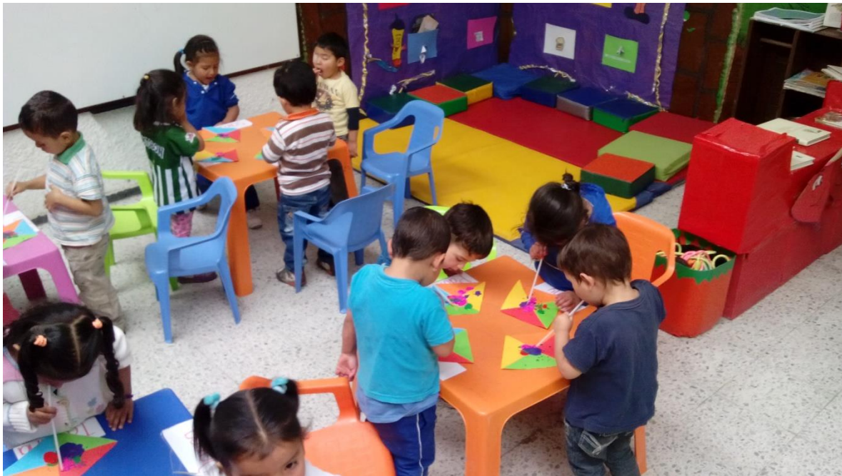
Figura 48. Construyendo imaginación a través de mi lectura visual. CDI Cafam.