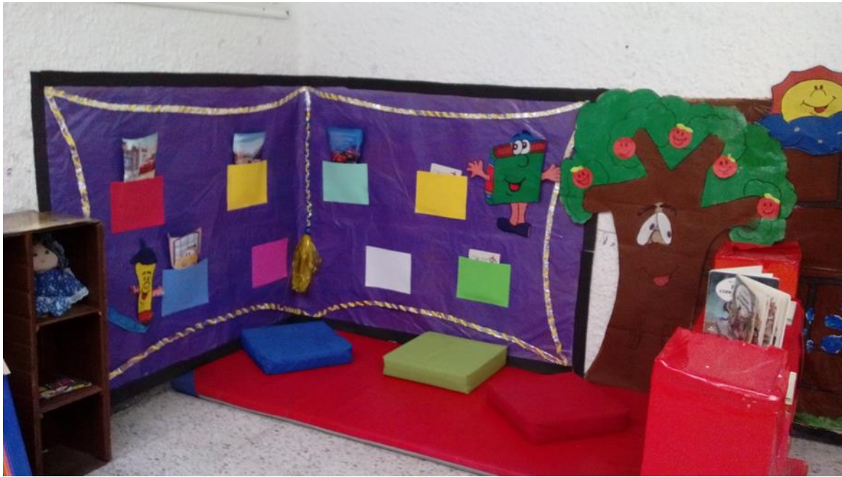
Figura 41 Ambientación del espacio de lectura visual CDI Cafam.

Sistematización de la experiencia La lectura visual como estrategia de aprendizaje significativo.