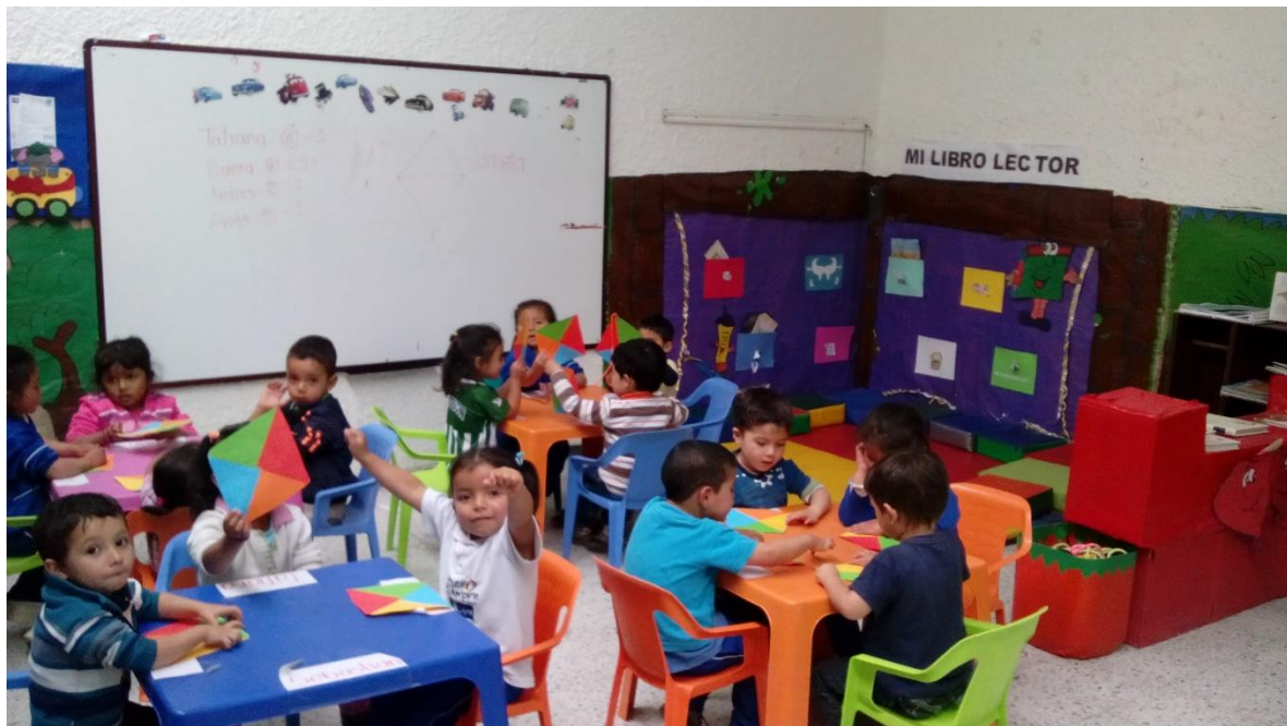
Figura 44. Construyendo objetos partir de la lectura, CDI Cafam.