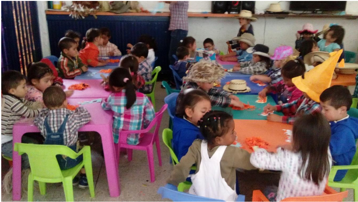
Figura 49. Explorando mi comunicación, CDI Cafam.

Sistematización de la experiencia La lectura visual como estrategia de aprendizaje significativo.