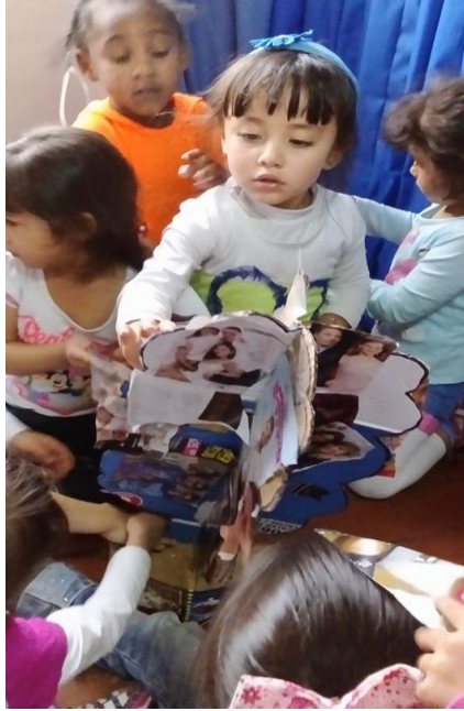
Figura 61. Recorto, pego y construyo un árbol, Jardín Infantil Arcoíris de Amor

Sistematización de la experiencia La lectura visual como estrategia de aprendizaje significativo.