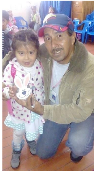
Figura 57. Acompañamiento familiar siembro y observo el crecimiento de una semilla, Jardín Infantil Arcoíris de Amor.

La lectura visual como estrategia de aprendizaje significativo.