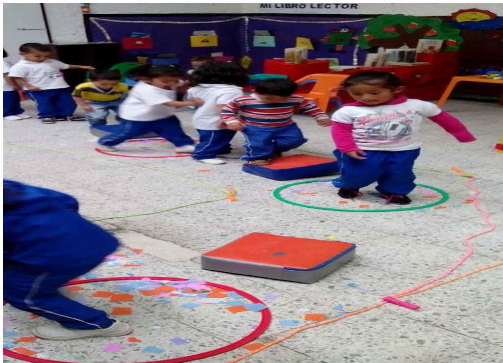
Figura 56. El juego como imitación, CDI Cafam.