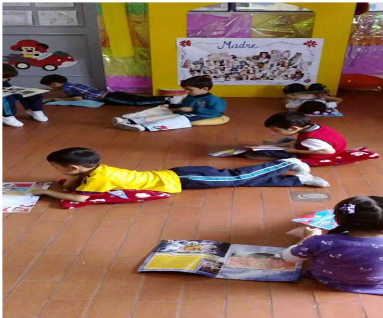
Figura 66. Reconociendo e interpretando imágenes, Jardín Infantil Arcoíris de Amor.