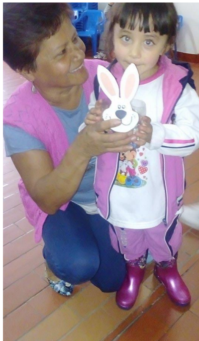
Figura 58. Acompañamiento familiar cuidado del medio ambiente. Jardín Infantil Arcoíris de Amor.