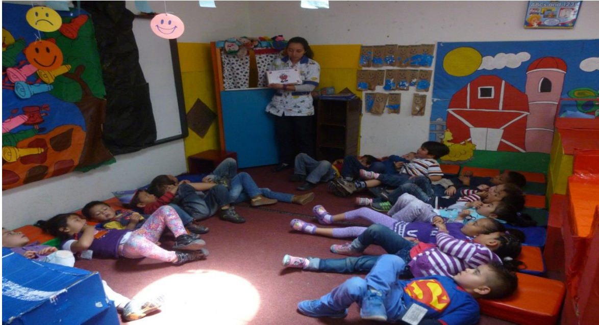
Figura 53. Narrando historias habilidades de imaginación, CDI Cafam.

Sistematización de la experiencia La lectura visual como estrategia de aprendizaje significativo.