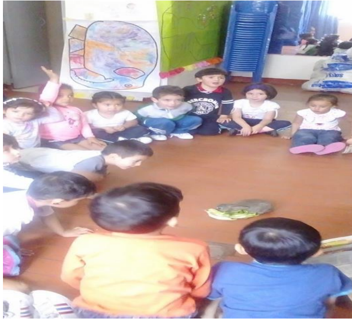
Figura 67 Lectura visual mediante la socialización grupal, Jardín Arcoíris de Amor

Sistematización de la experiencia La lectura visual como estrategia de aprendizaje significativo.