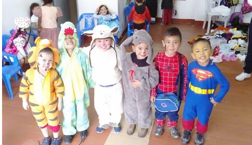
Figura 65. La dramatización como fuente de la percepción del entorno

Sistematización de la experiencia La lectura visual como estrategia de aprendizaje significativo.