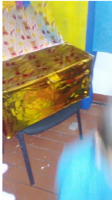
Figura 62. El baúl de los recuerdos, Jardín Infantil Arcoíris de Amor