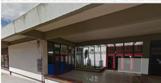
Figura 2. Mapa demográfico CDI CAFAM- Chocontá recuperado de: https://www.google.com.co/maps/@5.1446839,-73.6866565,3a,75y,21.92h,86.48t/data=!3m6!1e1!3m4!1sViJ7hMJjyYs4vOQBF3fGXQ!2e0!7i13312!8i6656

La lectura visual como estrategia de aprendizaje significativo.