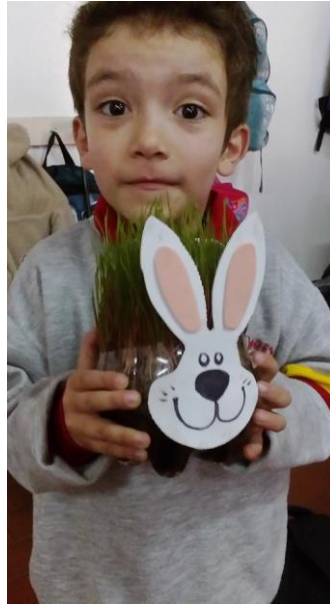
Figura 59. Explorando las características físicas de la planta.

Sistematización de la experiencia La lectura visual como estrategia de aprendizaje significativo.