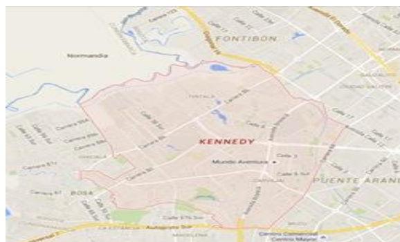
Figura 3 Mapa demográfico de la localidad de Kennedy-Bogotá recuperado de: https://www.google.com.co/maps/place/Kennedy,+Bogot%C3%A1/@4.6300301,-74.1868977,13z/data=!3m1!4b1!4m2!3m1!1s0x8e3f9c20c1186379:0x72c48cbe21e275ac

Sistematización de la experiencia La lectura visual como estrategia de aprendizaje significativo.