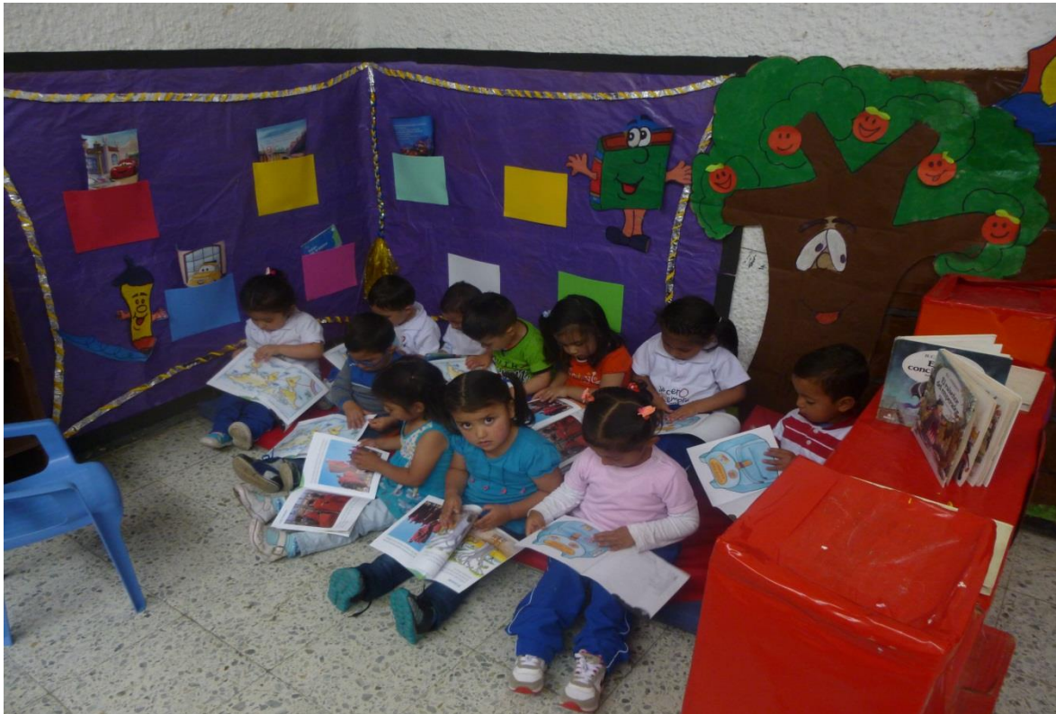
Figura 53. Manejo y cuidado de mi lectura, CDI Cafam.