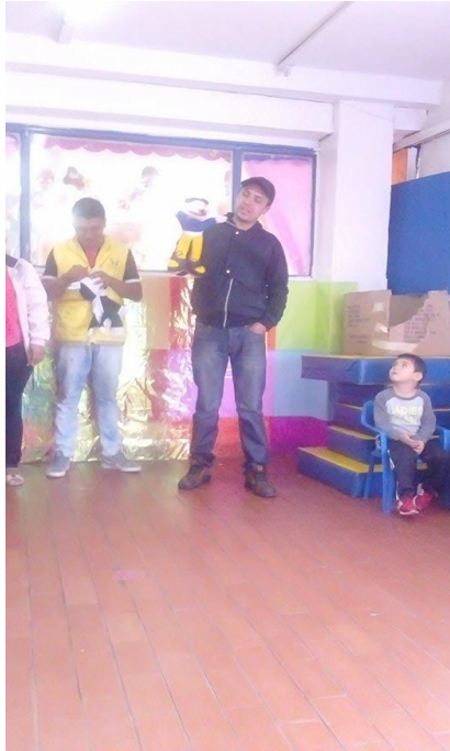
Figura 63. Los padres de familia como ejes de corresponsabilidad social, Jardín Infantil Arcoíris de Amor.

La lectura visual como estrategia de aprendizaje significativo.