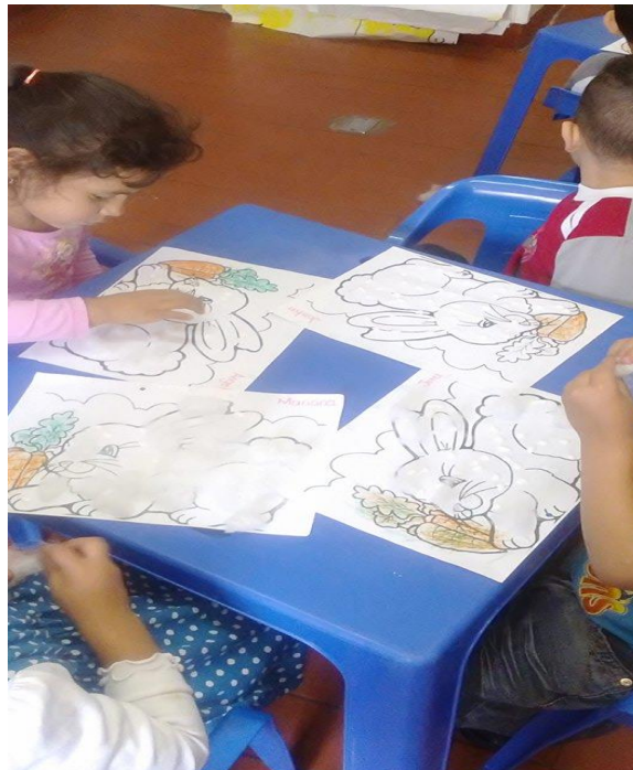
Figura 68 Construcción del dibujo, Jardín Arcoíris de Amor