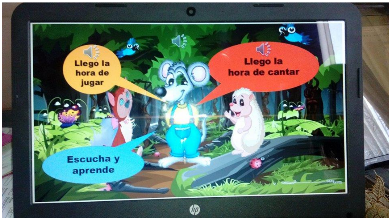
Figura 76. Actividad digital.