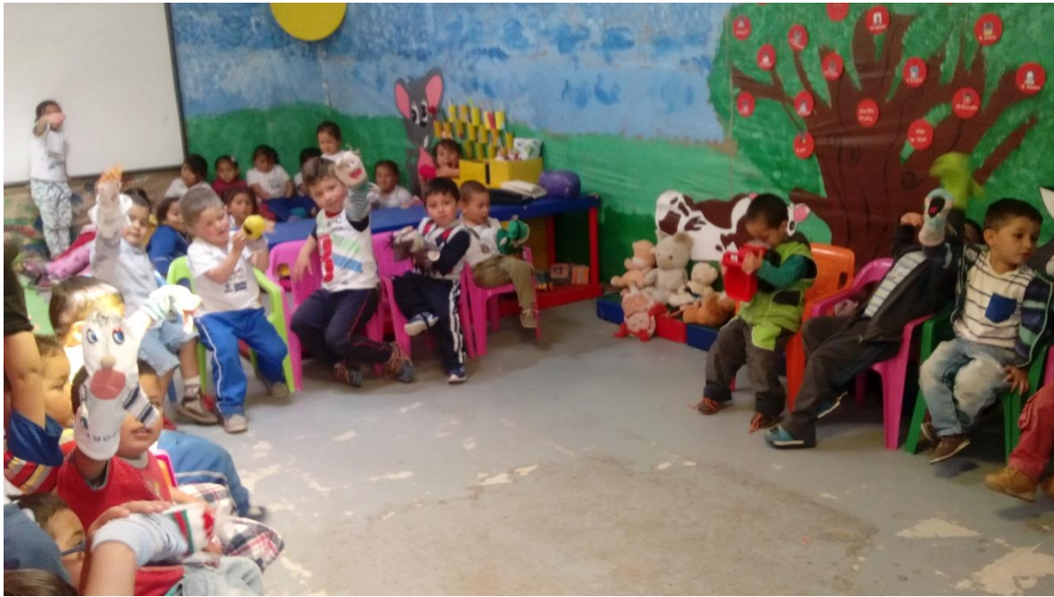
Figura 51. Creando historias con títeres, CDI Cafam.

Sistematización de la experiencia La lectura visual como estrategia de aprendizaje significativo.