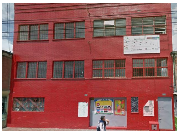
Figura 4. Jardín Infantil Cofinanciado SDIS Arcoíris de Amor de Kennedy-Bogotá recuperado de https://www.google.com.co/maps/@4.6219285,-

La población infantil atendida por el Centro de Desarrollo Infantil Cafam – Chocontá y el Jardín Infantil Cofinanciado por la Secretaria Distrital de Integración Social Arcoíris de Amor, se caracteriza por pertenecer a estratos socioeconómicos 1 y 2, contar con niveles del sisben 1y 2, contando con criterios de priorización para los niños y niñas victimas del desplazamiento, que presenten grados de vulnerabilidad dentro de su contexto social como: pobreza, desnutrición, discapacidad, carencia de apoyo familiar entre otras.