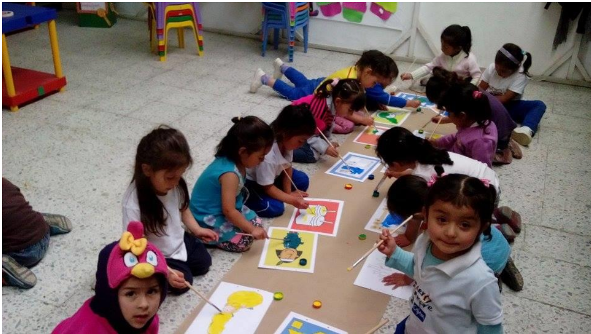
Figura 46. Construyendo imágenes a partir de lecturas visuales, CDI Cafam.