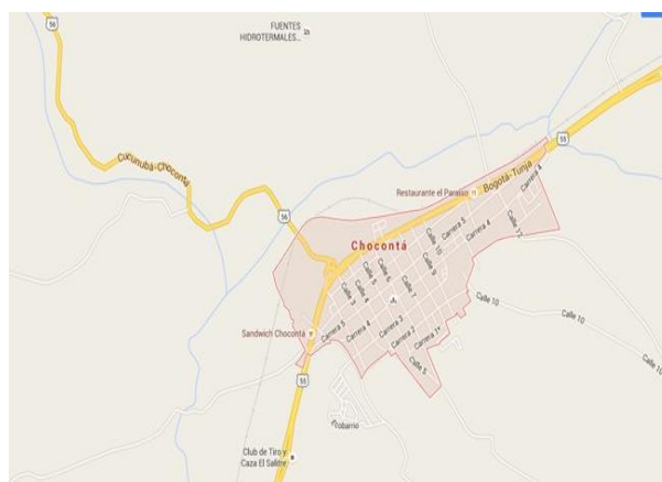
Figura 1. Mapa demográfico del Municipio de Chocontá recuperado de: https://www.google.com.co/maps/place/Chocont%C3%A1,+Cundinamarca/@5.1463374,-73.6921322,15z/data=!3m1!4b1!4m2!3m1!1s0x8e4017a45b62581d:0x92a9911e9249ff8a

Chocontá, es un municipio de Cundinamarca (Colombia), ubicado en la provincia de los Almeidas, se encuentra a 75 km de Bogotá sobre la Troncal Central del Norte. Chocontá en lengua muisca quiere decir «labranza del aliado bueno». Limita por el Norte con Villa pinzón y Cucunubá, por el Sur con Sesquilé y Machetá, por el Oriente con Machetá y Tibirita, por el Occidente con Suesca Situada a 75 km de Bogotá, a 20 km de Sesquilé de un ramal en la playa, Machetá a 18 km hacia los llanos orientales ramal en la represa del Sisga, Villa pinzón a 14 km vía al norte y Suesca a 22 km. (2012)