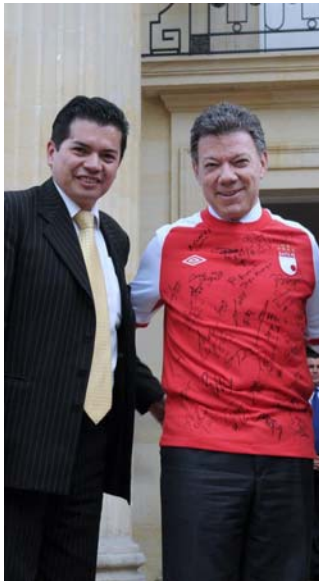
Foto 1. Con el actual Presidente Juan Manuel Santos, durante una visita del equipo de fútbol capitalino Santa Fe, al Palacio de Nariño. Enero 2011.