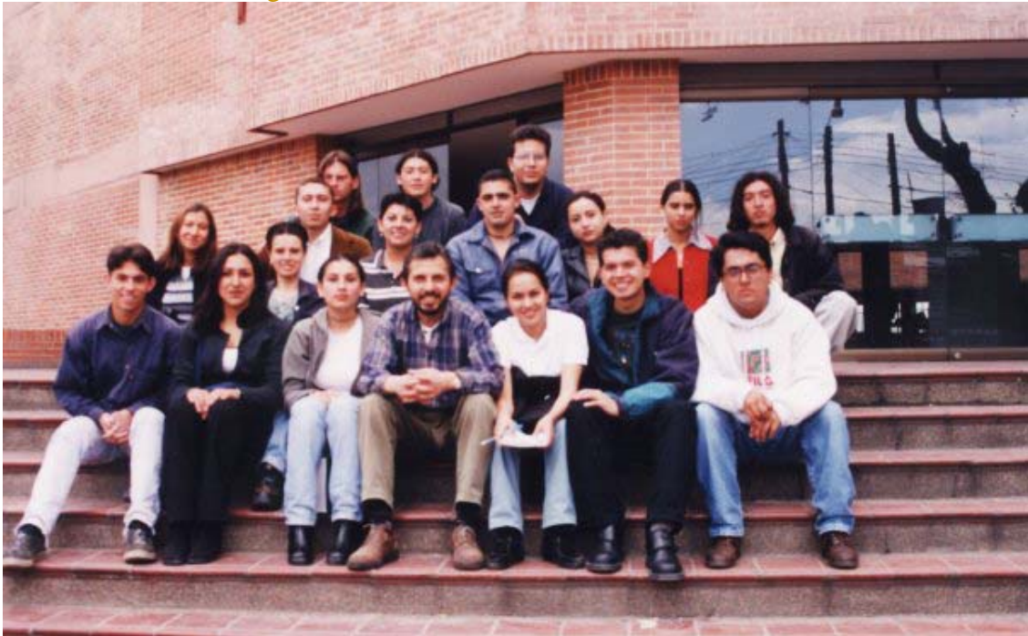
Foto 7. Primer equipo de redacción del periódico Nuevo Milenio de la Facultad de Ciencias de la Comunicación. El periódico tuvo algunas transformaciones, actualmente es el periódico Datéate.

Al mismo tiempo durante mi vida universitaria participé en el comité estudiantil de UNIMINUTO que organizó un encuentro internacional y nacional de estudiantes de Comunicación en 1999, una de las más gratas experiencias en mi paso por la universidad.