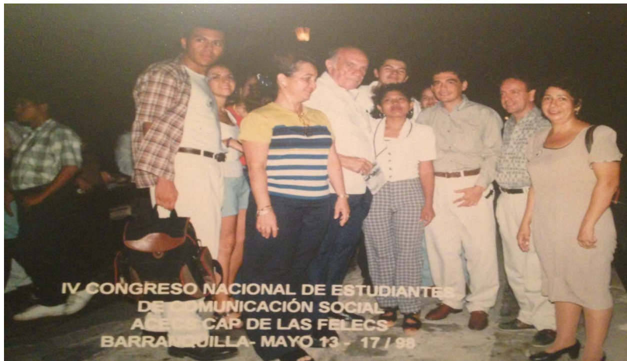
Foto 8. IV Congreso Nacional de Estudiantes de comunicación Social ACECS. Barranquilla. 1998.

Este comité llevó la candidatura para que nuestra universidad organizara el evento, la cual ganamos en la ciudad de Barranquilla en 1998, derrotando a universidades de renombre como La Universidad de la Sabana.