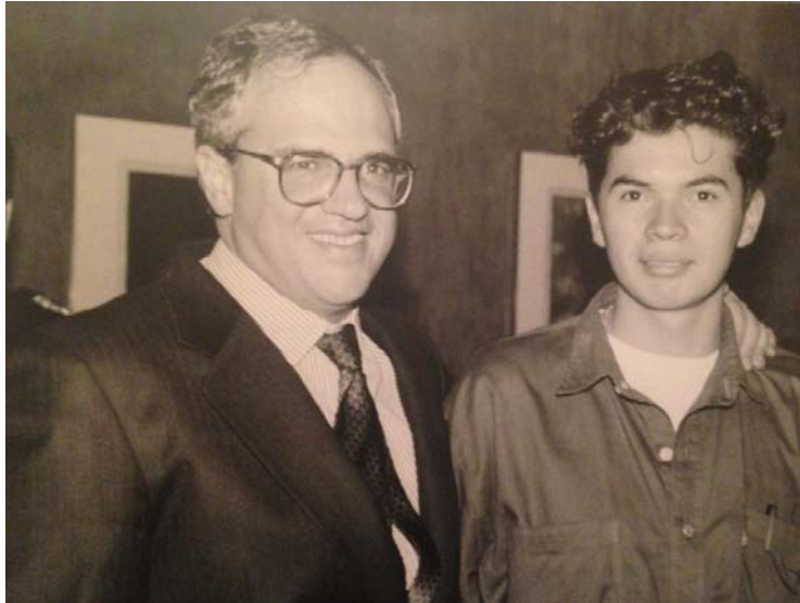
Foto 2. Fotografía tomada en la Secretaría de Prensa en 1995.

Ingresé a la Presidencia de la República en el año de 1995, en aquel entonces culminaba la prestación de mi servicio militar obligatorio, durante el Gobierno de Ernesto Samper.