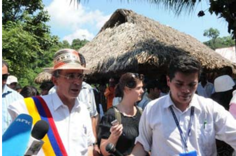
Foto 13. Haciendo reportería con el ex presidente Álvaro Uribe en La Guajira. Mayo 2009.