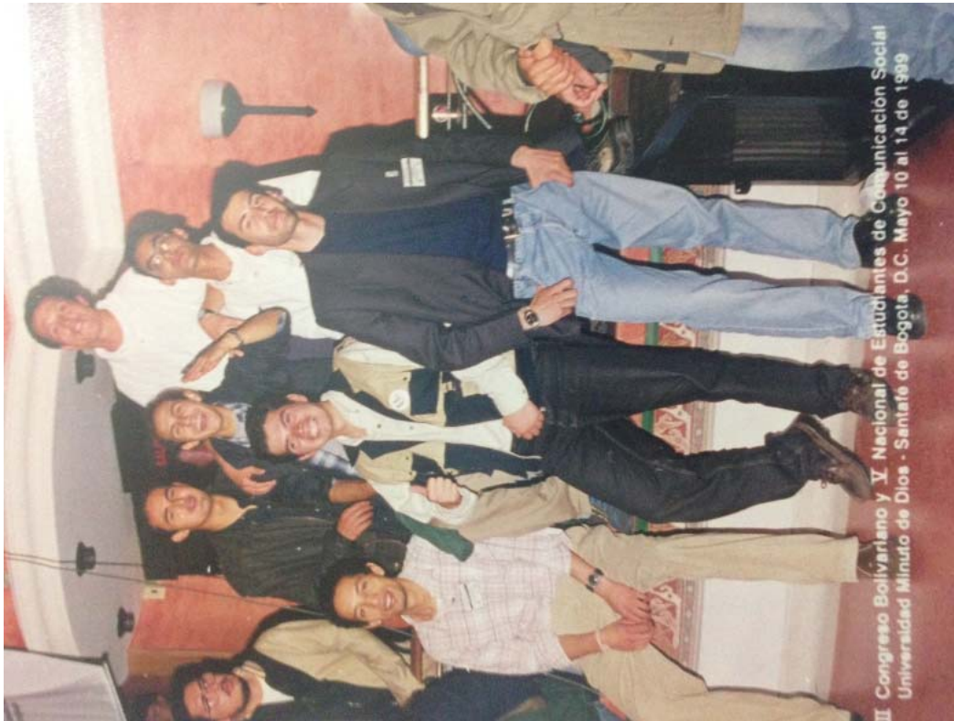
Foto 9. Comité organizador del Congreso Bolivariano y V Nacional de Estudiantes de Comunicación Social. Universidad Minuto de Dios. Santafé de Bogotá. D. C. 1999.