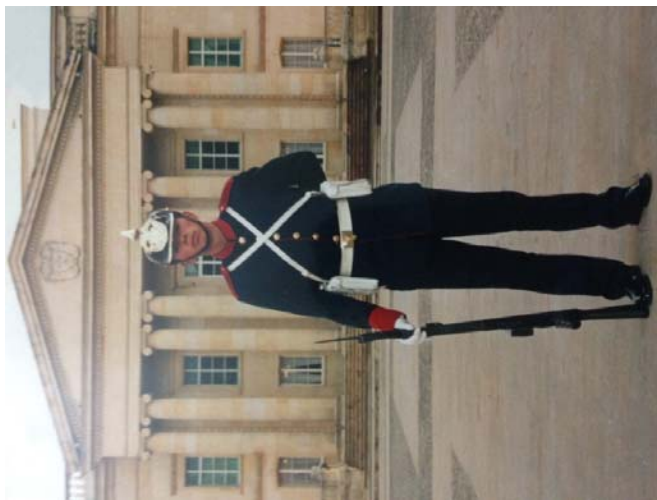
Foto 5. Terminé de prestar mi servicio militar en enero de 1995

En la emisora del ejército el caso de incidencia social fue de gran enseñanza. En los primeros días de estar al aire organizamos en el batallón una jornada cívico-recreativa para la comunidad que vivía en los alrededores, casi todos de estratos bajos, y procedimos a invitarlos por la emisora. El día de la actividad la respuesta de los vecinos fue muy positiva, ya que habíamos preparado todo lo que requería la actividad para 500 personas, y llegaron más de mil. Ahí comprendí el valor del micrófono en un dial.