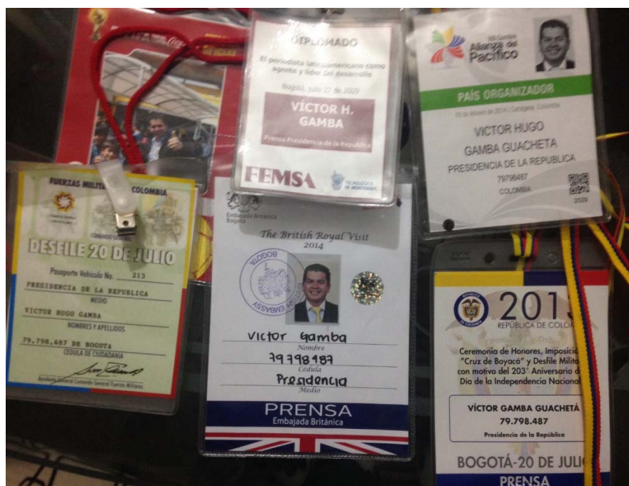
Foto 1. Como Coordinador de Prensa, una de mis responsabilidades en los actos de prensa oficiales era coordinar los momentos logísticos y operativos de la prensa privada que asistía a los eventos presidenciales.

En el actual gobierno de Juan Manuel Santos continué siendo periodista y llegué a editor y también fui sub jefe de prensa de la Campaña Presidencial que lo llevó a su segundo mandato. También he sido el coordinador de prensa y logístico de importantes eventos como la VI Cumbre de las Américas (Cartagena 2012) y los encuentros de la Alianza del Pacífico (2013 y 2014), entre otros.