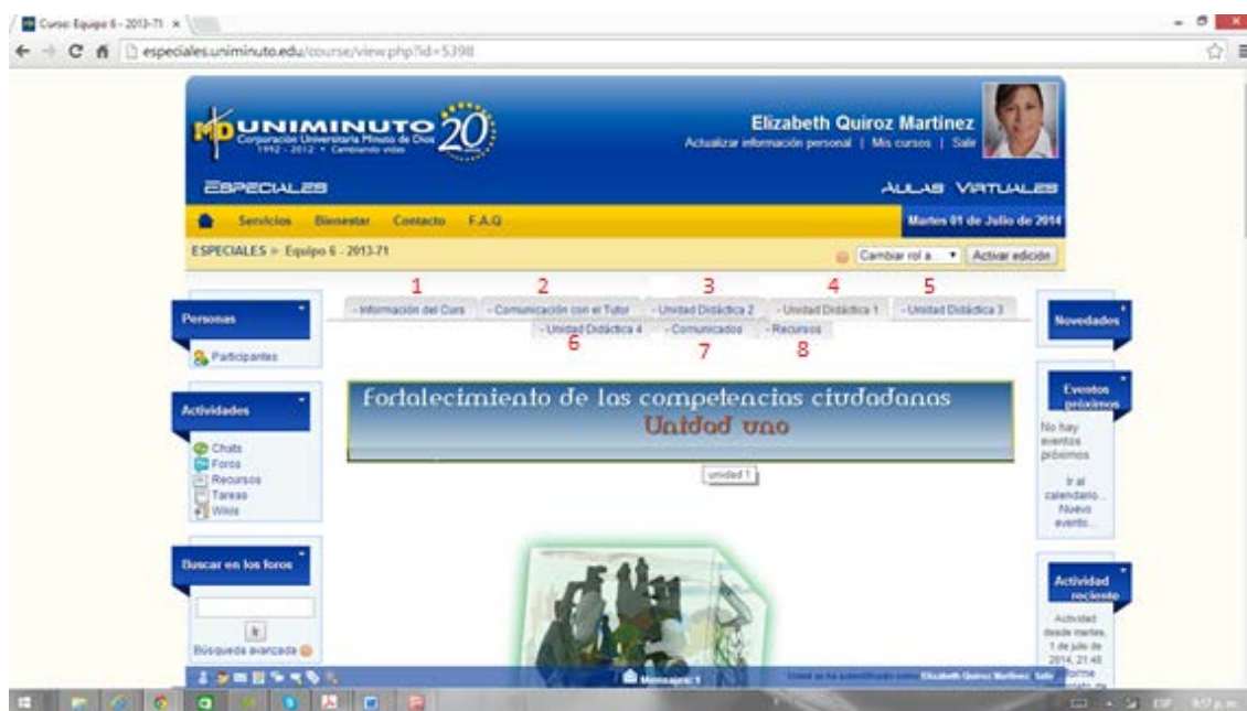
Gráfica 5: Muestra de la implementación del AVA, Ambiente Virtual de Aprendizaje.

A continuación se hace un mostreo de la bienvenida al AVA iniciando con la presentación del voki quien hace la apertura del trabajo, ligado a esto se muestran algunas actividades a trabajar.