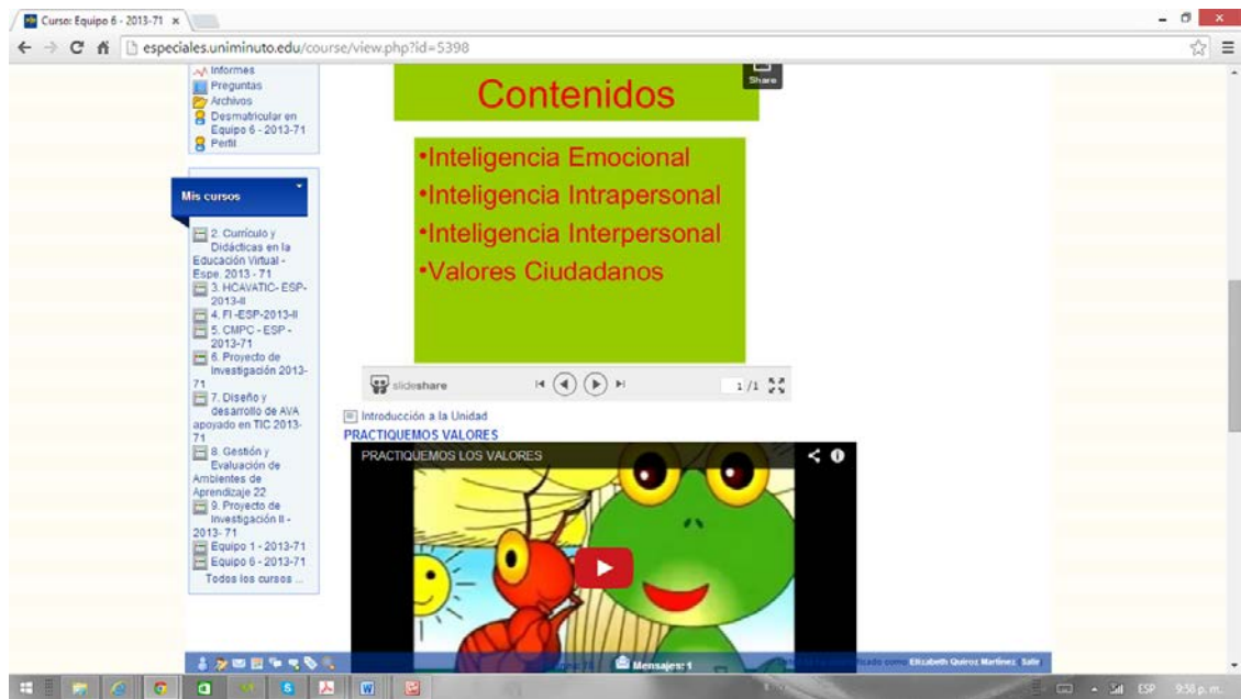
Gráfica 6: Muestra de la implementación del AVA, Ambiente Virtual de Aprendizaje.