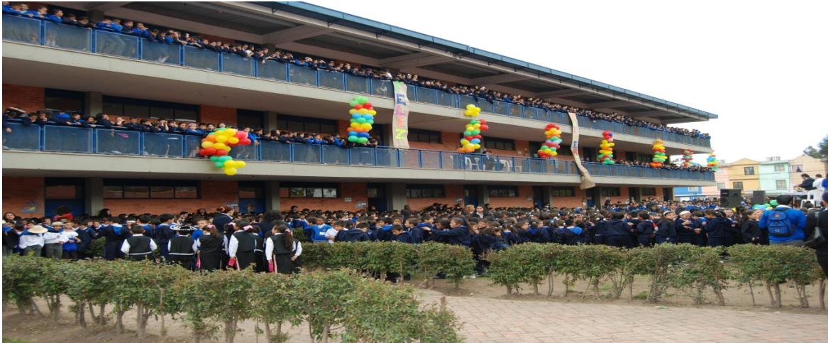
Gráfica 2. Lugar donde se realiza del Proyecto de investigación.

al occidente con el río Bogotá y por al oriente con la Autopista Norte. SEGURIDAD: en esta localidad se presentan 2 delitos por cada 1.000 habitantes y 4 muertes violentas por cada 10.000 habitantes. El delito más común es el hurto a personas con un 42.89% y un 55.04% de las muertes violentas son homicidios.