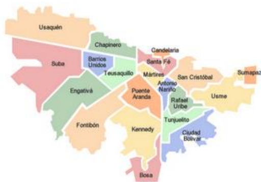
Imagen 6.3- Mapa de Bogotá