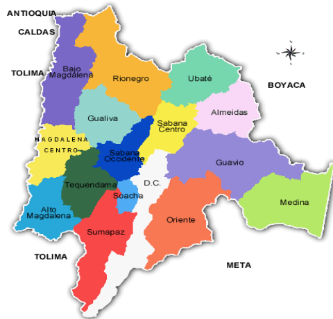
Imagen 6.2- División política Mapa de Cundinamarca