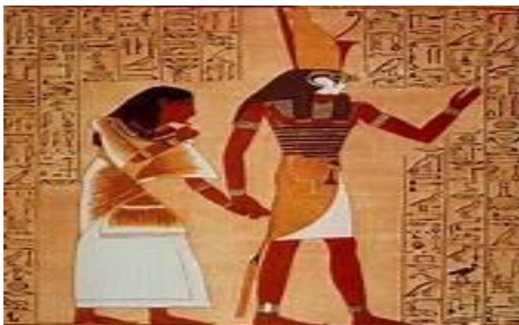
Ilustración 2. El arte egipcio

La naturaleza histórica del arte implica que su estudio debe orientarse en esa dirección. Es decir, el arte no solo refleja los aspectos sociales, políticos y económicos de su época, sino que también actúa como un agente de cambio en la sociedad a lo largo de los siglos. Por esta razón, abordamos los movimientos artísticos considerando su contexto histórico. Comenzamos este análisis desde la Edad Antigua, que comprende aproximadamente desde el tercer milenio a.C. hasta el siglo V d.C.