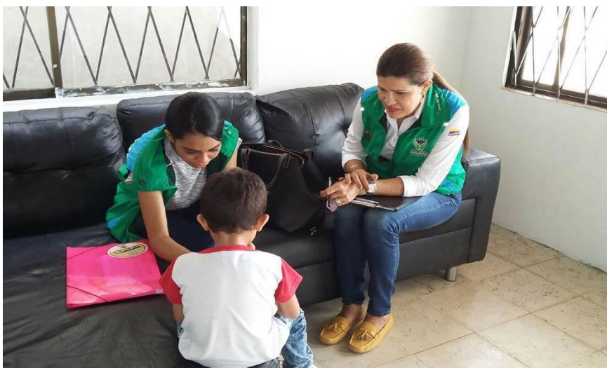
Ilustración 5. Instituto Colombiano del Bienestar Familiar.